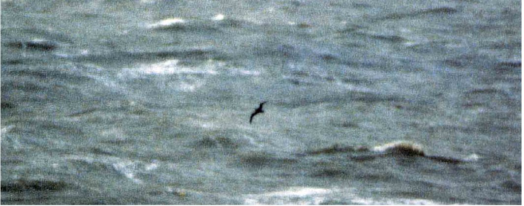
117 Dark gadfly-petrel / donkere stormvogel Pterodroma , Oostende, West-Vlaanderen, Belgium, 7 February 1999

nearly as dark as the mystery petrel; 2 even the darkest individuals show contrastingly pale primary bases; 3 in Northern Fulmar, the bill is paler; 4 the flight was strikingly different from nearly 30 Northern Fulmars seen that day; and 5 the petrel was smaller than Northern Fulmar. Shearwaters have flatter stiffer wings and a more slender body than the mystery petrel. Jaegers have a more falcon-like shape, with more obviously hooked wings. According to Klaus Malling Olsen (pers comm), the bird was definitely not a jaeger. All jaegers show at least some pale shafts (and many also pale bases) to the primaries. There is no reason to consider the Oostende petrel as a melanistic or oiled individual of a regularly occurring species.