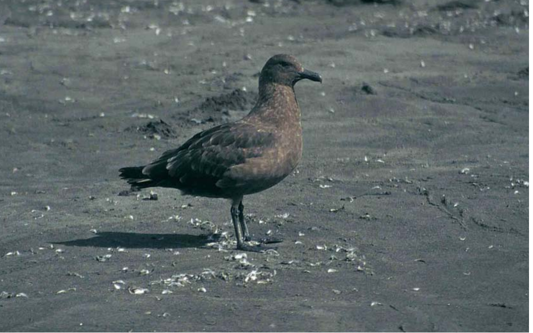
122 Subantarctic Skua / Lönnerberg's Grote Jager Stercorarius antarcticus lonnbergi , immature female, Kerguelen Archipelago, October 1996. Plain brown immature with pale nose-band