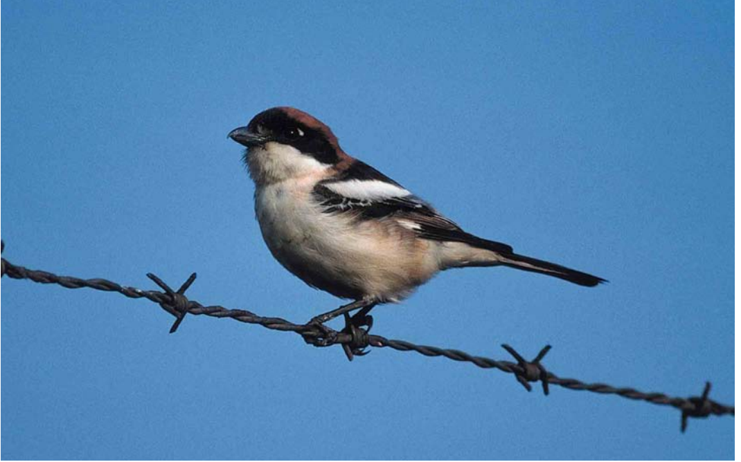
155 Roodkopklauwier / Woodchat Shrike Lanius senator , Maasvlakte, Zuid-Holland, 14 mei 2000