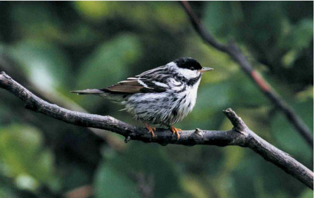
135-136 Blackpoll Warbler / Zwartkopzanger Dendroica striata , Seaforth Docks, Merseyside, England, 2 June 2000