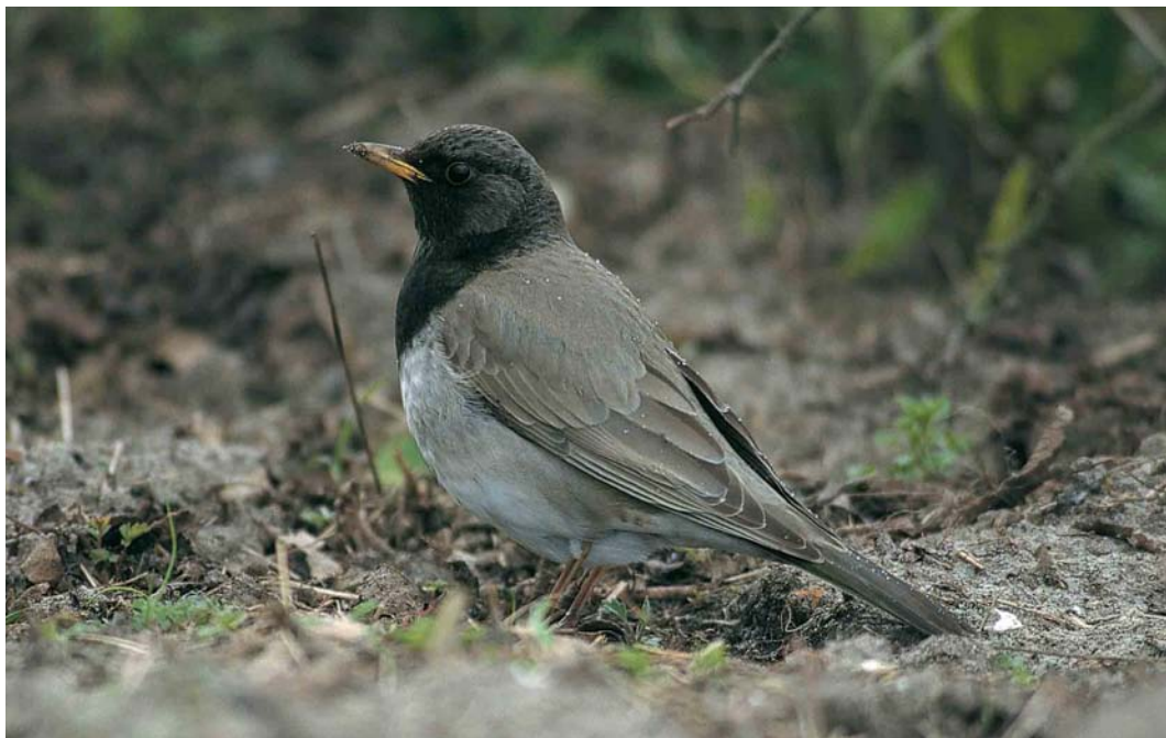
113 Zwartkeellijster / Black-throated Thrush Turdus ruficollis atrogularis , adult mannetje, West-Terschelling, Terschelling, Friesland, 13 april 1998

gevallen in België houdt mogelijk verband met het feit dat de voorjaarsvangst van lijsters reeds in 1875 werd afgeschaft (Gunter De Smet in litt).