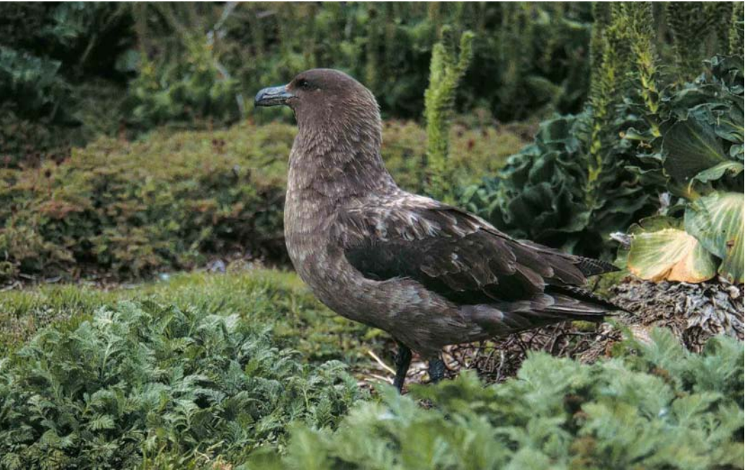
119 Subantarctic Skua / Lönnsbergs Grote Jager Stercorarius antarcticus lonnbergi , female, Mayes Island, Kerguelen Archipelago, December 1995 ( Frédéric Jiguet ). Very large and powerful female with huge deep bill