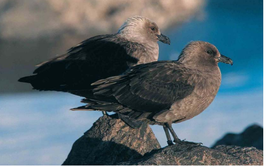
118 South Polar Skuas / Zuidpooljagers Stercorarius maccormicki , Adelie Land, Antarctica, January 1998. Note large and huge bill of female in background and slimmer and smaller bill of male in foreground