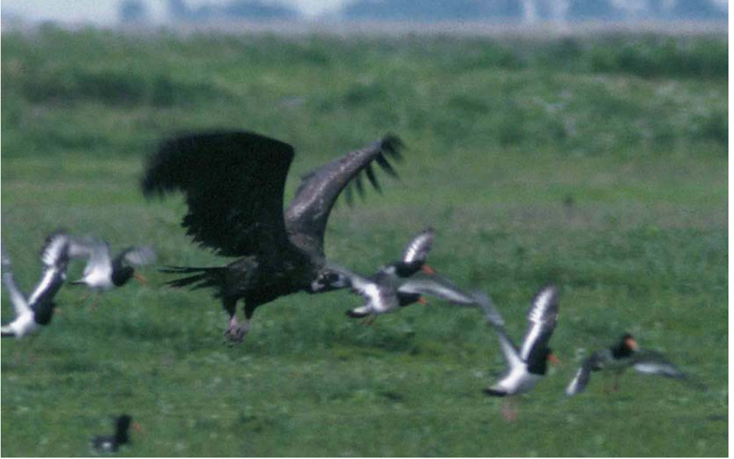
163 Monniksgier / Eurasian Black Vulture Aegypius monachus , onvolwassen, Bildtpollen, Ferwerderadiel, Friesland, 14 juli 2000 (Arnaud B van den Berg)

1948 werd geschoten in Beneden-Leeuwen, Gelderland. Over de herkomst van de Friese vogel is weinig te zeggen. Door het ontbreken van ringen of gebleekte pennen is het onwaarschijnlijk dat hij afkomstig is van een herintroductieproject zoals dat in de Cévennes, Frankrijk. Het is interessant dat Monniksgieren van Azië in tegenstelling tot die van Europa bekend staan om hun trek- en zwerfgedrag. In Handbuch der Vögel Mitteleuropas 4 (Glutz von Blotzheim et al 1971) wordt vermeld dat de soort vooral in april-september ten noorden van het broedgebied voorkomt: in Europa als dwaalgast (met in Noord-Europa slechts enkele aanvaarde gevallen) maar in de steppen van West-Siberië