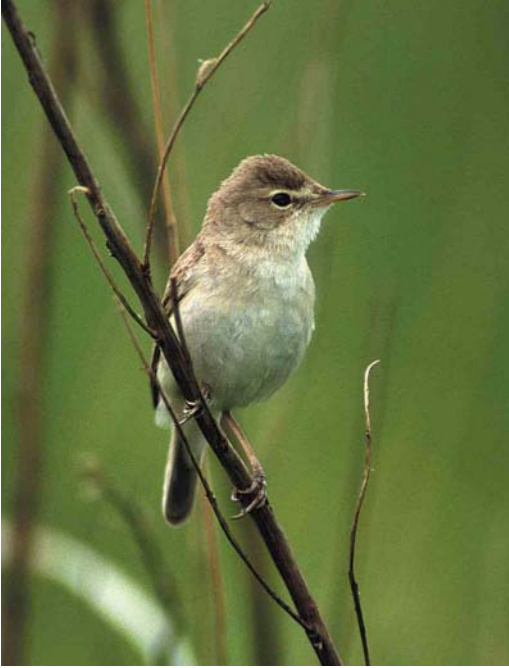
134 Booted Warbler / Kleine Spotvogel Acrocephalus caligatus , Värtsilä, Finland, June 2000 (Pekka Komi)