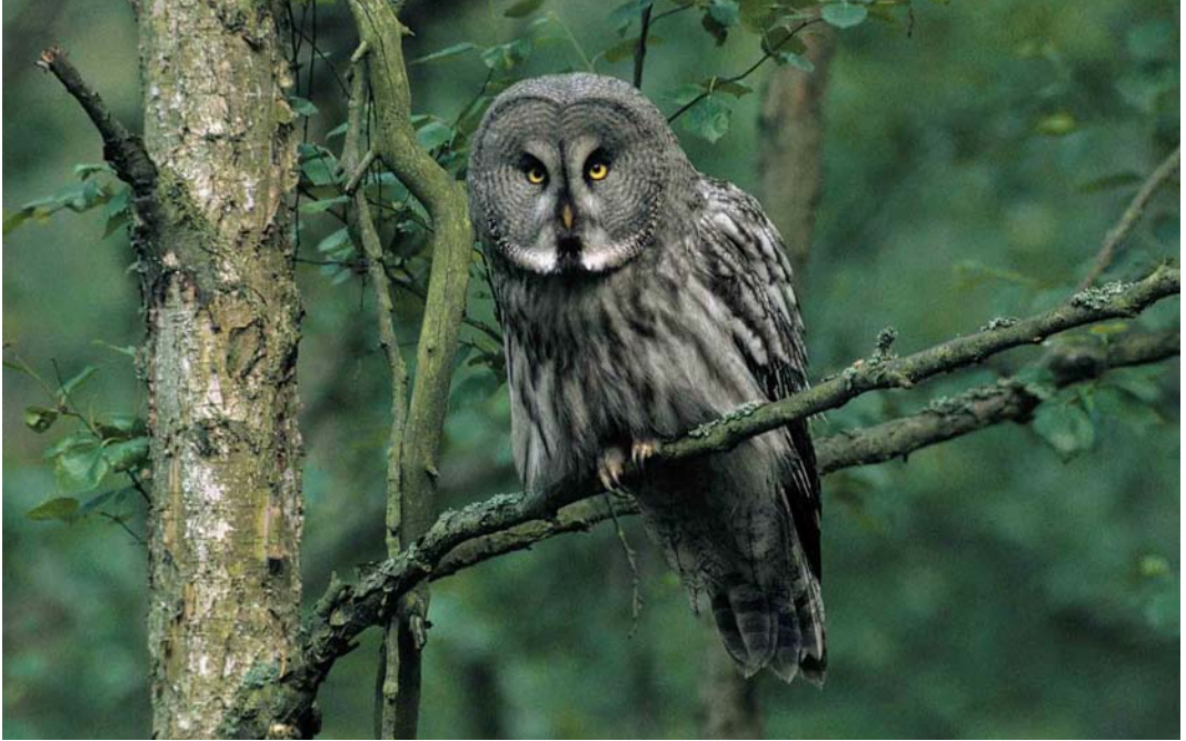
133 Great Grey Owl / Laplanduul Strix nebulosa , Skummeslövstrand, Halland, Sweden, June 2000 (Felix Heintzenberg)

seen on 4 June. If accepted, a Little Swift A. affinis in Gironde on 3 May will be the first for France. The second White-throated Kingfisher Halcyon smyrnensis for Azraq, Jordan, was seen on 26 April (the first was in 1922). In Vestjylland, Denmark, a flock of 12 European Bee-eaters Merops apiaster migrated north past Blåvands Huk on 5 June and past Vesterlund Kro on 6 June. Possibly, this was the same flock (originally 13, one being killed by a car) seen from 31 May to 3 June at Oudeschip and Nooitgedacht, Groningen, the Netherlands. The fourth Grey-headed Woodpecker Picus canus for the Netherlands was an adult male drumming and calling from at least 8 May to 11 June at Oosterbeek, Renkum, Gelderland.