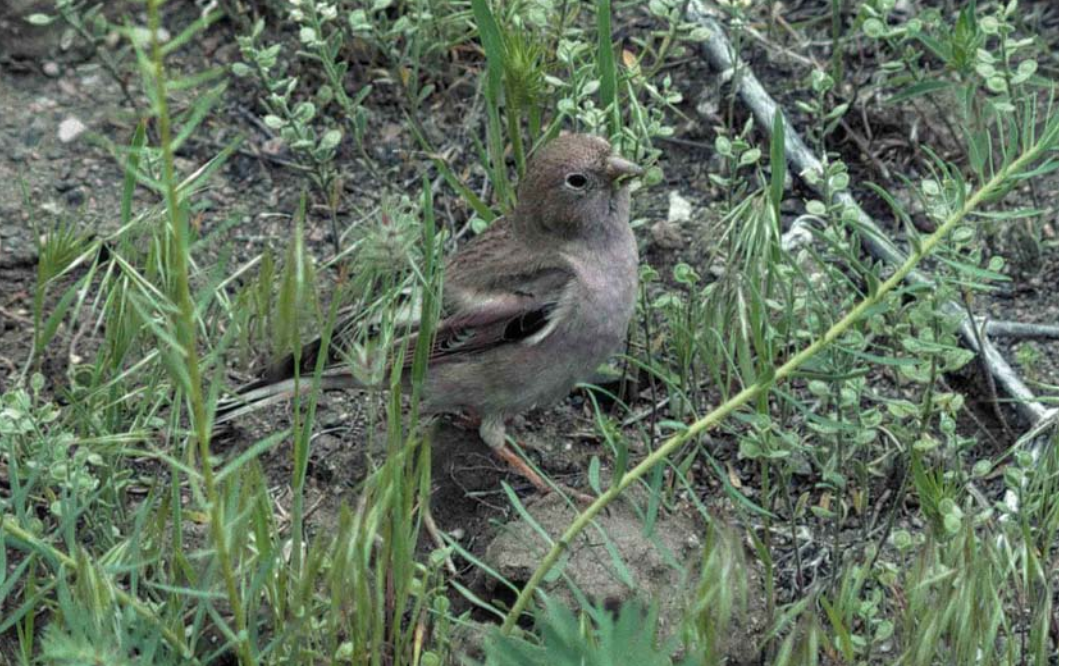
116 Mongolian Finch / Mongoolse Woestijnvink Bucanetes mongolicus , male, Ishak Pasa Sarayi, Turkey, 29 May 1994

mid-May, and Snow & Perrins (1998) report eggs in the second half of April and fledged young in mid-May in Azerbaijan. These latter data accord more strongly with Turkish observations although, given the occurrence of dependent young until mid-July and, based on MB's observation above, even late August, it is possible that the species has a remarkably protracted breeding season, or that more than one clutch is attempted. Climatic factors may plausibly influence the timing of breeding.