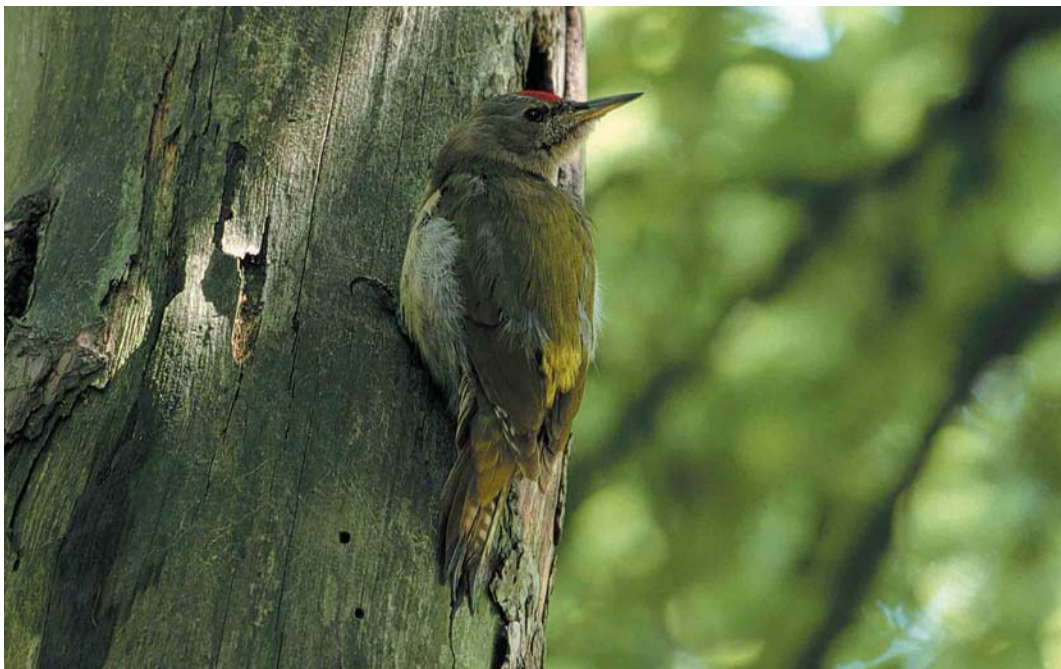
144 Grijskopspecht / Grey-headed Woodpecker Picus canus , mannetje, Oosterbeek, Gelderland, 31 mei 2000