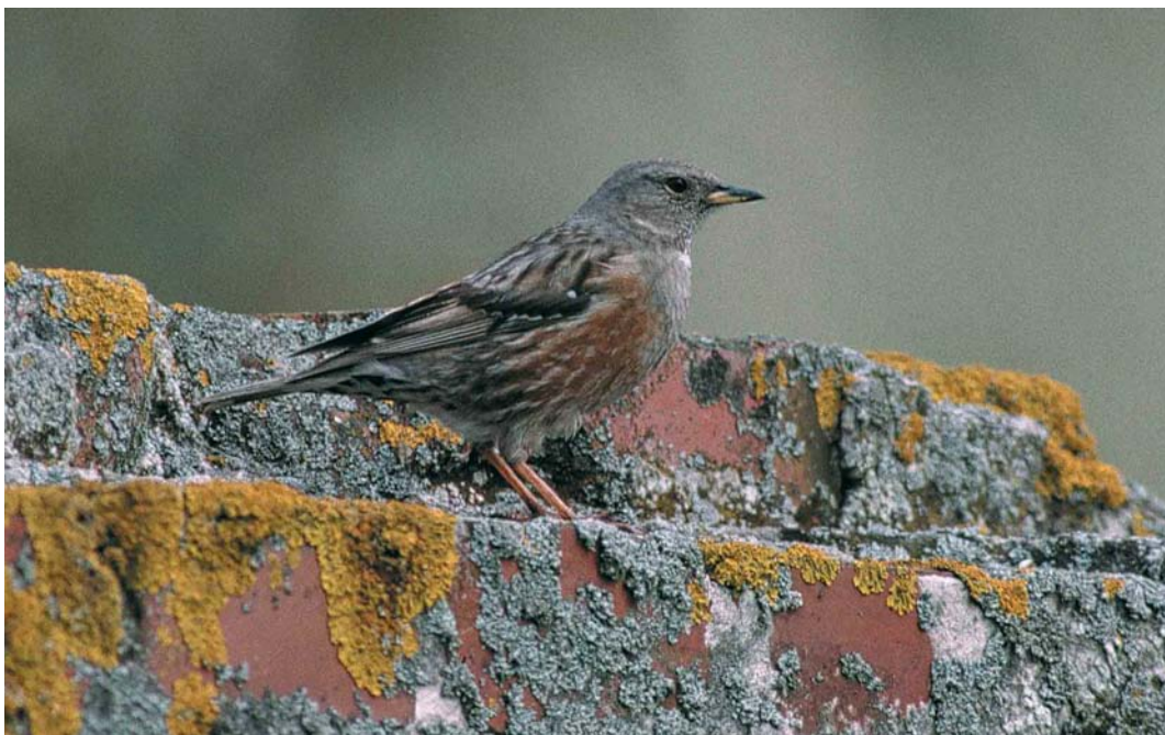
145 Alpenheggenmus / Alpine Accentor Prunella collaris , Formerum aan Zee, Terschelling, Friesland, 4 mei 2000 (Arie Ouwerkerk)