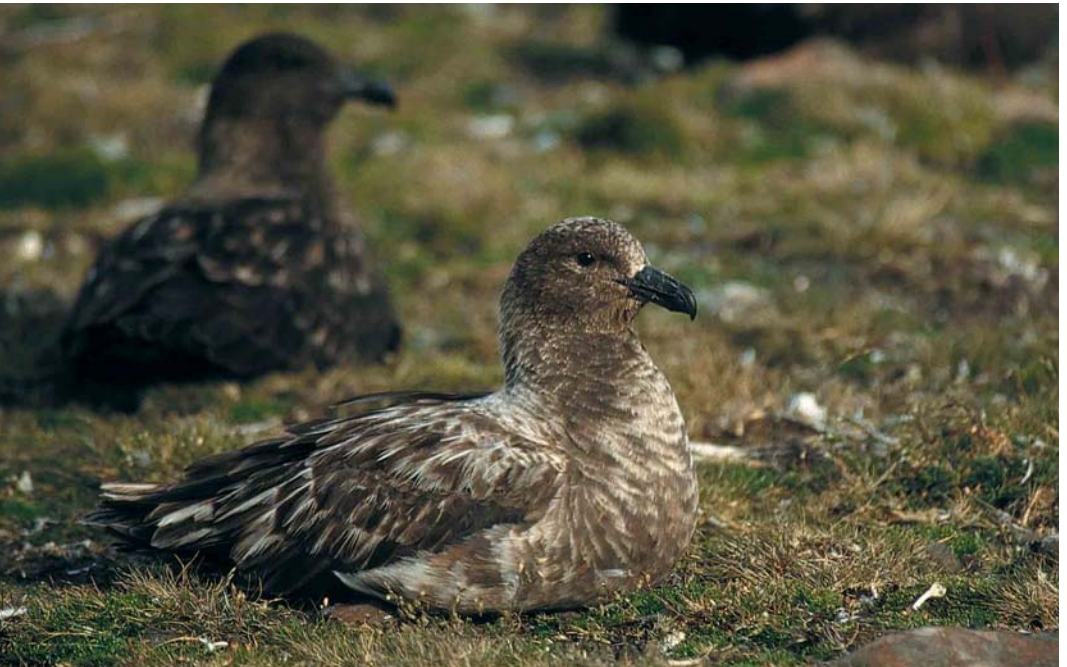
123 Subantarctic Skua / Lönnerberg's Grote Jager Stercorarius antarcticus lonnbergi , Kerguelen Archipelago, January 1997. Bird with very worn and abraded plumage, showing obvious pale blaze at base of bill