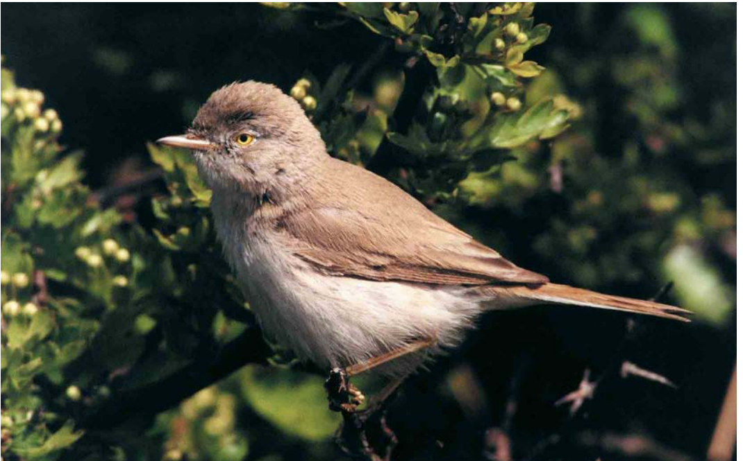
138 Asian Desert Warbler / Aziatische Woestijngrasmus Sylvia nana nana , Spurn, East Yorkshire, England, May 2000 (Iain H Leach)