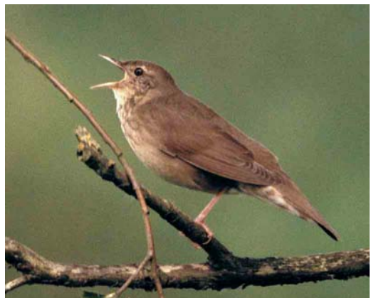
149 Dwergarend / Booted Eagle Hieraaetus pennatus , adult, donkere vorm, Rhenen, Gelderland, 24 juni 2000 (Jan Wierda) 150 Grijszwart / Black-winged Kite Elanus caeruleus , Meerstalblok, Drenthe, 12 juni 2000 (Dirk Moerbeek) 151 Amerikaanse Wintertaling / Green-winged Teal Anas carolinensis , mannetje, Spaarndam, Noord-Holland, 5 mei 2000 (Arnoud B van den Berg) 152 Griel / Stone-curlew Burhinus oedicnemus , Maasvlakte, Zuid-Holland, 13 mei 2000 (Marten van Dijl) 153 Baltische Mantelmeeuw / Baltic Gull Larus fuscus , subadult, Steenwaard, Houten, Utrecht, 30 april 2000 (Marc Plomp) 154 Krezelzanger / River Warbler Locustella fluviatilis , Australiëhaven, Amsterdam, Noord-Holland, juni 2000 (Jan den Hertog)