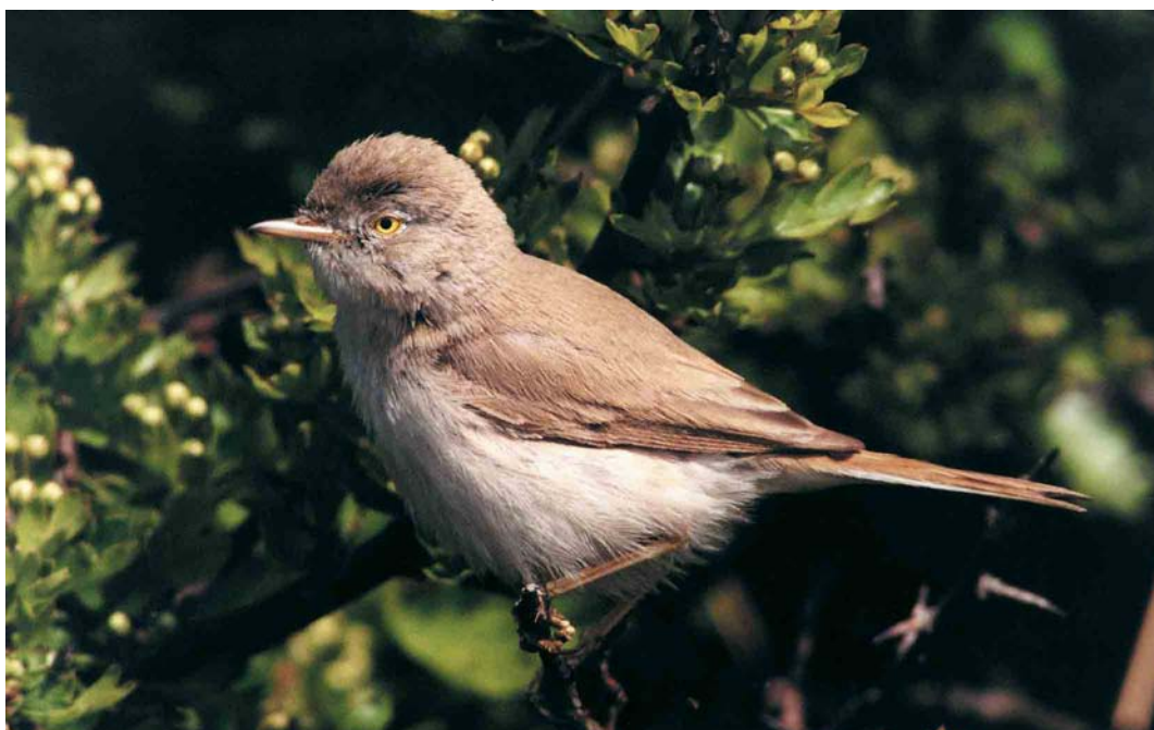
138 Asian Desert Warbler / Aziatische Woestijngrasmus Sylvia nana nana , Spurn, East Yorkshire, England, May 2000