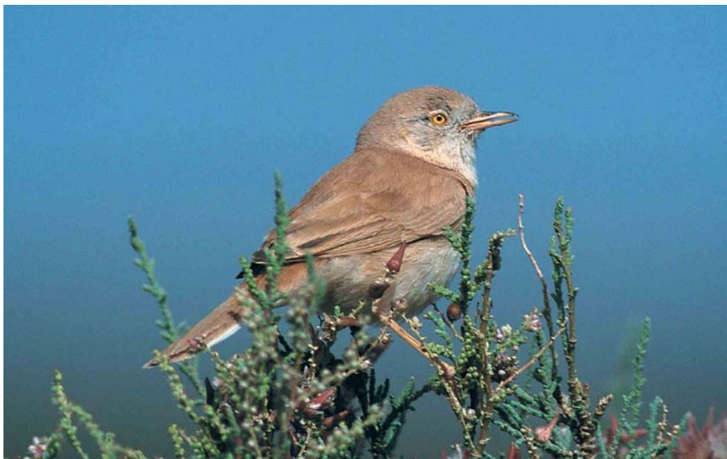
137 African Desert Warbler / Afrikaanse Woestijngrasmus Sylvia nana deserti , Merzouga, Morocco, 20 April 2000 (Markus Roemhild)