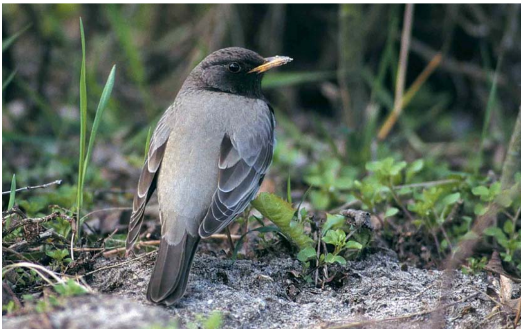
112 Zwartkeellijster / Black-throated Thrush Turdus ruficollis atrogularis , adult mannetje, West-Terschelling, Terschelling, Friesland, 12 april 1998