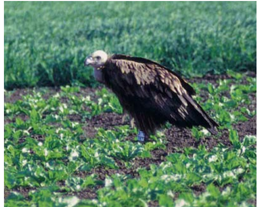
110 Vale Gier / Eurasian Griffon Vulture Gyps fulvus , tweedejaars, Wissenkerke, Zeeland, 3 juni 1999

GROOTTE & BOUW Zeer grote roofvogel, spanwijdte c 2.50 m; spanwijdte onder meer geschat door directe vergelijking met attaquerende Kokmeeuwen en Kleine Mantelmeeuwen L. graellsii . In vlucht lange, zeer brede en sterke gevingerde vleugels, weinig uitstekende kop en korte afgeronde staart. Achterrand van armvleugel gebogen. In cirkelvlucht vleugels in ondiepe V, met hand iets naar voren gehouden.