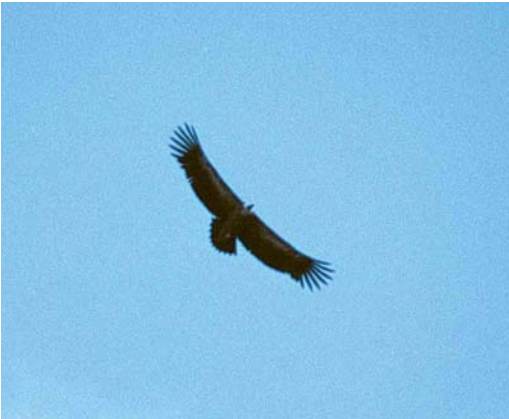
109 Vale Gier / Eurasian Griffon Vulture Gyps fulvus , tweedejaars, Goes, Zeeland, 1 juni 1999