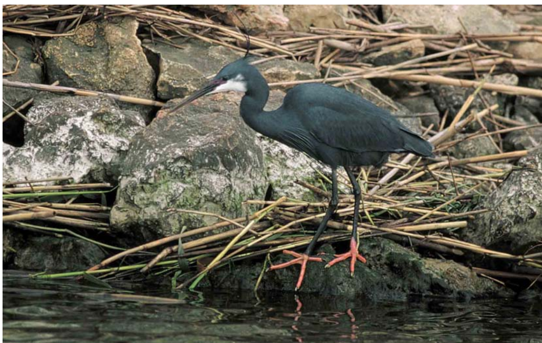
128 Western Reef Egret / Westelijke Rifeiger Egretta gularis , Ebro delta, Spain, 19 May 2000 (Mariano Cebolla Borrell)