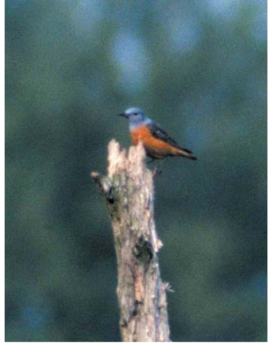
157 Roodsterblauwborst / Red-spotted Bluethroat Luscinia svecica svecica , mannetje, Vlieland, Friesland, 5 mei 2000 158 Rode Rotslijster / Rufous-tailed Rock Thrush Monticola saxatilis , mannetje, Blaricum, Noord-Holland, 4 mei 2000 159 Bijeneters / European Bee-eaters Merops apiaster , Oudeschip, Groningen, 2 juni 2000 160 Zwartkoppors / Black-headed Bunting Emberiza melanocephala , mannetje, Midsland, Terschelling, Friesland, 30 juni 2000