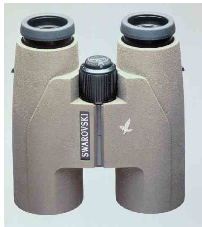
Swarovski SLC 10x42 WB binoculars

Only subscribers to Dutch Birding are eligible to enter. Excluded from entry are the editors and members of the editorial board of Dutch Birding and the members of the board of the Dutch Birding Association. Photographers whose work is used in the competition (both as mystery birds or as photographs accompanying the solutions)