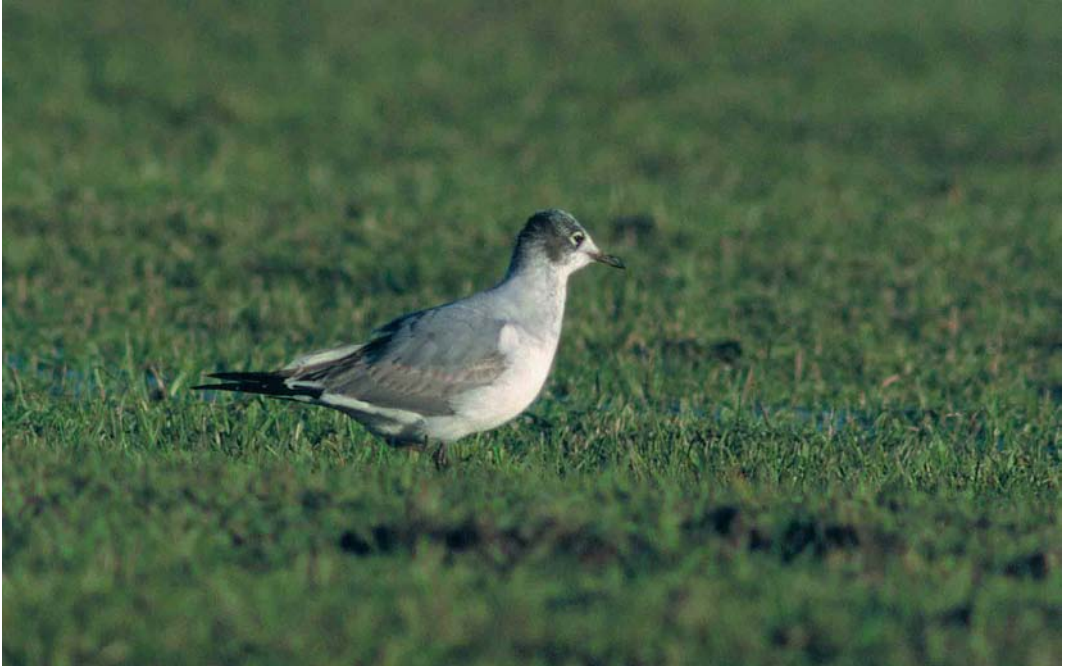
54 Franklins Meeuw / Franklin's Gull Larus pipixcan , eerste-winter, Kampen, Overijssel, 20 februari 2000 (Arnoud B van den Berg)