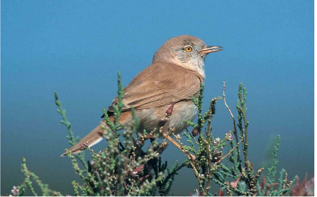
137 African Desert Warbler / Afrikaanse Woestijngrasmus Sylvia nana deserti , Merzouga, Morocco, 20 April 2000 (Markus Roemhild)