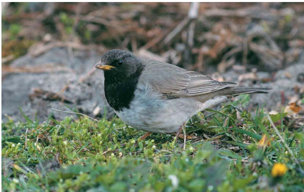
111 Zwartkeellijster / Black-throated Thrush Turdus ruficollis atrogularis , adult mannetje, West-Terschelling, Terschelling, Friesland, 13 april 1998 (Ruud E Brouwer)