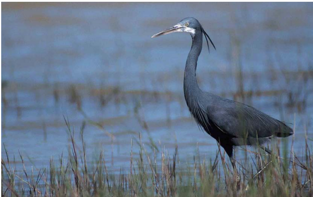
127 Western Reef Egret / Westelijke Rifeiger Egretta gularis , Carrapateira, Cabo de São Vicente, Algarve, Portugal, May 2000