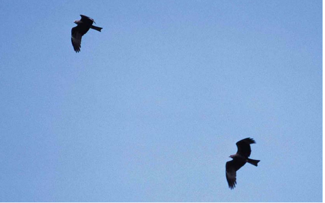
146 Zwarte Wouwen / Black Kites Milvus migrans , Breskens, Zeeland, 16 mei 2000 147 Morinelplevier / Eurasian Dotterel Charadrius morinellus , Hargen, Noord-Holland, 7 mei 2000 148 Grijskopspecht / Grey-headed Woodpecker Picus canus , mannetje, Oosterbeek, Gelderland, 15 mei 2000