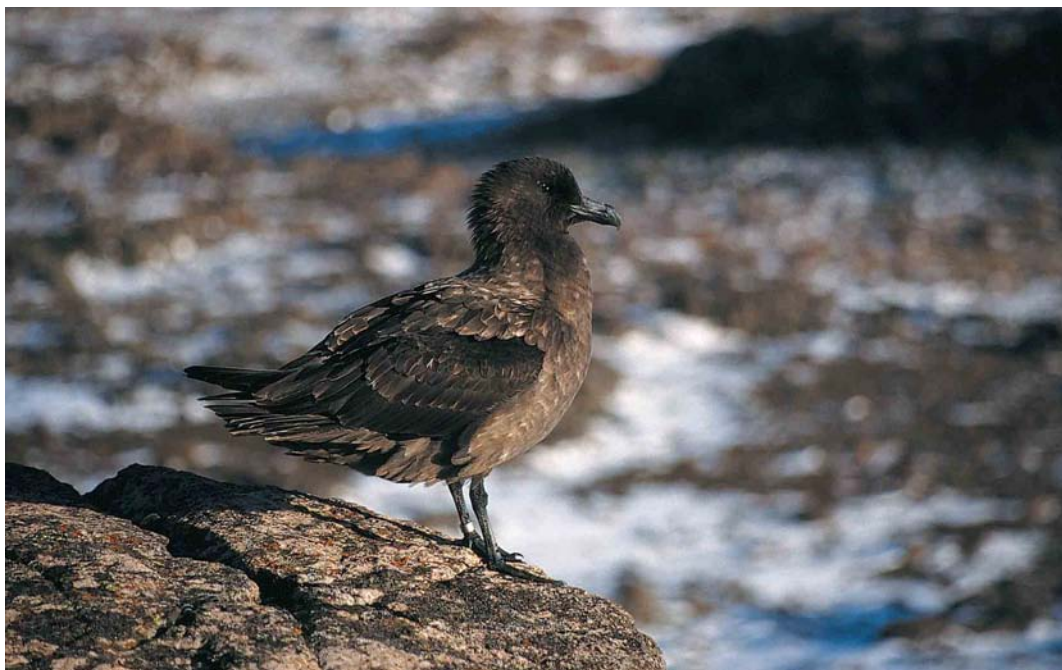
120 Subantarctic Skua / Lönnsberg's Grote Jager Stercorarius antarcticus lonnbergi , male, Kerguelen Archipelago, September 1996. Compare bill of this male with that of female in plate 119