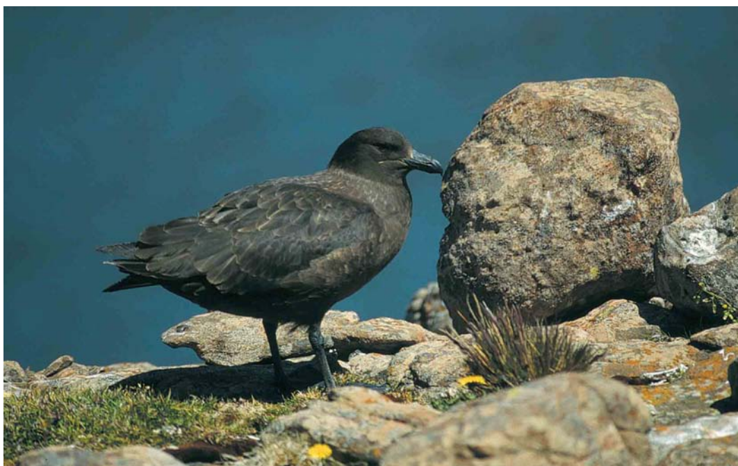
121 Subantarctic Skua / Lönnsberg's Grote Jager Stercorarius antarcticus lonnbergi , immature female, Kerguelen Archipelago, January 1997 (Frédéric Jiguet). Pale nose-band is visible on this bird