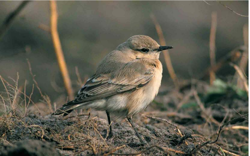
307 Izabeltapuit / Isabelline Wheater Oenanthe isabellina , eerstejaars, Schiermonnikoog, Friesland, 16 oktober 2000 (Eric Koops)