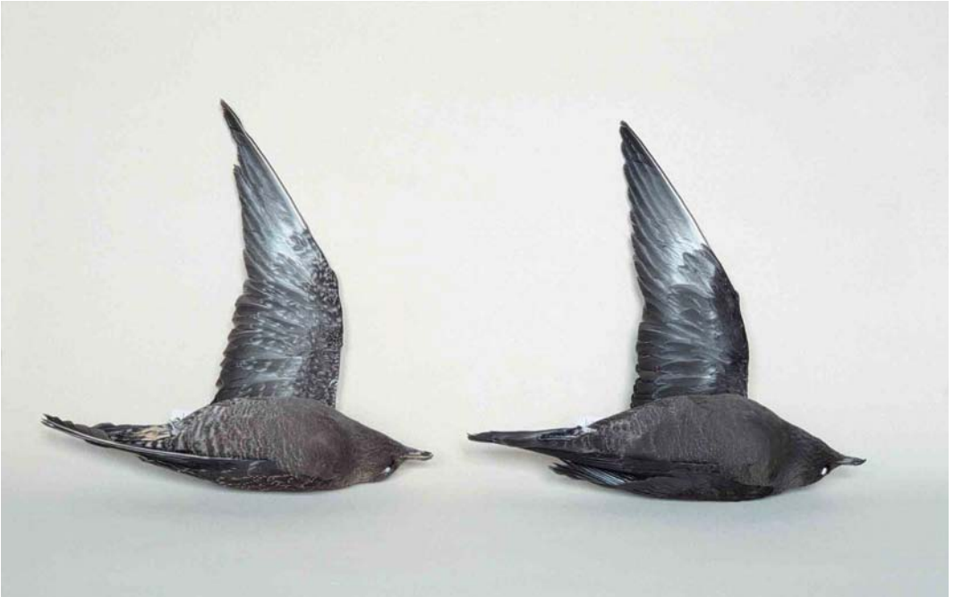
273 Long-tailed Jaegers / Kleinste Jagers Stercorarius longicaudus , darker variants of juvenile barred and juvenile dark morphs: barred morph (left), ZMA 37359, female, Zundert, Noord-Brabant, Netherlands, 15 August 1987; dark morph (right), ZMA 54027, female, Vlieland, Friesland, Netherlands, 13 September 1991

301 mm (wing), 45.4 mm (tarsus) and 27.2 mm (bill), apparently due to desiccation; the central rectrices then measured 141 mm (to the point of insertion in the skin) and the nail of the bill 15.1 mm. It is preserved as study skin with spread wing detached as ZMA 54027.