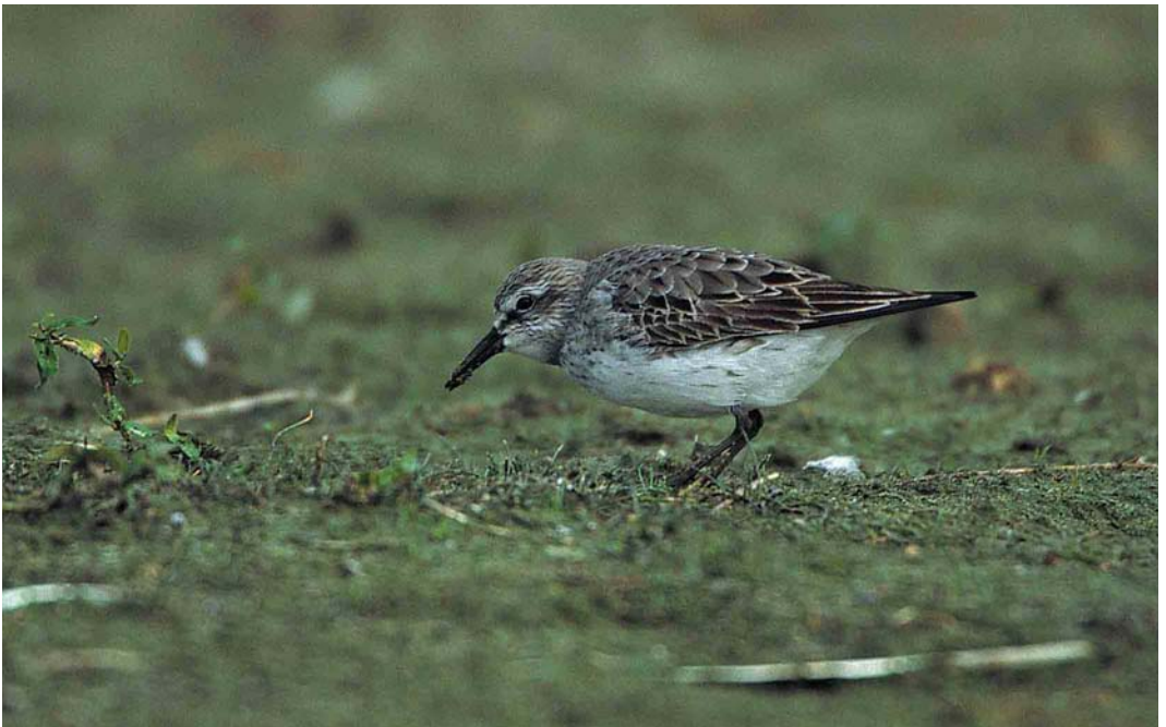
298 Bonapartes Strandloper / White-rumped Sandpiper Calidris fuscicollis , De Geul, Texel, Noord-Holland, 3 september 2000 (Jan van Holten)