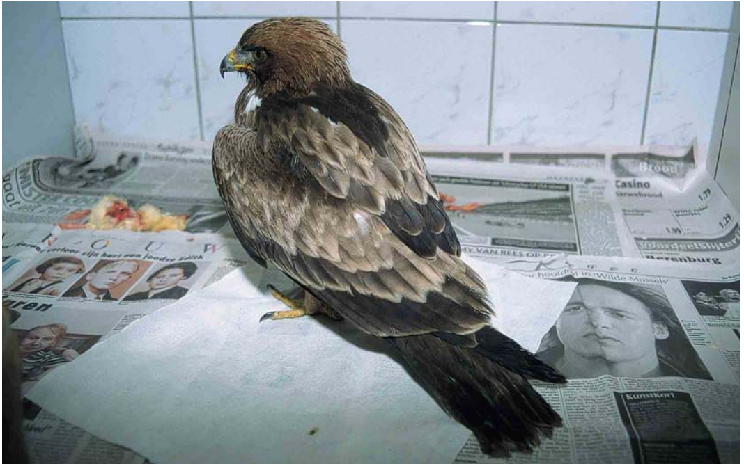
299 Dwergarend / Booted Eagle Hieraetus pennatus , juveniel, donkere vorm (verzwakte vogel gevangen op Vlieland, Friesland, op 14 oktober 2000), in vogelasiel te Ureterp, Friesland, 14 oktober 2000 (Roef Mulder)

over Westenschouwen, Zeeland, en waarschijnlijk dezelfde over de Oosterscheldekering, vanaf 22 september tot ver in oktober in de kop van Noord-Holland, op 22 en 23 september in de Engbertsdijkvenen, Overijssel, en op 23 september langs Spijk, Gelderland. Op 12 september werd een juveniele Steppiekiekendief Circus macrourus gemeld van de Maasvlakte, Zuid-Holland. Slechts één Grauwe Kiekendief C. pygargus werd doorgegeven, en wel op 24 september uit de HW-duinen, Zuid-Holland. De tweede Arendbuizerd Buteo rufinus voor Nederland werd op 5 september ontdekt langs de Praamweg, Flevoland, en op 9 en 10 september door vele waarnemers gezien. In deze omgeving werd op 7 oktober wéér een Arendbuizerd gemeld, die daar ook op 29 september gezien zou zijn. Zoekacties leverden helaas niets op. Na de melding van een 'kleinere arend' Aquila op 18 oktober ten zuiden van Maastricht, Limburg, vloog op 20 oktober een Schreeuwarend A. pomarina over bij Spijk. Een waarschijnlijke Bastaardarend A. clanga werd op 30 september gezien in de Lauwersmeer, Groningen. Een Dwergarend Hieraetus pennatus kwam op 13 oktober uit zee vliegen en landde op Vlieland. De dag erna werd de vogel in verzwakte toestand gevangen en naar een vogelasiel gebracht. Op 24 oktober werd hij in goede conditie losgelaten op de Hoge Veluwe, Gelderland, alwaar hij ook de volgende dag nog werd gezien. Op 31 oktober werd een