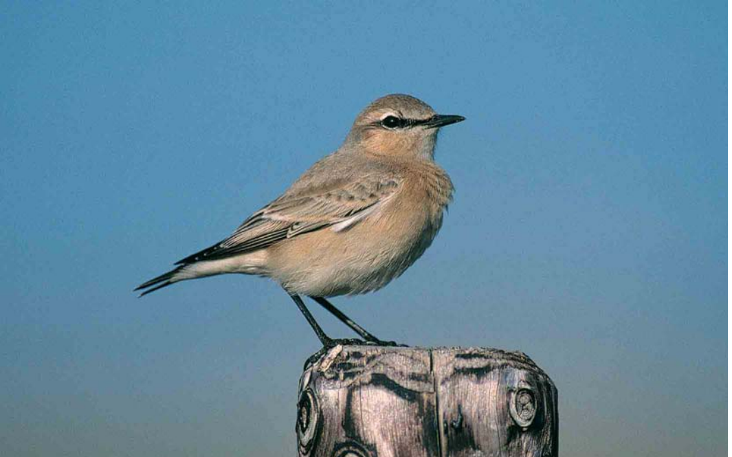
306 Izabeltapuit / Isabelline Wheater Oenanthe isabellina , eerstejaars, IJmuiden, Noord-Holland, 23 september 2000 (Marten van Dijl)