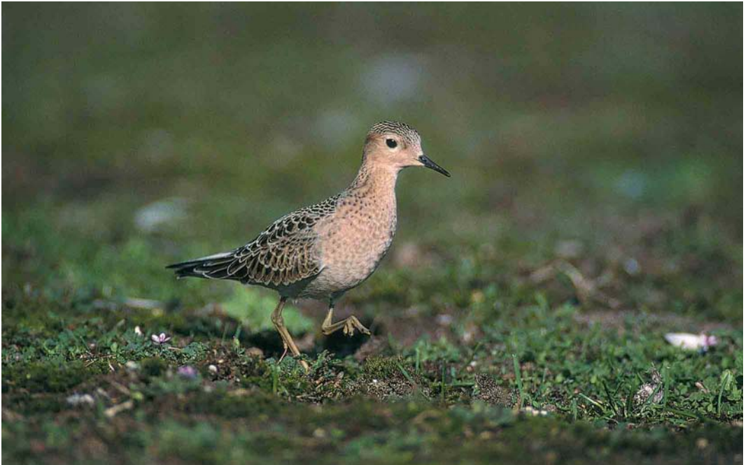
297 Blonde Ruiters / Buff-breasted Sandpiper Tryngites subruficollis , juveniel, Dintelhaven, Zuid-Holland, 25 september 2000