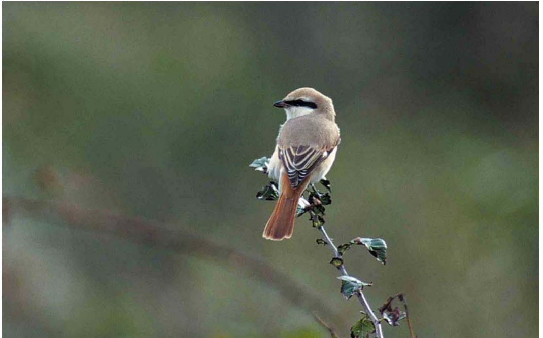
308 Vermoedelijke Turkestaanse Klauwier / presumed Turkestan Shrike Lanius phoenicuroides , adult mannetje, Eierlandse Duinen, Texel, Noord-Holland, 2 oktober 2000