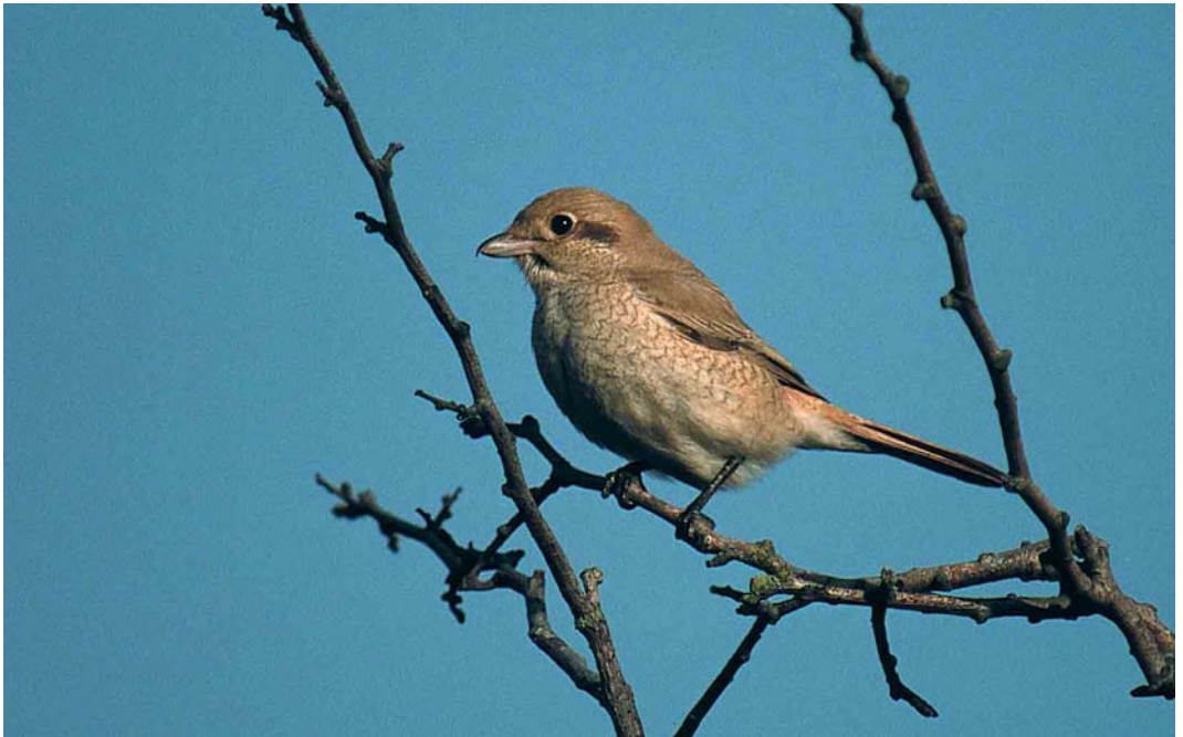
309 Izabelklauwier / isabelline shrike Lanius speculigerus/phoenicuroides , eestejaars, Castricum, Noord-Holland 2 oktober 2000