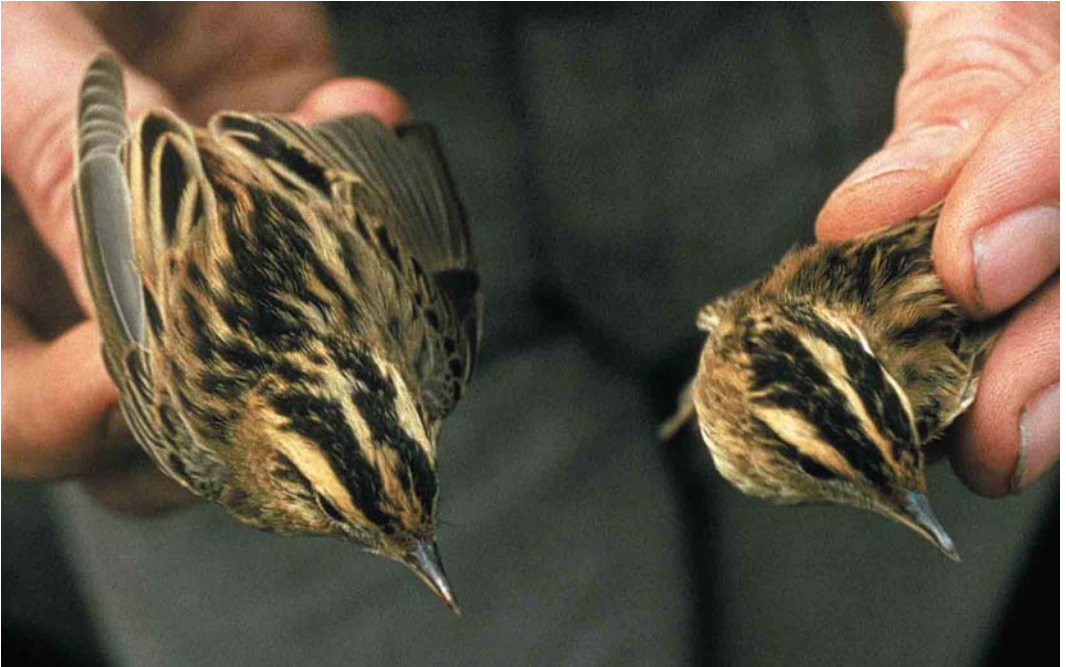
270 Aquatic Warblers / Waterrietzangers Acrocephalus paludicola , first-winter, Verdrongen Land van Saeftinge, Zeeland, 24 August 1977 (G J Slob)