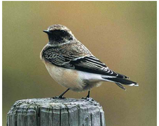
264 Radde's Warbler / Raddes Boszanger Phylloscopus schwarzi , Korverskooi, Texel, Noord-Holland, 8 October 1999 265 Western Bonelli's Warbler / Bergfluits Phylloscopus bonelli , Snoekebos, Kennemerduinen, Noord-Holland, 2 May 1999 266 Citrine Wagtail / Citroenkwikstaart Motacilla citreola , female, Katwijk aan Zee, Zuid-Holland, 7 May 1999 267 Greater Short-toed Lark / Kortteenleeuwerik Calandrella brachydactyla , Uitdam, Waterland, Noord-Holland, 12 September 1999 268 Pied Wheatear / Bonte Tapuit Oenanthe pleschanka , first-winter female, Nederweert, Limburg, 10 November 1999 269 Pied Wheatear / Bonte Tapuit Oenanthe pleschanka , first-winter male, De Slufter, Texel, Noord-Holland, October 1999