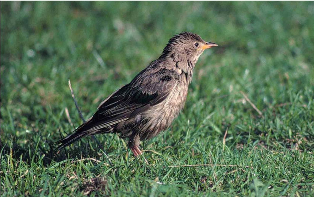
271 Rose-coloured Starling / Roze Spreeuw Sturnus roseus , juvenile moulting to first-winter, Camperduin, Noord-Holland, 12 November 1999