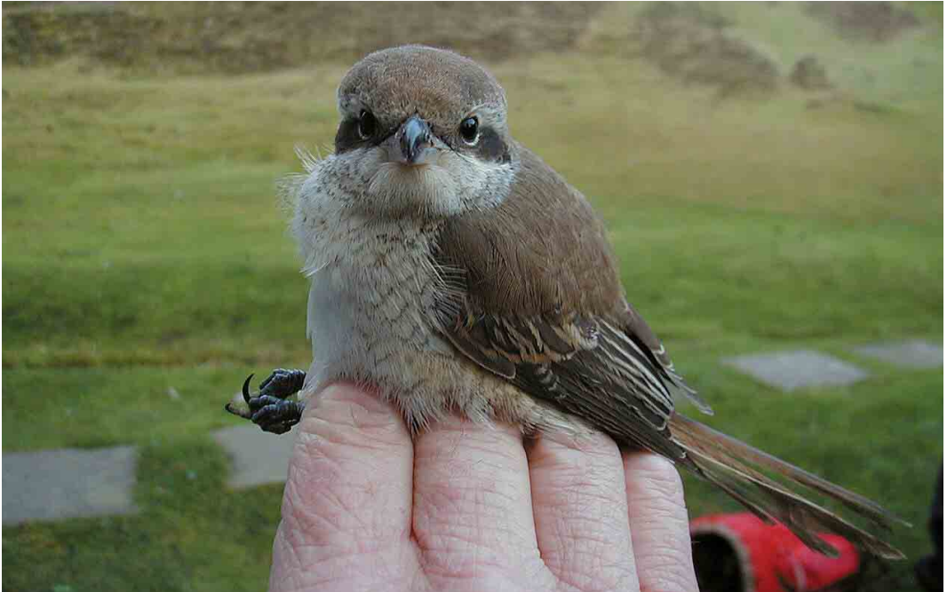
296 Brown Shrike / Bruine Klauwier Lanius cristatus , first-winter, Fair Isle, Shetland, Scotland, 21 October 2000 (Deryk Shaw)

Skerries, Scotland, on 15-21 September. In Belgium, a female was trapped at Oud-Turnhout, Antwerpen, on 24 September. Also on Out Skerries, a Bobolink Dolichonyx oryzivorus was present on 21-22 September.