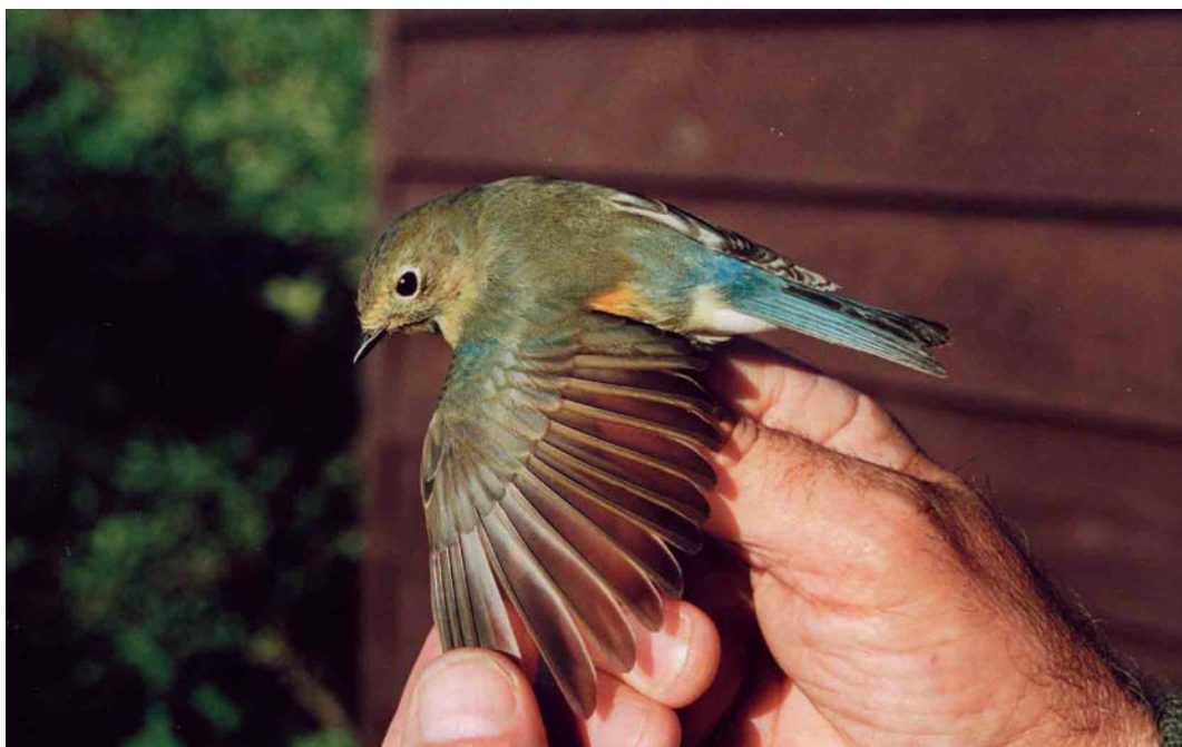
261 Red-flanked Bluetail / Blauwstaart Tarsiger cyanurus , first-winter male, Kroonspolders, Vlieland, Friesland, 11 October 1999 262 Red-spotted Bluethroat / Roodsterblauwborst Luscinia svecica svecica , Veendam, Groningen, 27 June 1999 263 Pine Bunting / Witkopgors Emberiza leucocephalos , first-winter female, Castricum, Noord-Holland, 8 November 1999