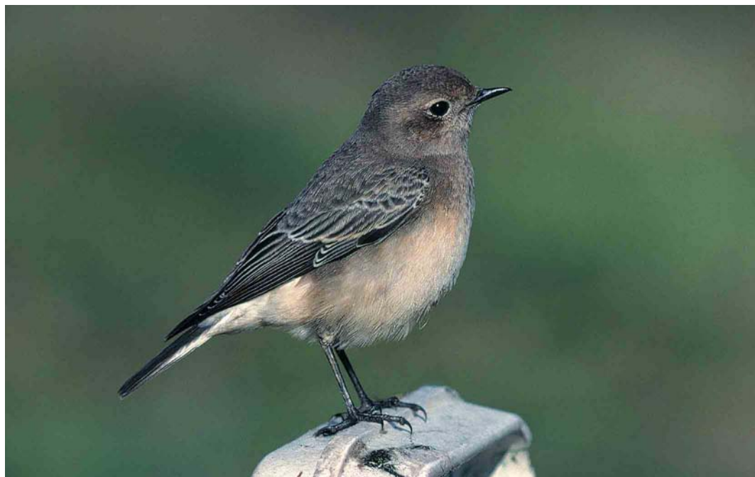
280 Bonte Tapuit / Pied Wheatear Oenanthe pleschanka , eerste-winter vrouwtje, Nederweert, Limburg, 10 november 1999

KOP Overwegend bruingrijs, zonder 'warme' roodbruine kleur. Wenkbrauwstreep onduidelijk en vaag, voornamelijk achter het oog zichtbaar. Oorstreek donkerder, contrasterend met iets lichtere wenkbrauwstreep, achter- en zijhals. Smalle oogring, vooral duidelijk aan