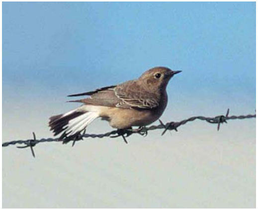
281-282 Bonte Tapuit / Pied Wheatear Oenanthe pleschanka , eerste-winter vrouwtje, Nederweert, Limburg, 10 november 1999

bovenzijde van oog. Kin en keel licht, lichtgrijs tot vuilwit.