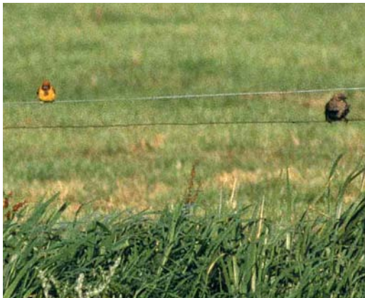
272 Red-headed Bunting / Bruinkopgors Emberiza bruniceps , male, Haersterbroek, Zwolle, Overijssel, August 1981 (Nanne Nauta)

Branta hutchinsii hutchinsii 2 January, Strijen , Zuid-Holland, photographed ( B h minima not excluded); 30 January, Anjumerkolken, Dongeradeel , Friesland, adult,