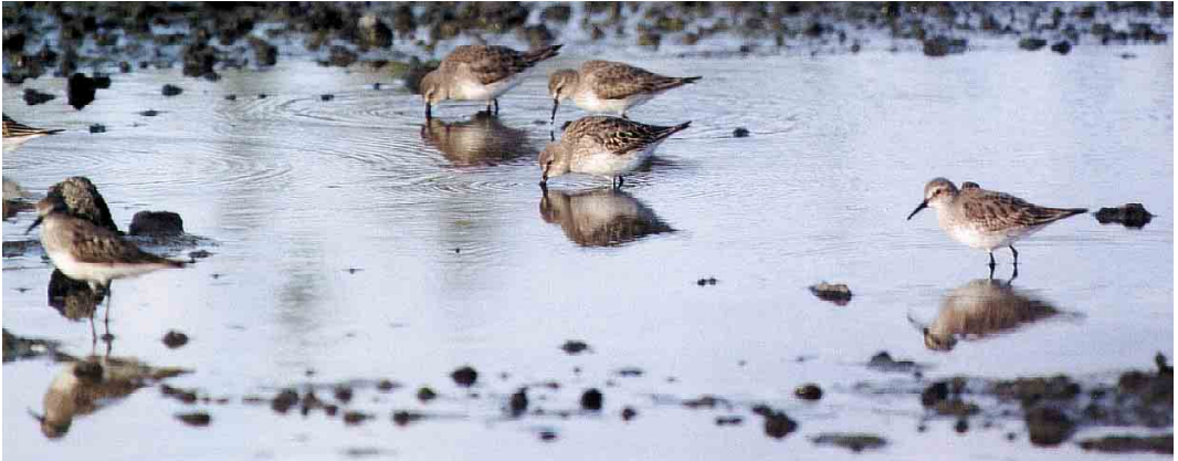
287 African Spoonbill / Afrikaanse Lepelaar Platalea alba , Azud de Riobobos, Salamanca, Spain, 27 September 2000 288 African Long-legged Buzzard / Afrikaanse Arendbuiserz Buteo rufinus circensis , Tarifa, Cadíz, Spain, September 2000 289 White-rumped Sandpipers / Bonapartes Strandlopers Calidris fuscicollis , Cabo da Praia quarry, Terceira, Azores, 22 September 2000

15: 85, 1993, Sandgrouse 22: 67-68, 2000). In the Azores, between 16 and 23 September, two juvenile Semipalmated Sandpipers C pusilla , 11 adult White-rumped Sandpipers C fuscicollis (including 10 at Cabo da Praia quarry, Terceira, on 21-22 September), one juvenile Pectoral Sandpiper C melanotos , four juvenile Lesser Yellowlegs T flavipes and two juvenile Spotted Sandpipers Actitis macularia were seen. On 23 August, an adult Sharp-tailed Sandpiper C acuminata was found at the Cabo da Praia quarry. In Norway, one was seen at Revtangen, Rogaland, on 26 September. During September, four juvenile Semipalmated Sandpipers were found in Britain and one in Ireland. At Les Attaques, Pas-de-Calais, France, one was reported from 20 October. In England and Scotland, seven White-rumped Sandpipers were seen during September. In Ireland, two adults were seen in late September and an amazing influx occurred on 8 October when at least