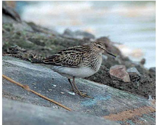
255 Golden Eagle / Steenarend Aquila chrysaetos , first-winter, Terschelling, Friesland, 19 October 1999 ( Arie Ouwerkerk ) 256 Forster's Tern / Forsters Stern Sterna forsteri , adult winter, De Boschplaat, Terschelling, Friesland, 14 November 1999 ( Arie Ouwerkerk ) 257 Lesser Yellowlegs / Kleine Geelpootruiter Tringa flavipes , adult, Jaap Deensgat, Lauwersmeer, Groningen, August 1999 ( Eric Koops ) 258 Pectoral Sandpiper / Gestreepte Strandloper Calidris melanotos , juvenile, Hoogkerk, Groningen, 18 September 1999 ( Lucien Davids )