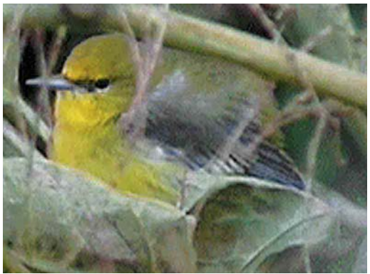
290 Eastern Common Redstart Phoenicurus phoenicurus samamisticus , male, Helgoland, Schleswig-Holstein, Germany, 4 September 2000 291 American Cliff Swallow / Amerikaanse Klifzwaluw Hirundo pyrrhonota , juvenile, Hugh, St Mary's, Scilly, England, 28 September 2000 292 Red-eyed Vireo / Roodoogvireo Vireo olivaceus , St Mary's, Scilly, England, October 2000 293 Blue-winged Warbler / Blauwleugelzanger Vermivora pinus , Cape Clear Island, Ireland, October 2000

during September and, on 11-30 September, at least 19 were in France. In June-August, during a survey in coastal southern Chukotka, north-eastern Siberia, it was found that Spoon-billed Sandpipers Eurynorhynchus pygmeus were almost totally absent in four locations formerly known as breeding sites. The species is known to be site-faithful and, therefore, it is now feared that it is rapidly heading for extinction. In the 1970s, the population was estimated at c 2000 pairs and the largest-ever flock was 257 in Bangladesh in January 1989 (cf Dutch Birding 14: 37-41, 1992). In Turkey, 16 Broad-billed Sandpipers Limicola falcinellus were found at Erçek Gölü on 14 September. During September, 25 Buff-breasted Sandpipers Tryngites subruficollis (all juveniles) were seen in Britain and 12 in Ireland (including up to seven in a day at Tacumshin, Wexford). In France, there was a total of 10 for September and at least two more in October. A Long-billed Dowitcher Limnodromus scolopaceus was observed at Belfast Harbour, Down, Northern Ireland, until 24 September, and one occurred at St-Come-du-Mont,