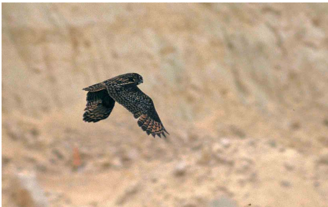
260 Eurasian Eagle Owl / Oehoe Bubo bubo , St Pietersberg, Maastricht, Limburg, 5 June 1999

'intermedius'-type birds is an identification pitfall, and future investigations may well lead to the conclusion that autumn adults can not be safely identified in the field. In that case, all records of adults need to be reviewed.