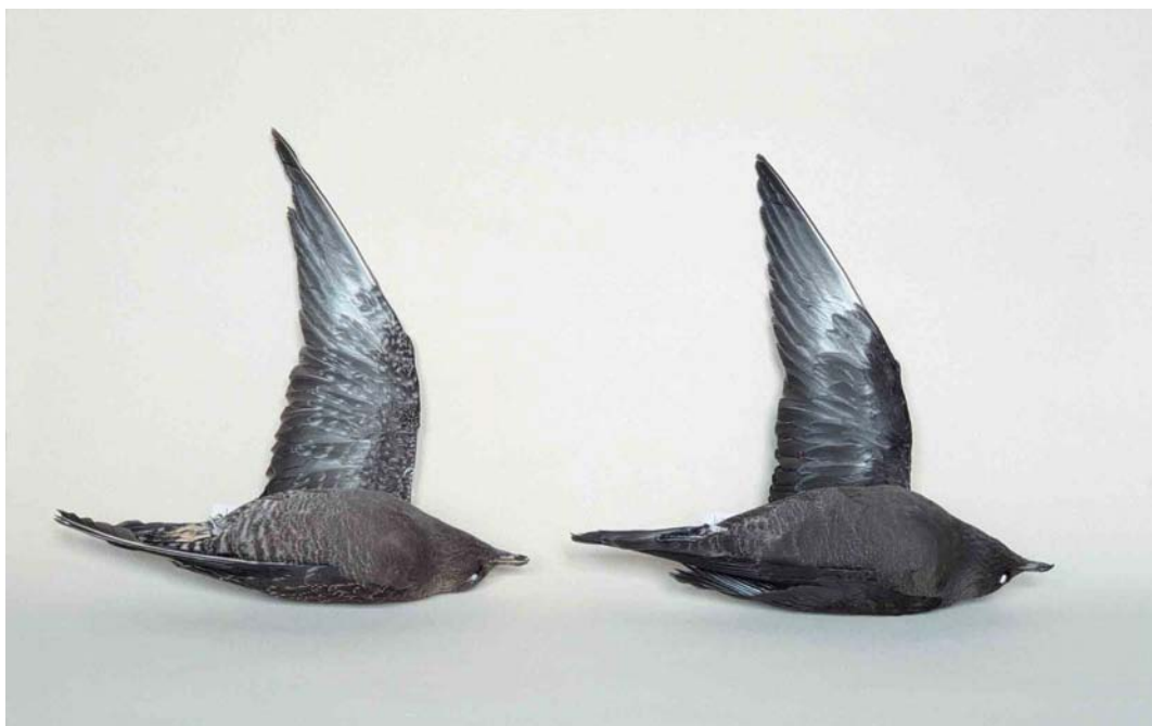
273 Long-tailed Jaegers / Kleinste Jagers Stercorarius longicaudus , darker variants of juvenile barred and juvenile dark morphs: barred morph (left), ZMA 37359, female, Zundert, Noord-Brabant, Netherlands, 15 August 1987; dark morph (right), ZMA 54027, female, Vlieland, Friesland, Netherlands, 13 September 1991

301 mm (wing), 45.4 mm (tarsus) and 27.2 mm (bill), apparently due to desiccation; the central rectrices then measured 141 mm (to the point of insertion in the skin) and the nail of the bill 15.1 mm. It is preserved as study skin with spread wing detached as ZMA 54027.