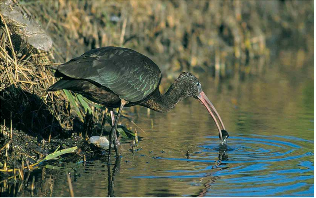
254 Glossy Ibis / Zwarte Ibis Plegadis falcinellus , Burgervlotbrug, Noord-Holland, 12 November 1999