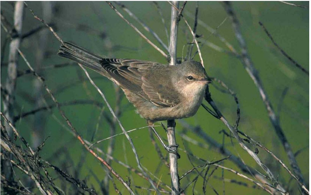
312 Sperwergrasmus / Barred Warbler Sylvia nisoria , eerstejaars, Maasvlakte, Zuid-Holland, 17 september 2000

Meer, Zuid-Holland, werd nog op 18 september daar waargenomen. Op 17 september was er een vangst in de Kennemerduinen, Noord-Holland. Graszangers Cisticola juncidis waren er op 9 september (vangst) bij Budel-Dorplein, Noord-Brabant, op 27 september in het Markiezaat bij Bergen op Zoom, Noord-Brabant, en op 31 oktober nog twee bij de Hellegatsplaten, Zuid-Holland. Waterrietzangers Acrocephalus paludicola werden nog opgemerkt op 10 en 17 september op de Maasvlakte. Een Kleine Spotvogel A caligatus was op 5 september aanwezig bij Oosterend op Terschelling. Sperwergrasmussen Sylvia nisoria pleisterden op 5 en 17 september op de Maasvlakte, op 9 september op Vlieland, op 10 september bij Hoek van Holland, Zuid-Holland, op 12 september op Breezanddijk, Noord-Holland, en op 23 september bij Egmond aan Zee, Noord-Holland, en bij Oostvoorne, Zuid-Holland. Het verhaal van de Grauwe Fitissen Phylloscopus trochiloides staat al in DB Actueel in het vorige nummer vermeld maar voor de volledigheid volgen hier de waarnemingen: van 1 tot 5 september op Terschelling, van 4 tot 11 september op Schiermonnikoog, van 5 tot 10 september maximaal twee en van 23 tot 25 september (nog steeds?) één op de Maasvlakte, van 5 tot 9 september bij IJmuiden en op 9 september op Texel. Er waren vangsten van Noordse Boszangers P borealis op 21 (eerste-winter) én 22 september (adult) op Vlieland. Pallas' Boszangers P proregulus waren aanwezig op 15