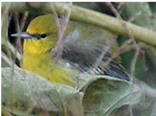
290 Eastern Common Redstart Phoenicurus phoenicurus samamisticus , male, Helgoland, Schleswig-Holstein, Germany, 4 September 2000 291 American Cliff Swallow / Amerikaanse Klifzwaluw Hirundo pyrrhonota , juvenile, Hugh, St Mary's, Scilly, England, 28 September 2000 292 Red-eyed Vireo / Roodoogvireo Vireo olivaceus , St Mary's, Scilly, England, October 2000 293 Blue-winged Warbler / Blauwleugelzanger Vermivora pinus , Cape Clear Island, Ireland, October 2000

during September and, on 11-30 September, at least 19 were in France. In June-August, during a survey in coastal southern Chukotka, north-eastern Siberia, it was found that Spoon-billed Sandpipers Eurynorhynchus pygmeus were almost totally absent in four locations formerly known as breeding sites. The species is known to be site-faithful and, therefore, it is now feared that it is rapidly heading for extinction. In the 1970s, the population was estimated at c 2000 pairs and the largest-ever flock was 257 in Bangladesh in January 1989 (cf Dutch Birding 14: 37-41, 1992). In Turkey, 16 Broad-billed Sandpipers Limicola falcinellus were found at Erçek Gölü on 14 September. During September, 25 Buff-breasted Sandpipers Tryngites subruficollis (all juveniles) were seen in Britain and 12 in Ireland (including up to seven in a day at Tacumshin, Wexford). In France, there was a total of 10 for September and at least two more in October. A Long-billed Dowitcher Limnodromus scolopaceus was observed at Belfast Harbour, Down, Northern Ireland, until 24 September, and one occurred at St-Come-du-Mont,