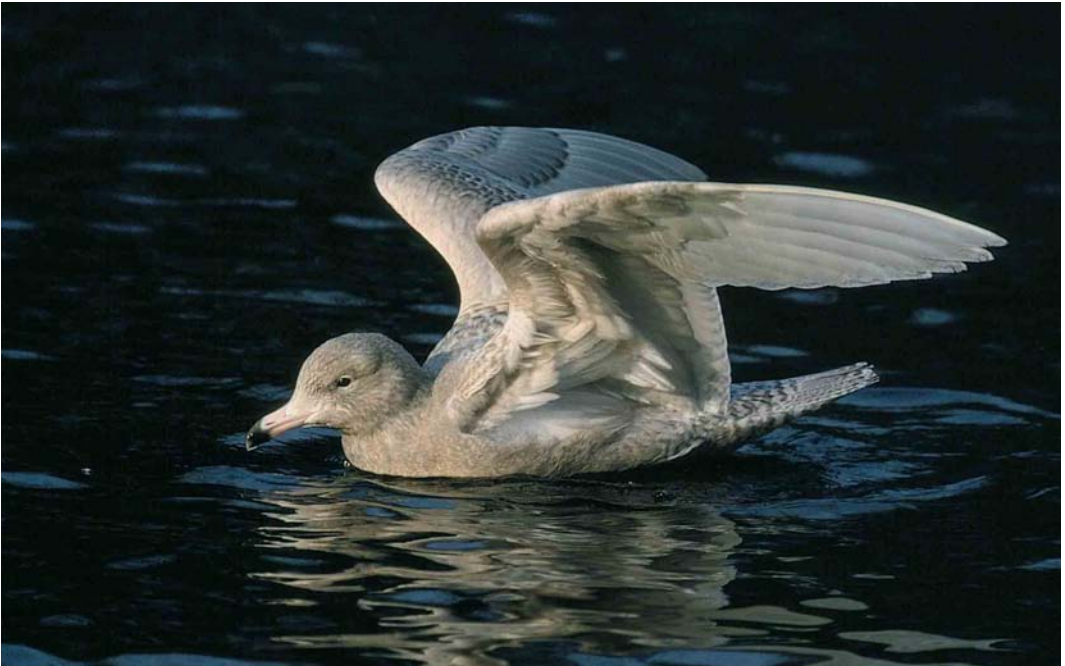
53 Grote Burgemeester / Glaucous Gull Larus hyperboreus , eerste-winter, Rotterdam, Zuid-Holland, 25 januari 2000 (Marten van Dijk)