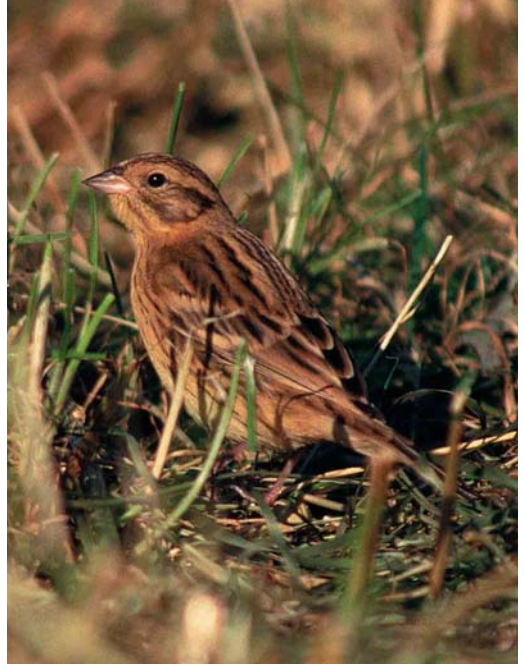
6 Pallas's Grasshopper Warbler / Siberische Sprinkhaanzanger Locustella certhiola , Fair Isle, Shetland, Scotland, September 1997 (Roger Riddington) 7 Yellow-breasted Bunting / Wilgengors Emberiza aureola , Fair Isle, Shetland, Scotland, September 1987 (Tim Loseby) 8 Pechora Pipit / Petsjorapieper Anthus gustavi , Fair Isle, Shetland, Scotland, September 1997 (Tim Loseby)