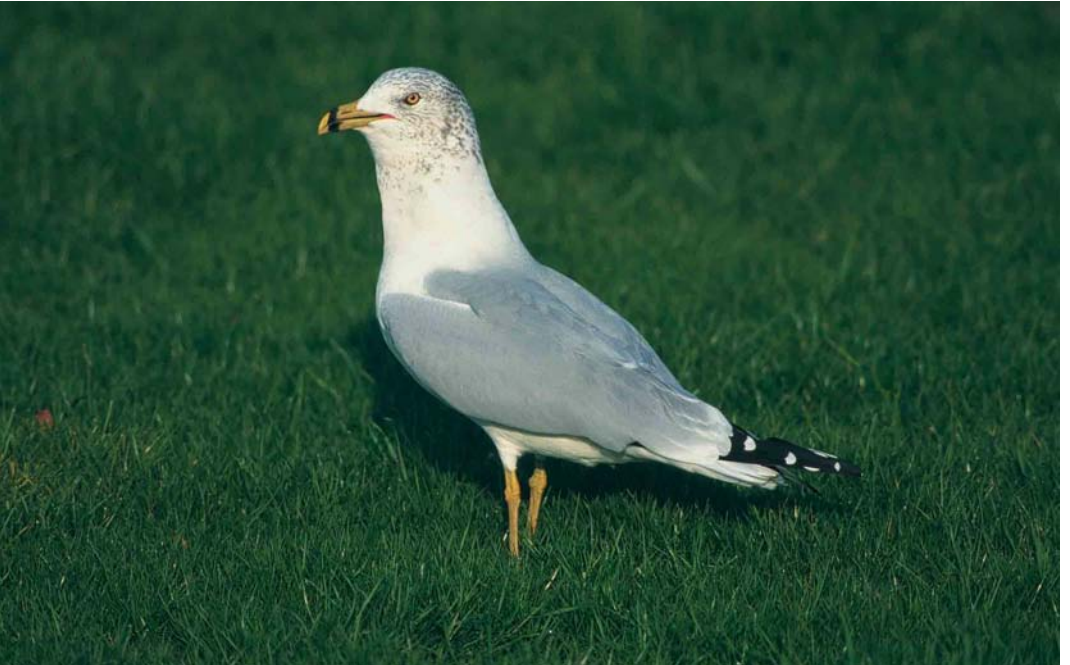
55 Ringsnavelmeeuw / Ring-billed Gull Larus delawarensis , adult, Goes, Zeeland, 21 november 1999 (Peter van Rij)