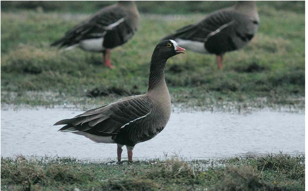
50 Dwerggans / Lesser White-fronted Goose Anser erythropus , Oude Land van Strijen, Zuid-Holland, 9 februari 2000 (Marten van Dijl)