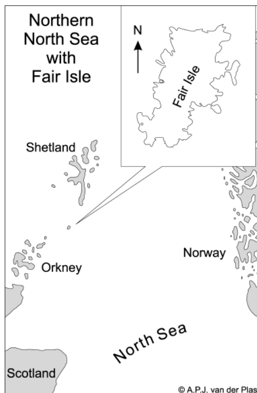
FIGURE 1 Geographical position of Fair Isle

The reason why Fair Isle is so good for migrants is a combination of many factors. Its geographical location and isolation make it ideally situated for regular migrant arrivals. Its small size and lack of cover mean that a relatively large proportion of the birds arriving there will be discovered, this being reinforced by the number of observers at peak times. As with all migrant hotspots however, weather conditions are crucial. The magic wind direction is south-east, although 'local' south-easterlies, blowing off the top of a westerly depression are not much use. In simple terms, classic weather for the Fair Isle involves a large, stable anticyclone over Scandinavia and the Eurasian landmass, producing south-easterlies right across the North Sea