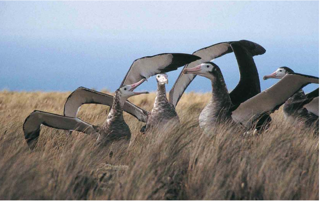
9 Amsterdam Albatrosses / Amsterdameilandalbatrossen Diomedea amsterdamensis , Amsterdam Island, Indian Ocean, January/February 1994 (Yann Tremblay)