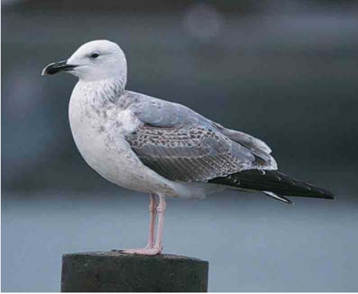
74 Pontische Meeuw / Pontic Gull Larus cachinnans cachinnans , tweede-winter, Lauwersoog, Groningen, 9 november 2000