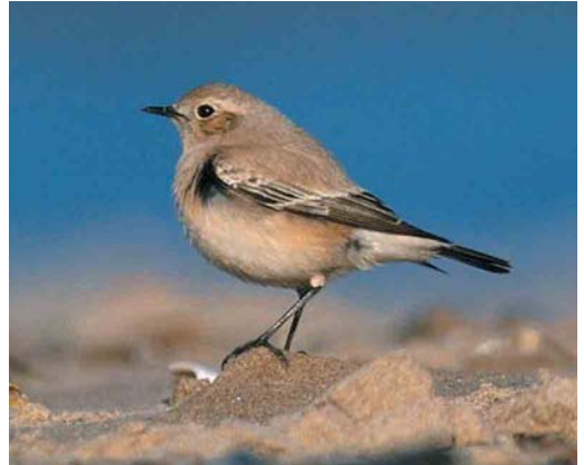
57 Forster's Tern / Forsters Stern Sterna forsteri , adult winter, Bangor, Wales, December 2000 58 Long-tailed Shrike / Langstaartklauwier Lanius schach , first-winter, Howmore, South Uist, Outer Hebrides, Scotland, November 2000 59 Red-flanked Bluetail / Blauwstaart Tarsiger cyanurus , Nova Gorica, Slovenia, 23 November 2000 60 Desert Wheatear / Woestijntapuit Oenanthe deserti , female, Holme Reserve, Norfolk, England, 4 November 2000

Koedijk and Castricum, and on 10 December at Haarlerberg, Sallandse Heuvelrug, Overijssel; some (or all) of these sightings may refer to the same individual. In Switzerland, the juvenile at La Broye remained until 11 November and probably the same individual was seen the next days flying along the Jura and elsewhere; by December, the bird wintering the past two years at Niederriedstausee, Bern, had not returned. In Spain, an adult was seen at Lucio del Lobo, Sevilla, on 25 November and a pale juvenile was at Aiguamolls de l'Empordà, Girona, on 18-21 December. Both in France and in Hungary, three were reported during November; the regular winterers in the Camargue were back in December. For the third consecutive year, one stayed at least until 20 December at Vasche di Maccharese, Roma, Italy. There were several other individuals seen in Italy. In Denmark, the second- or