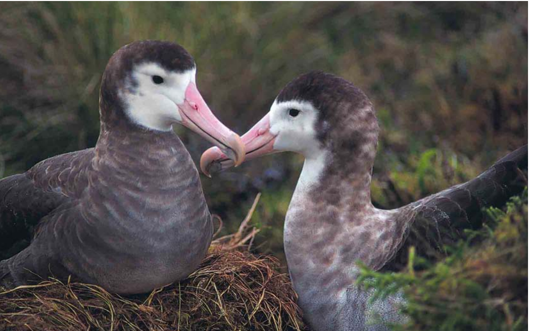
10 Amsterdam Albatrosses / Amsterdameilandalbatrossen Diomedea amsterdamensis , Amsterdam Island, Indian Ocean, March/April 1994 (Yann Tremblay)