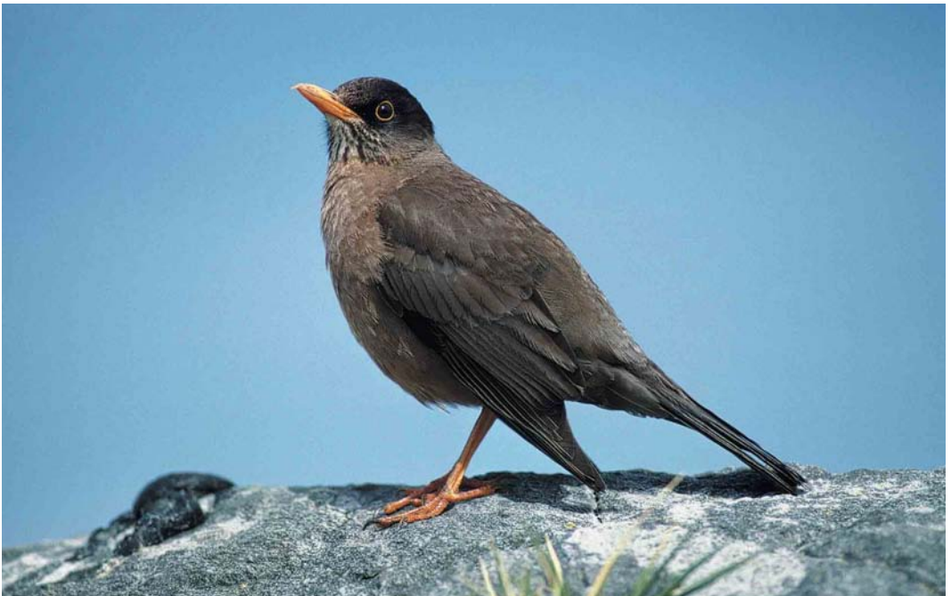
29 Falkland Thrush / Falklandlijster Turdus falcklandii falcklandii , Saunders Island, Falkland Islands, December 1990 (René Pop)