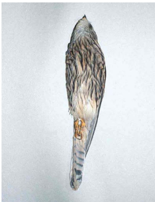
79-82 Kleine Torenvalk / Lesser Kestrel Falco naumanni , eerstejaars vrouwtje (gevonden bij Bergen, Noord-Holland, op 5 november 2000), Zoölogisch Museum Amsterdam, Noord-Holland, 18 december 2000