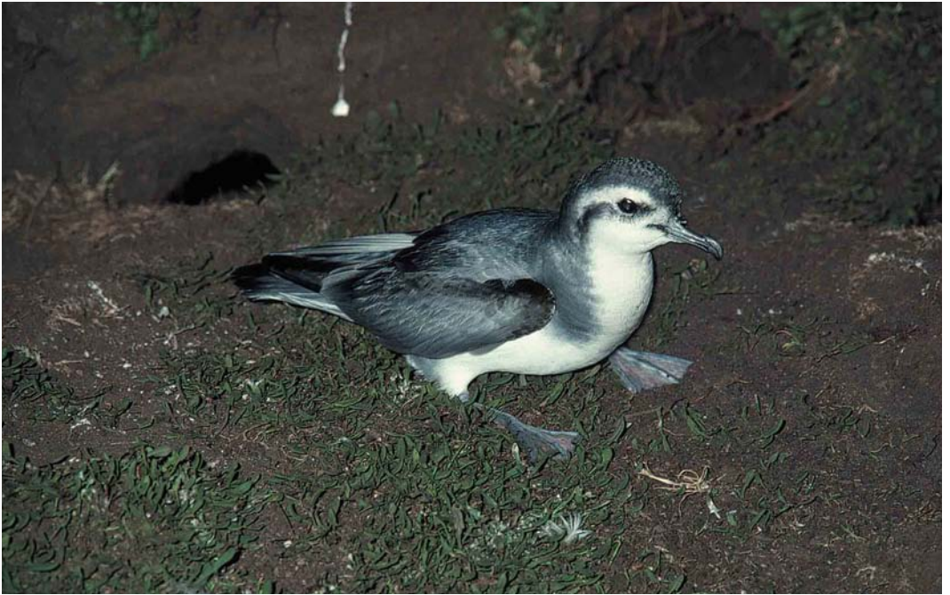
19 Slender-billed Prion / Dunbekprion Pachyptila belcheri , New Island, Falkland Islands, December 1990