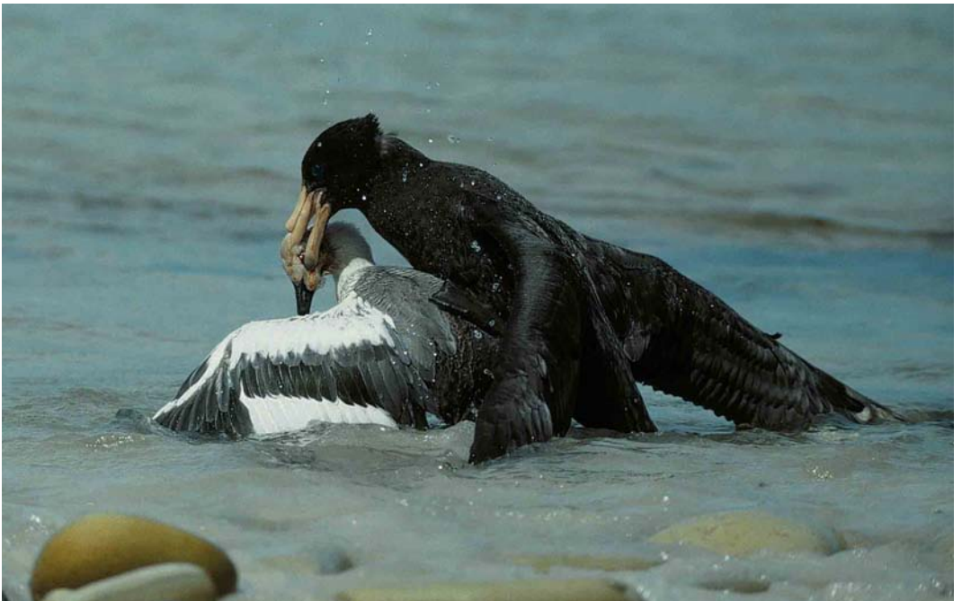
20 Southern Giant Petrel / Zuidelijke Reuzenstormvogel Macronectes giganteus , immature killing Upland Goose / Magelhaengans Chloephaga picta , New Island, Falkland Islands, January 1991 (René Pop)