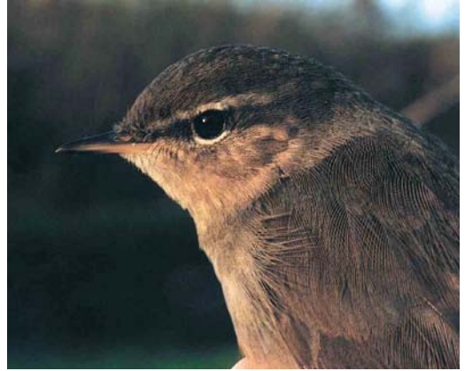
75 Bruine Boszanger / Dusky Warbler Phylloscopus fuscatus , Paradijsveld, AW-duinen, Zandvoort, Noord-Holland, 5 november 2000 ( Tom M van Spanje )