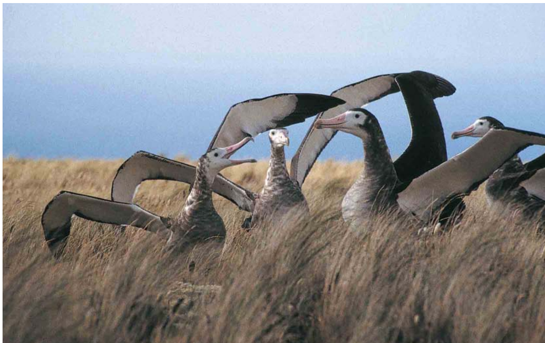
9 Amsterdam Albatrosses / Amsterdameilandalbatrossen Diomedea amsterdamensis , Amsterdam Island, Indian Ocean, January/February 1994