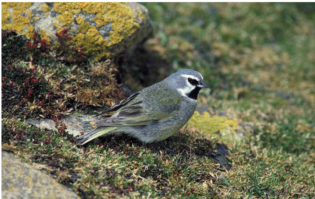
31 Canary-winged Finch / Magelhaengors Melanodera melanodera melanodera , Saunders Island, Falkland Islands, December 1990 (René Pop)