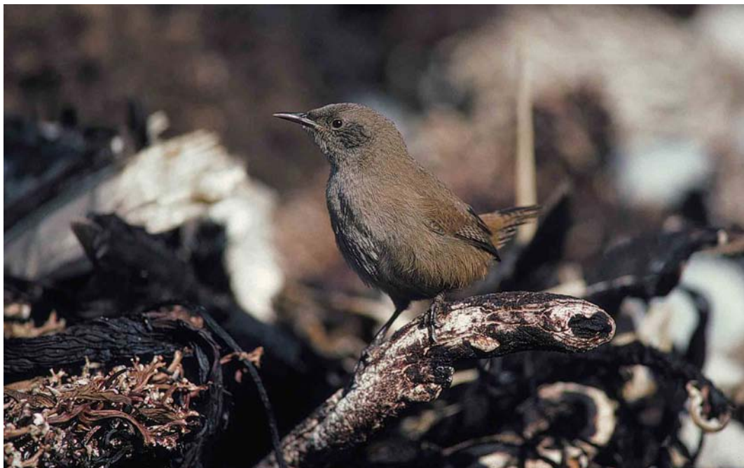
30 Cobb's Wren / Falklandwinterkoning Troglodytes cobbi , Kidney Island, Falkland Islands, January 1991 (René Pop)