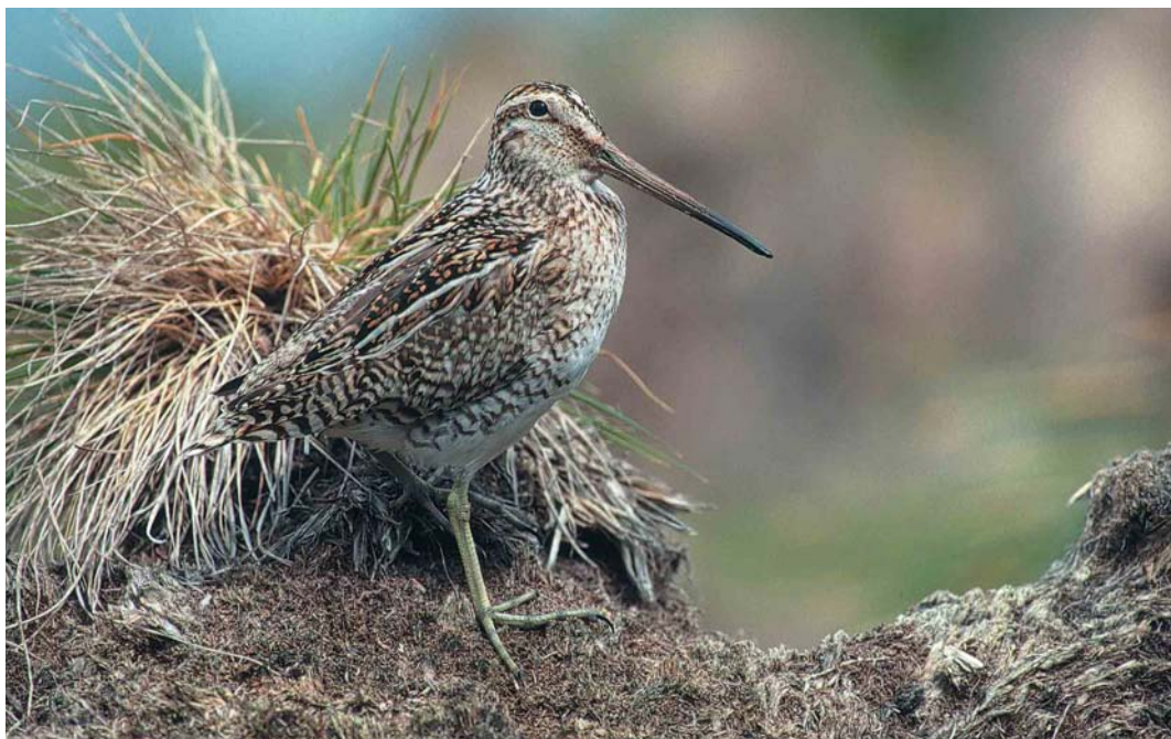
27 Magellanic Snipe / Magelhaensnip Gallinago magellanica , New Island, Falkland Islands, January 1991 (René Pop)