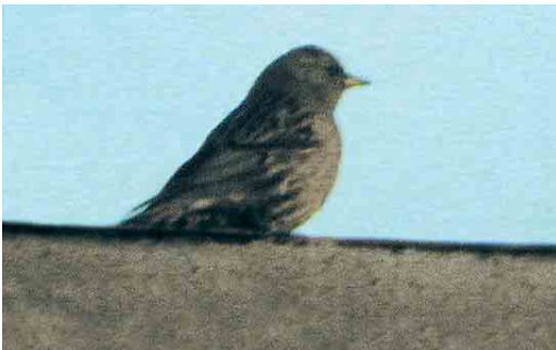
1-2 Alpenheggenmus / Alpine Accentor Prunella collaris , waarschijnlijk eerste-zomer, Den Helder, Noord-Holland, 17 april 2000

GROOTTE & BOUW Duidelijk groter dan Heggenmus P modularis . Ongeveer zo groot als dikke Huismus Passer domesticus . Directe vergelijking met andere vogels niet mogelijk. Bouw herinnerend aan die van Heggenmus maar borst en buik vrij dik. Snavel puntig en vrij dun. Handpenprojectie ongeveer gelijk aan zichtbare deel van langste tertial alsmede aan staartprojectie. In vlucht leken vleugels lang en maakte vogel leeuwerikachtige indruk.