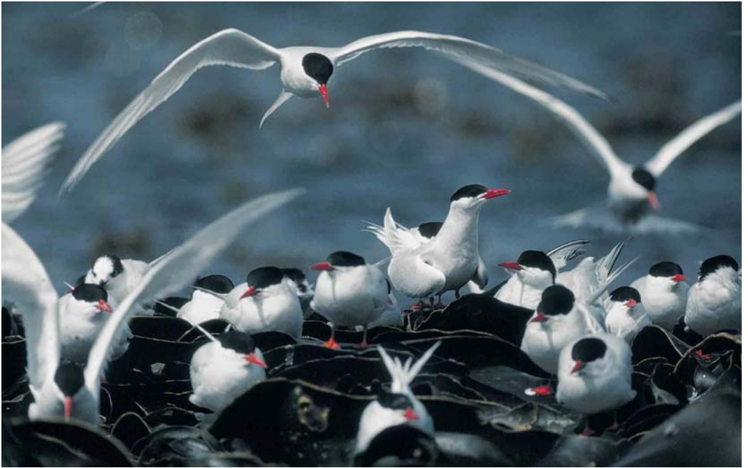
28 South American Terns / Zuid-Amerikaanse Visdieveen Sterna hirundinacea , Saunders Island, Falkland Islands, December 1990 (René Pop)