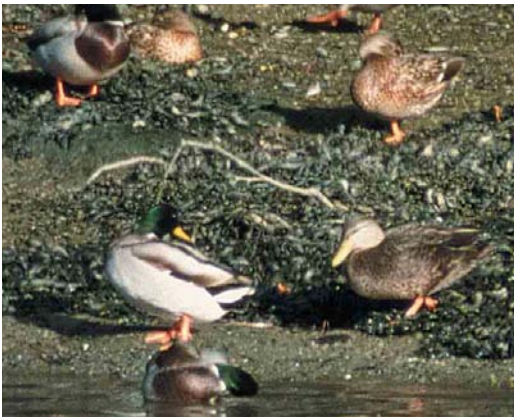
404 Rough-legged Buzzard / Ruigpootbuizerd Buteo lagopus , juvenile, Porto Pim, Faial, Azores, October 2001 (Mark Bolton) 405 Long-legged Buzzard / Arendbuizerd Buteo rufinus , second calendar-year, Noerdlinger Ries, Bavaria, Germany, 7 September 2001 (Markus Röhnild) 406 Semipalmated Plover / Amerikaanse Bontbekplevier Charadrius semipalmatus , juvenile, Cabo da Praia, Terceira, Azores, 28 September 2001 (Mark Bolton) 407 Green Heron / Groene Reiger Butorides virescens , first-winter, Messingham Sand Quarry, Lincolnshire, England, September 2001 (Steve Blain) 408 Belted Kingfisher / Bandijsvogel Ceryle alcyon , Porto Pim, Faial, Azores, October 2001 (Mark Bolton) 409 Black Duck / Zwarte Eend Anas rubripes , adult male (lower right), with Mallards / Wilde Eenden A platyrhynchos , Bowcombe Creek, Devon, England, October 2001 (Laurens B Steijn)