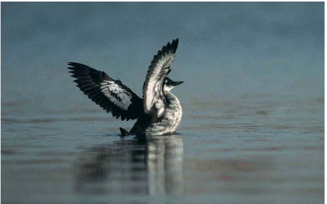
448 Zwarte Zeekoet / Black Guillemot Cephus grylle , eerste-winter, Oostende, West-Vlaanderen, 27 september 2001 (Peter Boesman)

soorten weinig overeenkomst tussen de tellingen van Oostende en De Panne. Van de 38 Vorkstaartmeeuwen Larus sabini vlogen er 33 langs Oostende met maximaal 10 op 16 september. Vooral de pleisterende adulte vogel in zomerkleed op 10 september kreeg bijzondere waardering. De eerste Pontische Meeuwen L cachinnans cachinnans doken op te Pommeroeul, Hainaut (een adulte en een eerste-zomer tot 23 september); en te Heist (een eerste-winter op 20 oktober). Op 16 september trok een adulte Grote Burgemeester L hyperboreus langs Oostende en het vaste overwinterende exemplaar keerde vanaf 25 september voor de vijfde opeenvolgende winter terug naar de haven van Oostende. Op 27 oktober was daar bovendien een eerstejaars aanwezig. Op 4 september trok een Lachstern Gelochelidon nilotica langs De Panne. Een adulte Reuzenster Sterna caspia werd op 1 september gezien op de Werf van het Kluisendok bij Gent en op 12 oktober trokken er twee over de Spuikom van Oostende. Op 22 september werd in de Voorhaven van Zeebrugge een juveniele Witvleugelsstern Chlidonias leucopterus geringd. Op 15 september werd te Oostende een adulte Zwarte Zeekoet Cephus grylle in zomerkleed ontdekt. De vogel foerageerde later op de dag tussen Oostende en De Haan, West-Vlaanderen, en trok daarna verder in zuidwestelijke richting. Het betreft het eerste twitchbare geval voor België. Minder dan een week later, op 20 september,