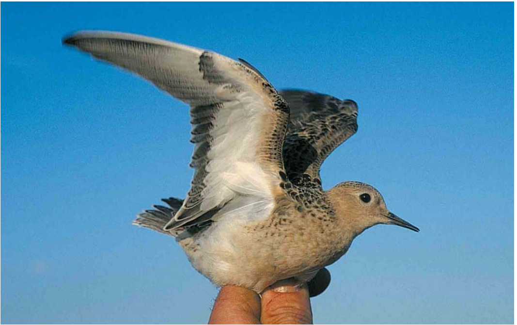
456 Blonde Ruiters / Buff-breasted Sandpiper Tryngites subruficollis , juveniel, Opmeer, Noord-Holland, 5 oktober 2001

Eerste vangst van Blonde Ruiters in Nederland Op 5 oktober 2001 werd ik door Arie Slijkerman gebeld; hij had tijdens het wilsterflappen in een weiland bij Opmeer, Noord-Holland, een steltloper gevangen die hij niet direct kon thuisbrengen. De vogel vloog samen met enkele Kieviten Vanellus vanellus . Opvallend waren de ronde, relatief kleine kop zonder wenkbrauwstreep en de warm bruingele ongestreepte zijkop, borst, keel en nek. Een vleugelstreep ontbrak en de vogel vertoonde ook geen opvallende witte zijden aan stuit en bovenstaart. De snavel was kort, dun en vrijwel recht. De onderkant van de vleugels was witachtig met een opvallend donkere polsvlek en een fijn gespikkelde donkere vleugelboeg. Met deze kenmerken werd duidelijk dat AS een Blonde Ruiters Tryngites subruficollis in zijn netten had gekregen. Bij Blonde Ruiters vormt de bovengenoemde sterk contrasterende tekening op de ondervleugel een belangrijke rol tijdens de balts, waarbij de mannetjes met uitgespreide vleugels de onderkant van hun vleugels tonen.