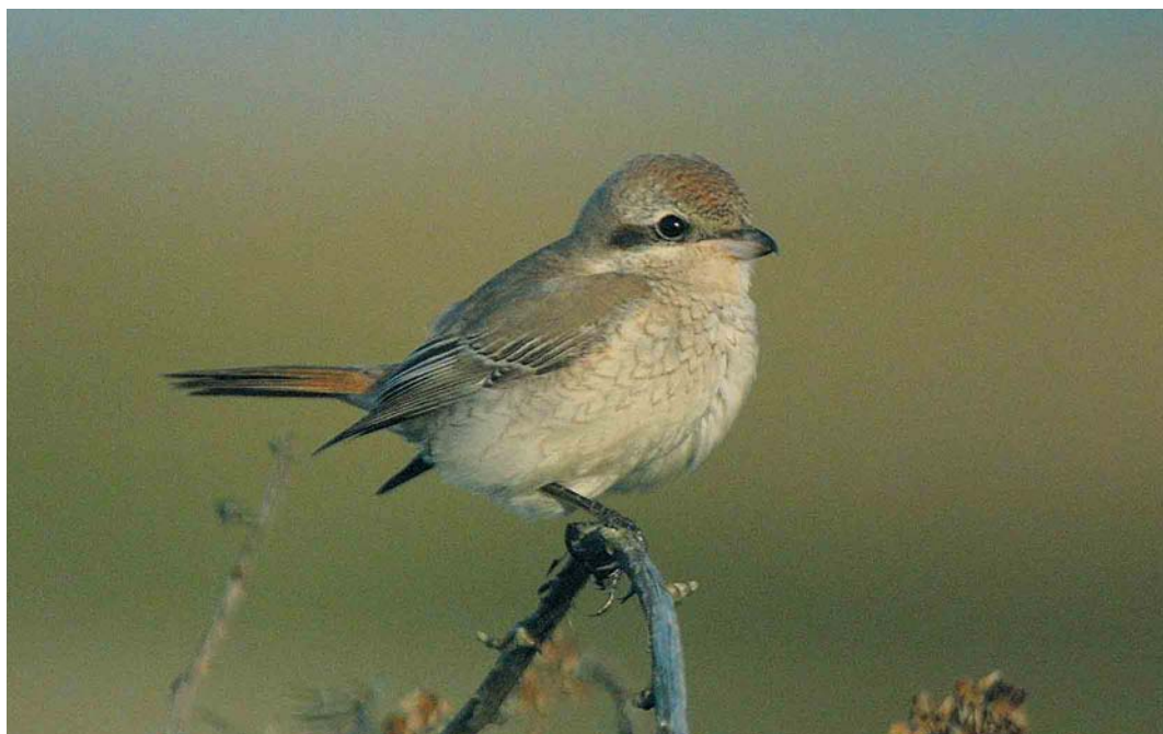
418 Turkestan Shrike / Turkestaanse Klauwier Lanius phoenicuroides , first-winter, Dungeness, Kent, England, October 2001