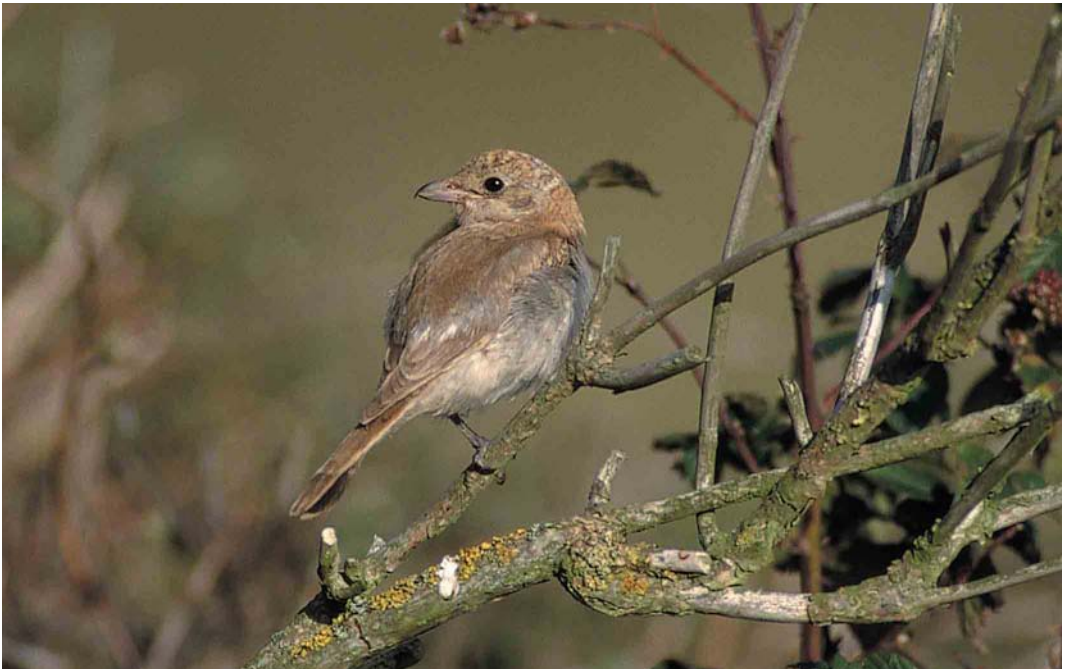
391 Woodchat Shrike / Roodkopklauwier Lanius senator , first-winter, De Nederlanden, Texel, Noord-Holland, 3 October 2000