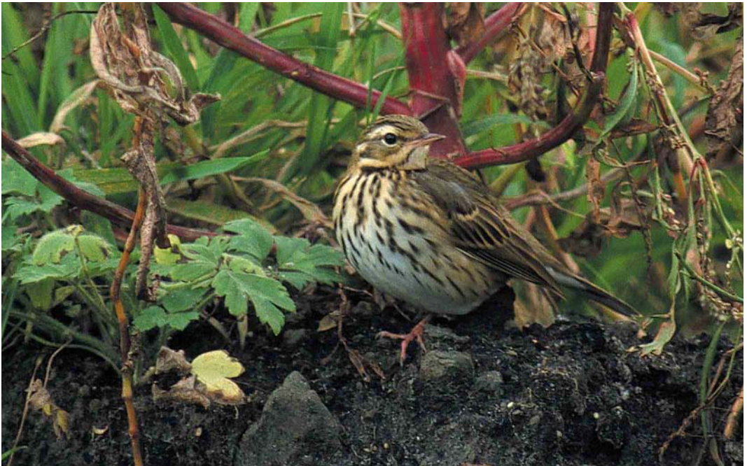
455 Siberische Boompieper / Olive-backed Pipit Anthus hodgsoni , Mariahoeve, Den Haag, Zuid-Holland, 3 oktober 2001

OLIVE-BACKED PIPIT An Olive-backed Pipit Anthus hodgsoni stayed between Den Haag and Wassenaar, Zuid-Holland, the Netherlands, on 2-5 October 2001. This was the 10th record for the Netherlands and the first to be twitchable since 1991.