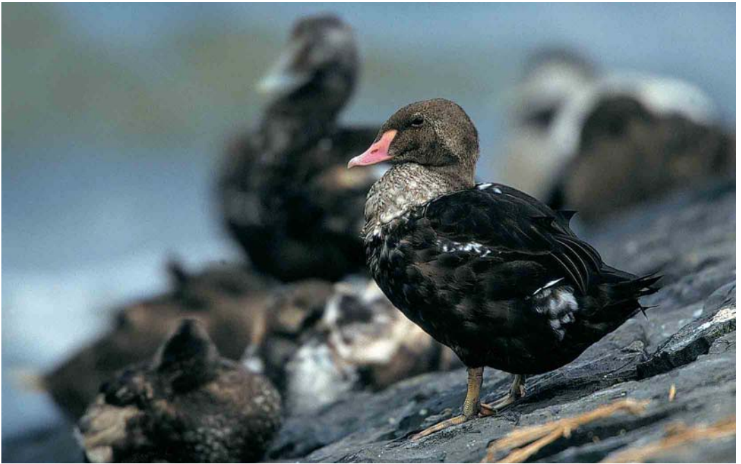
355 King Eider / Koningseider Somateria spectabilis , second calendar-year male, Oudeschild, Texel, Noord-Holland, 3 September 2000 ( Jan van Holten )