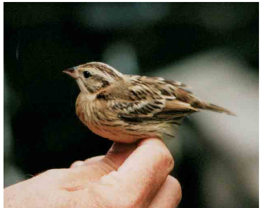
436 Vorkstaartmeeuw / Sabine's Gull Larus sabini , adult of tweede-kalenderjaar ruiend naar winterkleed, Brouwersdam, Zeeland, september 2001 ( Andy Lovering ) 437 Kleine Vliegenvanger / Red-breasted Flycatcher Ficedula parva , adult mannetje, Maasvlakte, Zuid-Holland, 29 september 2001 ( Marjolein Baijens ) 438 Noordse Boszanger / Arctic Warbler Phylloscopus borealis , Schiermonnikoog, Friesland, 13 september 2001 ( Bouke Henstra ) 439 Grauwe Fitis / Greenish Warbler Phylloscopus trochiloides , eerstejaars, Vlieland, Friesland, 1 september 2001 ( Henri Bouwmeester ) 440 Kleine Spotvogel / Booted Warbler Acrocephalus caligatus , Veldiger Buitenland, Hasselt, Overijssel, 22 september 2001 ( Jeroen Bredenbeek ) 441 Wilgengors / Yellow-breasted Bunting Emberiza aureola , juveniel, Schiermonnikoog, Friesland, 11 september 2001 ( Bouke Henstra )