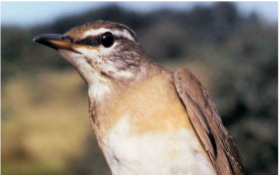
435 Vale Lijster / Eyebrowed Thrush Turdus obscurus , eerste-winter, Oranjezon, Walcheren, Zeeland, 25 september 2001