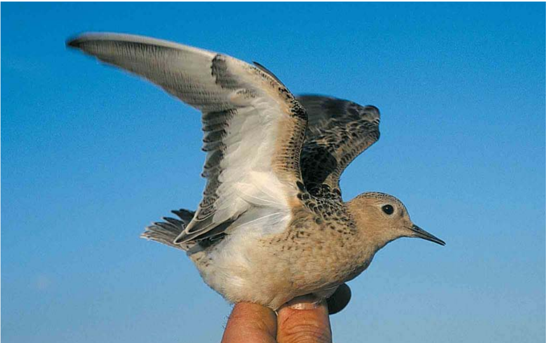
456 Blonde Ruiters / Buff-breasted Sandpiper Tryngites subruficollis , juveniel, Opmeer, Noord-Holland, 5 oktober 2001 (Fred J Koning)

Eerste vangst van Blonde Ruiters in Nederland Op 5 oktober 2001 werd ik door Arie Slijkerman gebeld; hij had tijdens het wilsterflappen in een weiland bij Opmeer, Noord-Holland, een steltloper gevangen die hij niet direct kon thuisbrengen. De vogel vloog samen met enkele Kieviten Vanellus vanellus . Opvallend waren de ronde, relatief kleine kop zonder wenkbrauwstreep en de warm bruingele ongestreepte zijkop, borst, keel en nek. Een vleugelstreep ontbrak en de vogel vertoonde ook geen opvallende witte zijden aan stuit en bovenstaart. De snavel was kort, dun en vrijwel recht. De onderkant van de vleugels was witachtig met een opvallend donkere polsvlek en een fijn gespikkelde donkere vleugelboeg. Met deze kenmerken werd duidelijk dat AS een Blonde Ruiters Tryngites subruficollis in zijn netten had gekregen. Bij Blonde Ruiters vormt de bovengenoemde sterk contrasterende tekening op de ondervleugel een belangrijke rol tijdens de balts, waarbij de mannetjes met uitgespreide vleugels de onderkant van hun vleugels tonen.