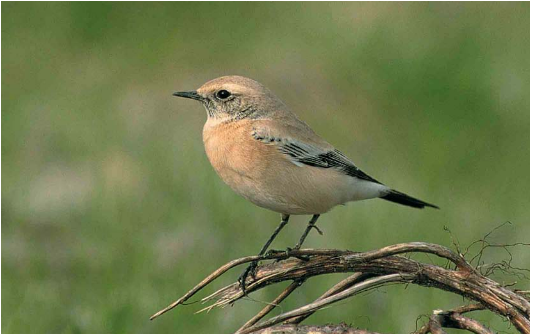
434 Woestijntapuit / Desert Wheatear Oenanthe deserti , eerste-winter mannetje, Eemshaven, Groningen, 13 oktober 2001 ( Eric Koops )