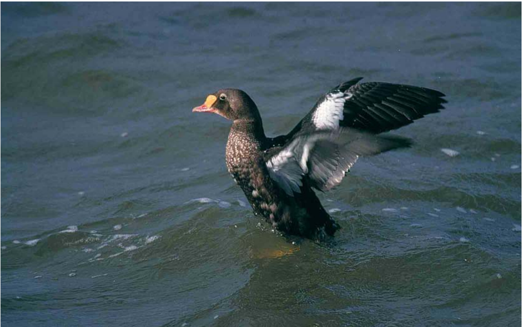
356 King Eider / Koningseider Somateria spectabilis , adult male eclipse, Oudeschild, Texel, Noord-Holland, 3 October 2000 ( Hans Gebuis )