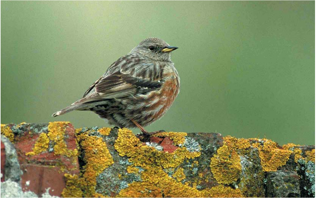
375 Alpine Accentor / Alpenheggenmus Prunella collaris , first-summer, Terschelling, Friesland, 3 May 2000