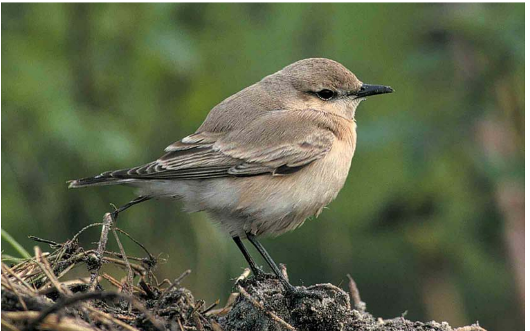
376 Isabelline Wheatear / Izabeltapuit Oenanthe isabellina , first-year, Schiermonnikoog, Friesland, 16 October 2000