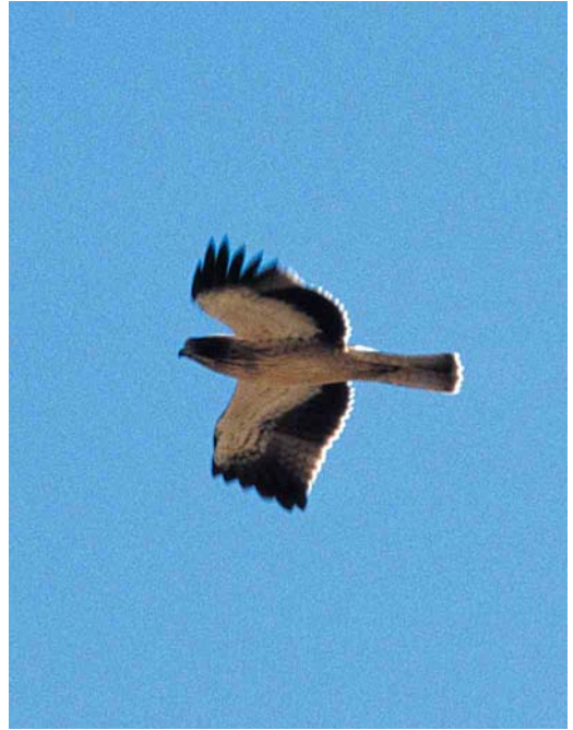
426 Dwergarend / Booted Eagle Hieraetus pennatus , juveniel, lichte vorm, Groene Pollen, Terschelling, Friesland, 30 september 2000 (Arie Ouwerkerk)

en op 12 oktober bij de Bandpolder. Een Steppekievit Vanellus gregarius vloog op 7 oktober over bij Houthem, Limburg. Bonapartes Strandlopers Calidris fuscicollis bleven gezien worden in het Lauwersmeergebied: tot 13 september één in de Ezumakeeg, Friesland, op 5 september twee aldaar en op 4 september mogelijk weer een andere aan de oostkant van de Lauwersmeer, Groningen, en op 4 en 5 november (weer) één – ditmaal een juveniel – bij het Jaap Deensgat in de het Groningse deel. Een Bairds Strandloper C bairdii werd gemeld op 22 september kort ter plaatse op de Maasvlakte. Gestreepte Strandlopers C melanotos verbleven tot 6 september in de Ezumakeeg, op 2 september bij Alkmaar, Noord-Holland, op 12 september in het Oude Robbengat in de Lauwersmeer, en op 16 september bij Ulrum, Groningen. Het exemplaar dat in de voorgaande periode in de Ezumakeeg als juveniele werd gemeld, blijkt toch een adulte te zijn geweest. Op 2 september werd een Blonde Ruiter Tryngites subruficollis ontdekt bij Paesens, Friesland, en later die dag verscheen deze vogel in de Ezumakeeg. Daarnaast was er een melding van deze soort op 30 september bij Petten. Op 5 oktober werd er één gevangen en geringd bij Opmeer, Noord-Holland. Langsvliegende Poelsnippen Gallinago media werden gezien op 29 september op Vlieland en op 2 oktober op Texel. De Grote Grijsje Snip Limnodromus scolopaceus verscheen tussen 8 en 10 september weer op