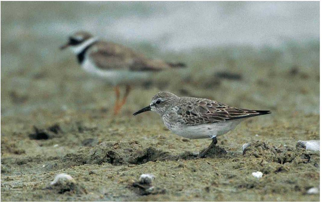
364 White-rumped Sandpiper / Bonapartes Strandloper Calidris fuscicollis , adult summer moulting to winter plumage, Pompevlak, De Geul, Texel, Noord-Holland, 3 September 2000