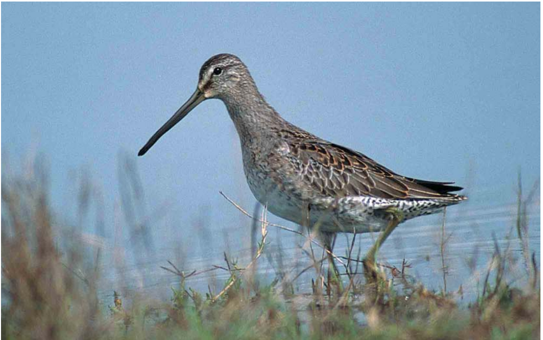
399 Long-billed Dowitcher / Grote Griijze Snip Limnodromus scolopaceus , juvenile, Pêra marsh, Algarve, Portugal, October 2001 (Ray Tipper)