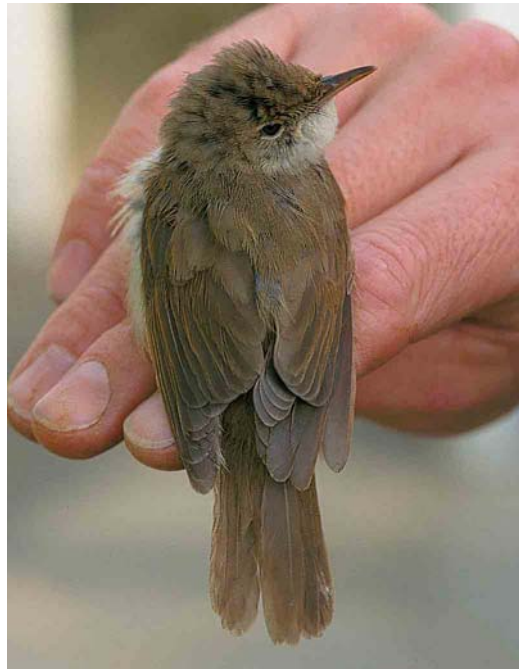
457-458 Struikrietzanger / Blyth's Reed Warbler Acrocephalus dumetorum , eerste-winter, Kennemerduinen, Noord-Holland, 17 oktober 2001

Tussenbroek. De volgende maten werden genoteerd: vleugellengte 64 mm, staartlengte 52 mm, snavelpunt tot schedel 17.7 mm, snavelbreedte (ter hoogte van achterrand van neusgat) 4.7 mm, versmalling van binnenvlag ('notch') van p2 18.5 mm (handpennen van buiten naar binnen genummerd), gewicht 10.2 g en vetgraad 0. Verder hadden alleen p3 en p4 een duidelijke versmalling van de buitenvlag. De tenen en nagels waren korter en kleiner dan bij een Kleine Karekiet of Bosrietzanger A palustris . De vogel werd op basis van deze gegevens en de afwijkende 'strogrijze' kleur door de aanwezigheid als valse spotvogel A (pallidus) elaeicus/opacus gedetermineerd, waarna hij opnieuw werd gemeten en gefotografeerd door CvD. Na een vergeefse poging om Arnoud van den Berg te waarschuwen werd de vogel weer losgelaten. De volgende dagen kwamen de foto's van CvD onder ogen van achtereenvolgens AvdB, André van Loon en Lars Svensson. Bij pogingen om de vogel op naam te brengen werd Struikrietzanger aanvankelijk buiten beschouwing gelaten omdat de versmalling van de binnenvlag van p2 te lang was (deze zou maximaal 14 mm mogen zijn; LS heeft ooit 15.5 mm gemeten). Vanwege de vleugellengte en het aantal handpenversmallingen was ook duidelijk dat het geen afwijkend getinte 'gewone' Acrocephalus -soort kon zijn. Afgezien van het ontbreken van een buitenvlagversmalling van p5 kwam de biometrie redelijk overeen met valse spotvogel. De foto's lieten echter