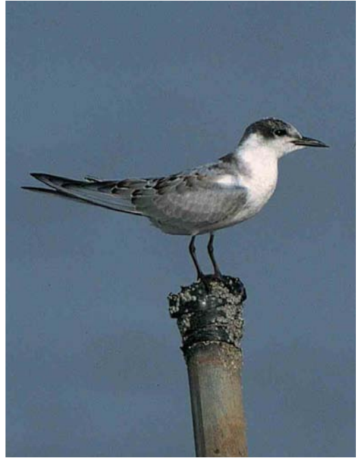
427 Witvleugelstern / White-winged Tern Chlidonias leucopterus , juveniel, Lauwersoog, Groningen, 14 oktober 2001 (Roef Mulder) 428 Witwangstern / Whiskered Tern Chlidonias hybridus , juveniel ruiend naar eerste-winter, Lauwersoog, Groningen, 14 oktober 2001 (Roef Mulder) 429 Vorkstaartmeeuw / Sabine's Gull Larus sabini , adult of tweede-kalenderjaar ruiend naar winterkleed, Brouwersdam, Zeeland, september 2001 (Mars Muusse)