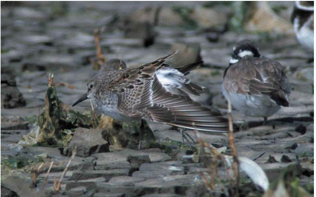
365 White-rumped Sandpiper / Bonapartes Strandloper Calidris fuscicollis , adult summer, Zwarte Haan, Friesland, 20 August 2000