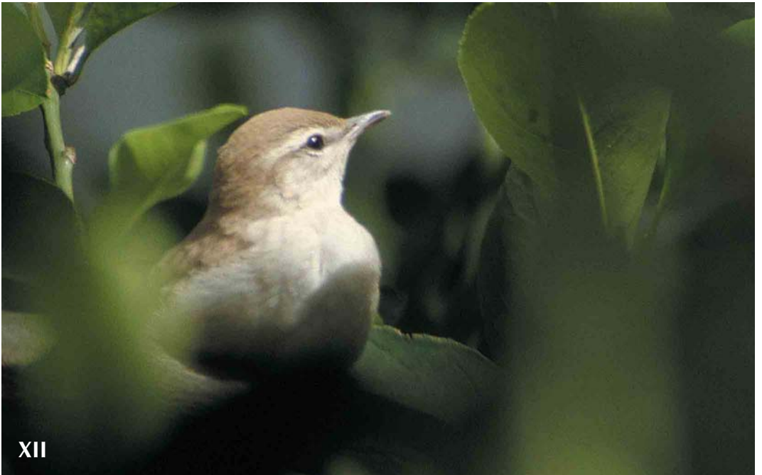
Mystery photograph XII (July)