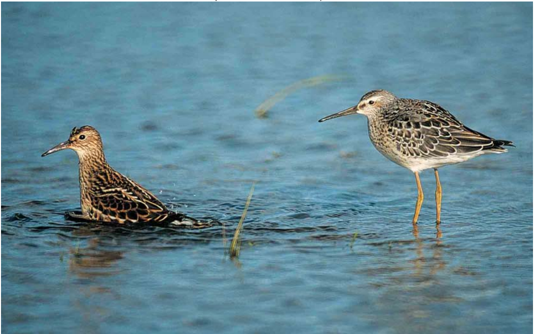
403 Stilt Sandpiper / Steltstrandloper Micropalama himantopus , juvenile moulting to first-winter (right), and Pectoral Sandpiper / Gestreepte Strandloper Calidris melanotos , juvenile, Lough Beg, Londonderry, Northern Ireland, 16 September 2001 (Anthony McGeehan)