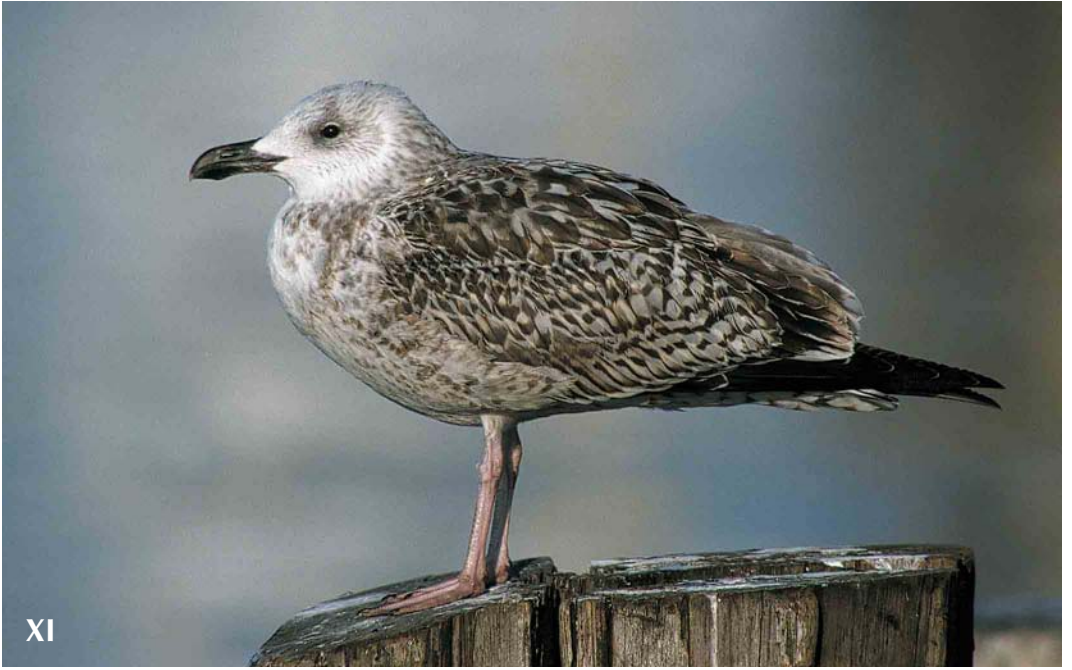
Mystery photograph XI (March)