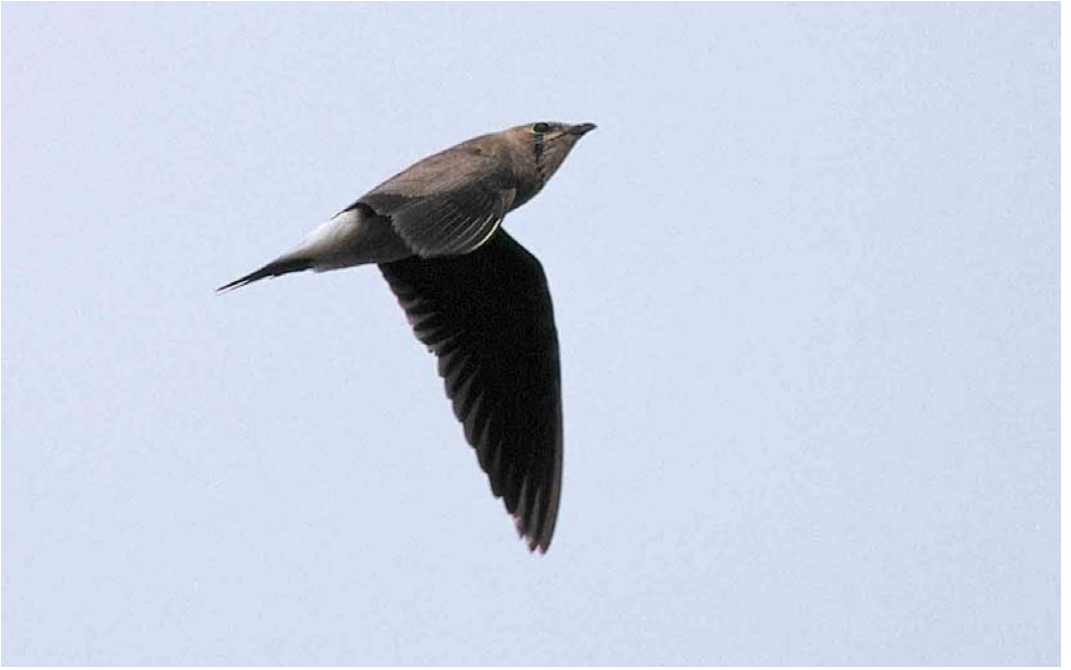
400-401 Oriental Pratincole / Oosterse Vorkstaartplevier Glareola maldivarum , second calendar-year, Falsterbo, Skåne, Sweden, 21 September 2001 (Arie Ouwerkerk)