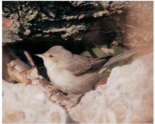
449 Sperwergrasmus / Barred Warbler Sylvia nisoria , eerstejaars, Zeebrugge, West-Vlaanderen, 19 september 2001