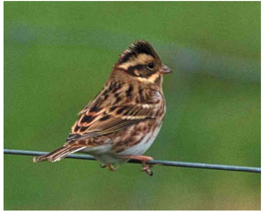
366 White-tailed Lapwing / Witstaartkievit Vanellus leucurus , adult, Polder Maltha, Werkendam, Noord-Brabant, 9 August 2000 ( Arie Ouwerkerk ) 367 Alpine Swift / Alpengierzwaluw Apus melba , Zoetermeer, Zuid-Holland, 17 April 2000 ( Wesley Overman ) 368 Broad-billed Sandpiper / Breedbekstrandloper Limicola falcinellus , adult summer, Den Oever, Noord-Holland, 5 May 2000 ( Daniel Benders ) 369 Laughing Gull / Lachmeeuw Larus atricilla , adult, Arnhem, Gelderland, August 2000 ( Teus J.C. Luijendijk ) 370 Citrine Wagtail / Citroenkwikstaart Motacilla cinerea , adult male, Jaap Deensgat, Lauwersmeer, Groningen, 9 May 1999 ( Roef Mulder ) 371 Rustic Bunting / Bosgors Emberiza rustica , Oosterend, Terschelling, 5 October 2000 ( Arie Ouwerkerk )