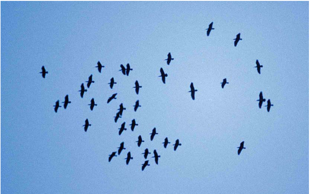
396 Northern Bald Ibises / Kaalkopibissen Geronticus eremita , flock of 38, Tamri, Morocco, 20 September 2001