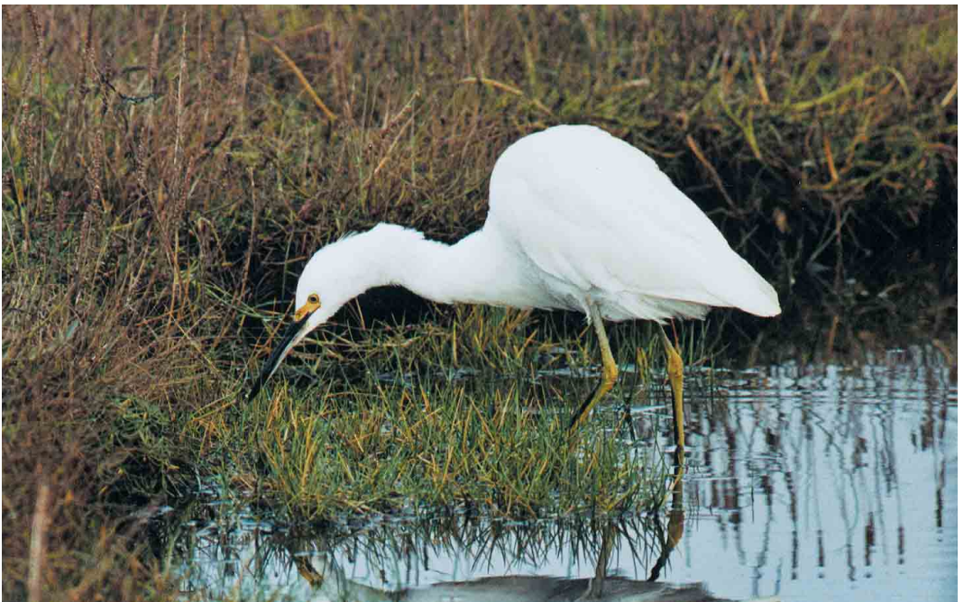
397 Snowy Egret / Amerikaanse Kleine Zilverreiger Egretta thula , first-winter, Balvicar, Seil Island, Argyll, Scotland, November 2001