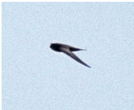
34 Possible Bates' Swift / mogelijke Bates' Gierzwaluw Apus batesi , Rabil Lagoon, Boavista, Cape Verde Islands, 22 February 1999 (Kris De Rouck)

which Schouteden's Swift S schoutedeni is extremely rare and local, found only in Congo) could be excluded by their different structure: Schoutedenapus swifts are rather fat bodied and show a very pointed, spiky tail (not unlike White-rumped Swift A caffer ); they have a proportionally broader innerwing and a shorter-looking outerwing which gradually tapers to a sharp point. The throat is paler in Scarce Swift S myoptilus and a blue gloss is absent in both species. Cypsiurus species (the two palm swifts) are extremely slender, have a pale brown-grey plumage and show a different flight action.