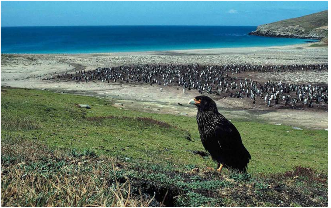
23 Striated Caracara / Falklandcaracara Phalco boenus australis , near colony of Gentoo Penguin / Ezelspinguïn Pygoscelis papua , New Island, Falkland Islands, January 1991 (René Pop) 24 Southern Crested Caracaras / Zuidelijke Kuifcaracara's Caracara plancus , Saunders Island, Falkland Islands, December 1990 (René Pop) 25 Rufous-chested Plover / Patagonische Plevier Charadrius modestus , Saunders Island, Falkland Islands, December 1990 (René Pop)