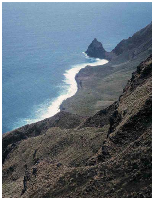
6 Amsterdam Albatross / Amsterdameilandalbatros Diomedea amsterdamensis , Amsterdam Island, Indian Ocean, 1994 ( Yann Tremblay ) 7 Cape d'Entrecasteaux, Amsterdam Island, Indian Ocean, 20 January 1998 ( Alfred van Cleef ) 8 Amsterdam Albatross / Amsterdameilandalbatros Diomedea amsterdamensis , Amsterdam Island, Indian Ocean, 5 January 1998 ( Alfred van Cleef )