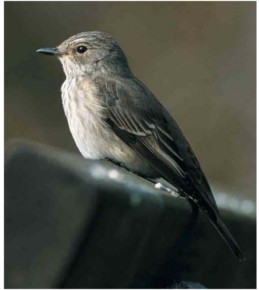
37 Spotted Flycatcher / Grauwe Vliegenvanger Muscicapa striata , first-winter, Helgoland, Schleswig-Holstein, Germany, October 2000

A Chlidonias tern in non-breeding plumage with a clear dark spot at the breast-side, as shown by the mystery bird, normally leads straightforward to Black Tern. However, a good look at the bird reveals several more or less strange things for this species. The breast-side spot is not very dark and rather narrow and it does not broaden towards the centre of the breast as it normally does in Black. There is a small diffuse dark tip on the tail-feathers, forming a narrow dark rear edge to the tail. Also, the underside of the outer wing is quite pale, which is normally somewhat darker in Black. Although these features are not diagnostic on their own,