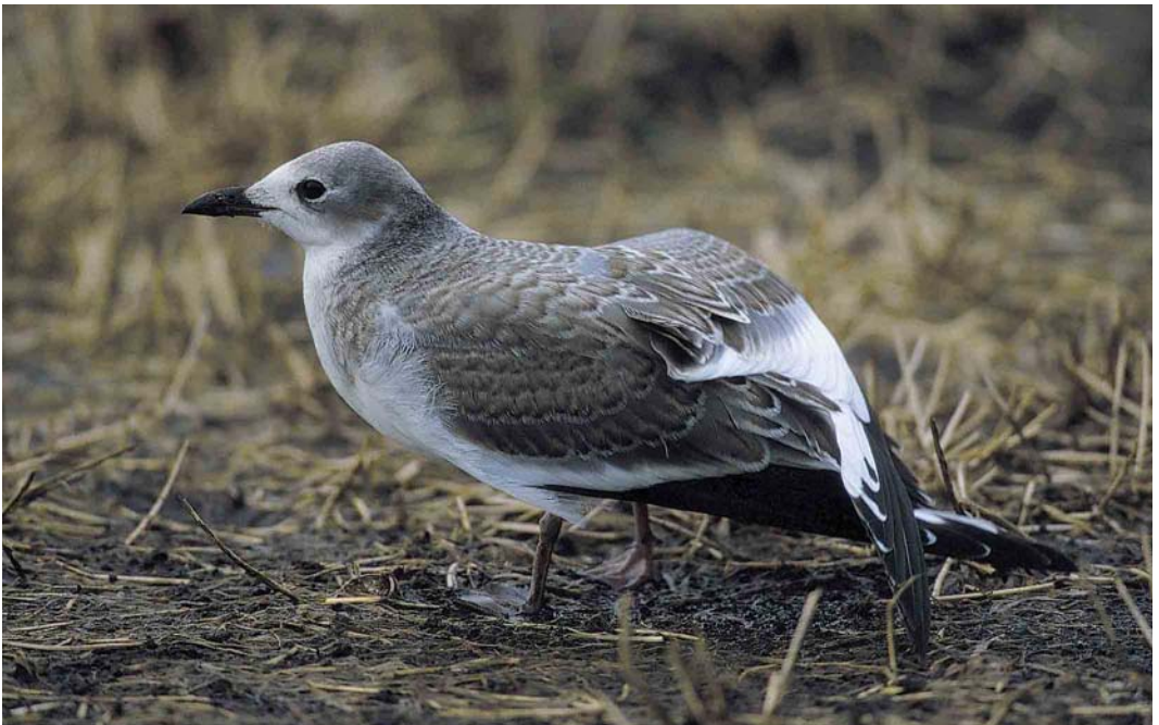
68 Vorkstaartmeeuw / Sabine's Gull Larus sabini , juveniel ruiend naar eerste-winter, Nieuwkoop, Zuid-Holland, 11 november 2000