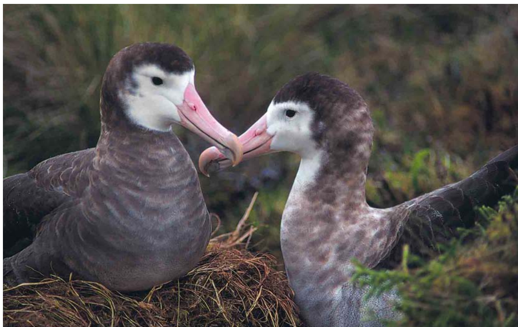
10 Amsterdam Albatrosses / Amsterdameilandalbatrossen Diomedea amsterdamensis , Amsterdam Island, Indian Ocean, March/April 1994 (Yann Tremblay)