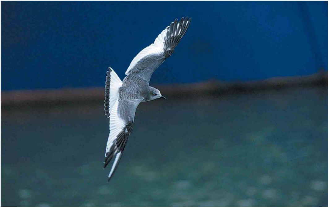
67 Vorkstaartmeeuw / Sabine's Gull Larus sabini , juveniel, Lauwersoog, Groningen, 14 oktober 2000 (Roef Mulder) cf Dutch Birding 22: 311, 2000