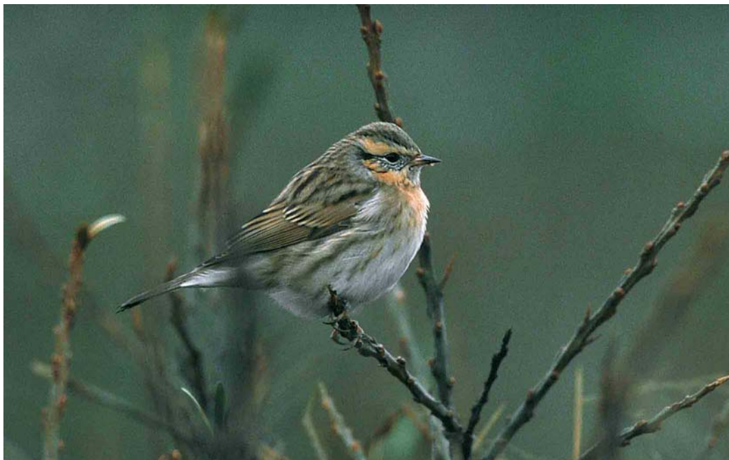
63 Black-throated Accentor / Zwartkeelheggenmus Prunella atrogularis , Pori, Tahkoluoto, Finland, November 2000