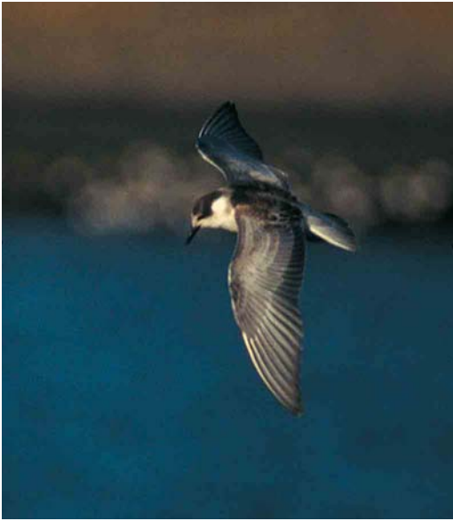
36 Whiskered Tern / Witwangstern Chlidonias hybridus , juvenile moulting to first-winter plumage, Den Oever, Noord-Holland, Netherlands, 5 November 1995

X Although belonging to the tern family for the same reasons as described for mystery bird IX, there are quite obvious structural differences between these two mystery birds. This bird has broader, proportionally shorter and more blunt-tipped wings than mystery bird IX and a shorter and more rounded tail with all tail-feathers round-tipped. All these features point to the marsh terns Chlidonias : Black C niger , White-winged C leucopterus and Whiskered Tern C hybridus . Additionally, the shape of the outer primaries is more curved in Chlidonias terns than in Sterna terns, which is also shown by the mystery bird.