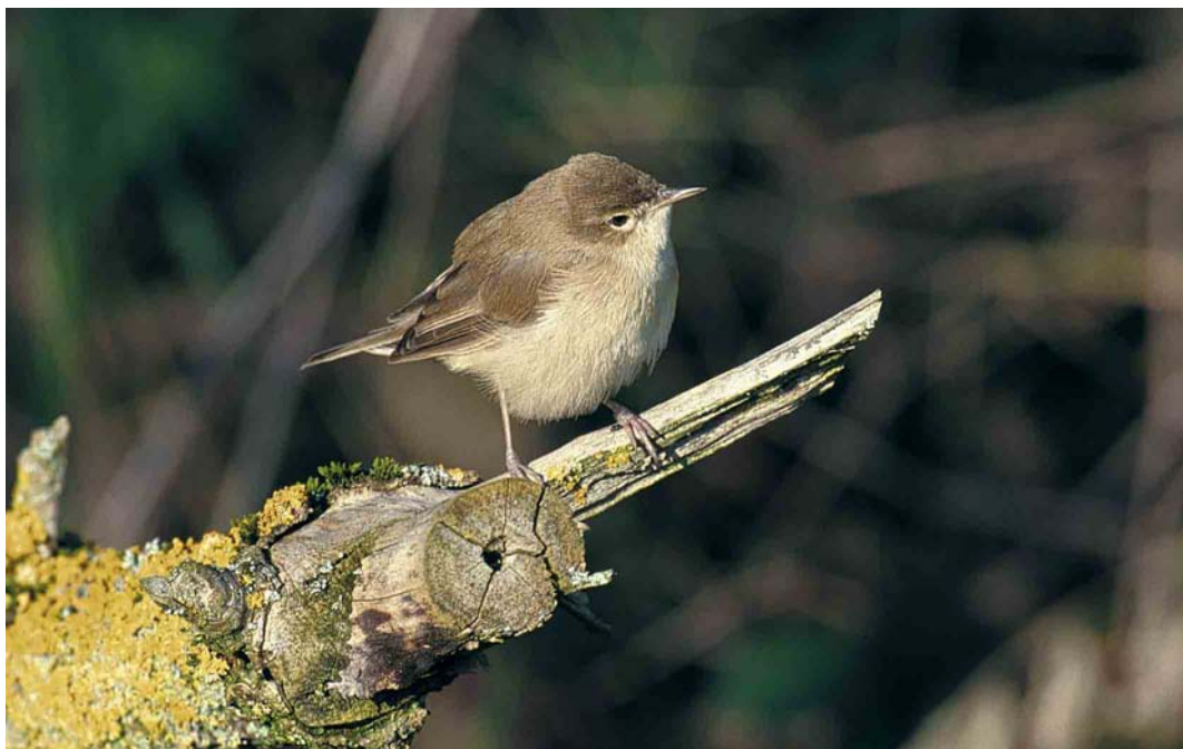
64 Booted Warbler / Kleine Spotvogel Acrocephalus caligatus , Ins, Switzerland, 18 November 2000