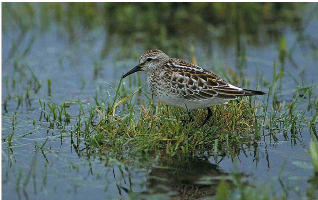
61 White-rumped Sandpiper / Bonapartes Strandloper Calidris fuscicollis , juvenile, Lough Beg, Londonderry, Northern Ireland, 30 October 2000 (Anthony McGeehan)