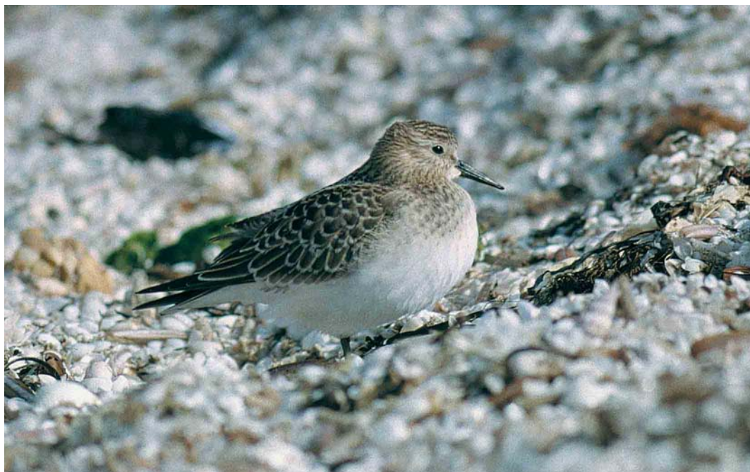
62 Baird's Sandpiper / Bairds Strandloper Calidris bairdii , juvenile, Stensnæs, Sæby, Nordjylland, Denmark, September 2000 (Allan Kjør Villesen) cf Dutch Birding 22: 297, 2000