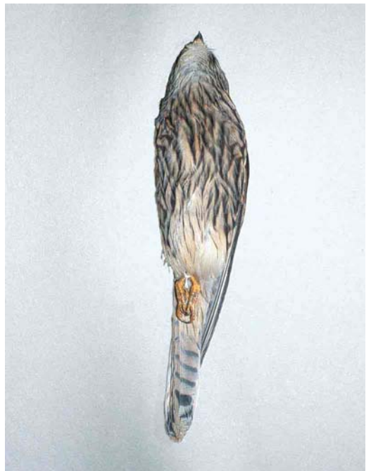
79-82 Kleine Torenvalk / Lesser Kestrel Falco naumanni , eerstejaars vrouwtje (gevonden bij Bergen, Noord-Holland, op 5 november 2000), Zoölogisch Museum Amsterdam, Noord-Holland, 18 december 2000