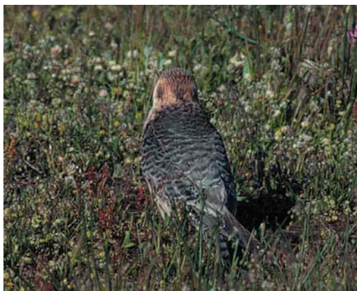
Mystery photograph II (May)

Only subscribers to Dutch Birding are eligible to enter. Excluded from entry are the editors and members of the editorial board of Dutch Birding and the members of the board of the Dutch Birding Association. Photographers whose work is used in the competition (both as mystery birds or