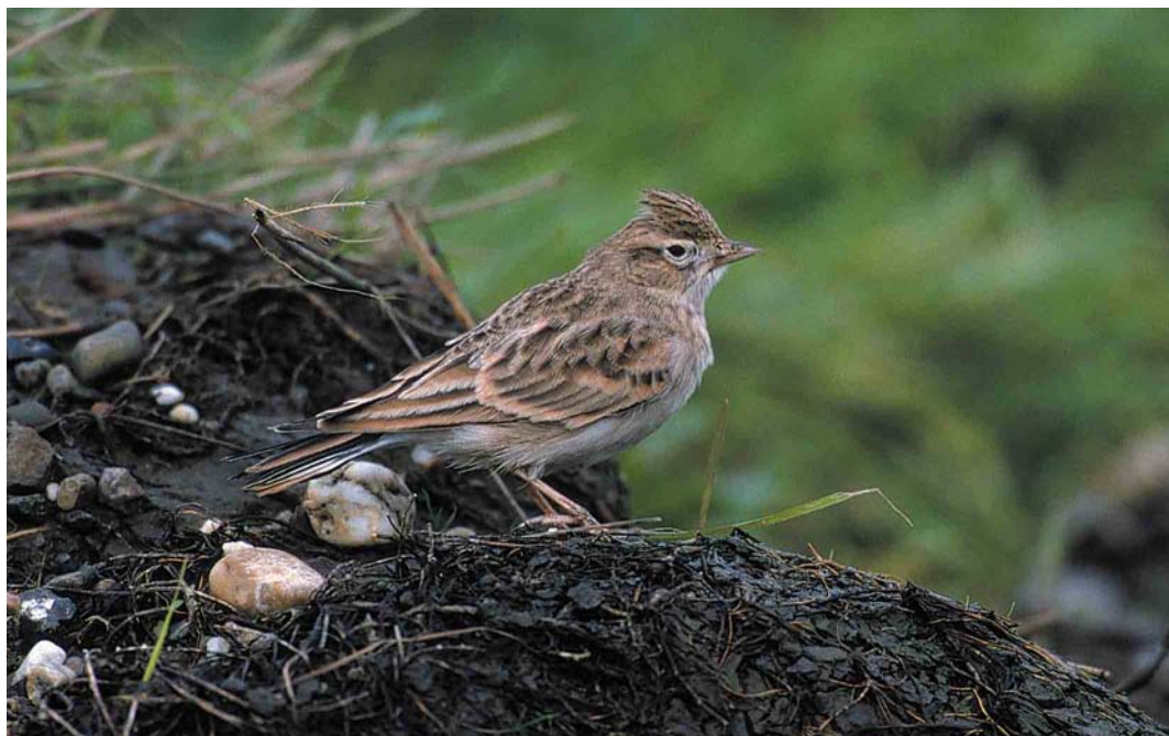
69 Kortteenleeuwerik / Greater Short-toed Lark Calandrella brachydactyla , Camperduin, Schoorl, Noord-Holland, 10 november 2000 (Do van Dijck)