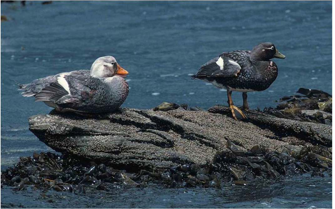
11 Falkland Steamer Duck / Falklandbooteend Tachyeres brachypterus , Kidney Island, Falkland Islands, January 1991 (René Pop) 12 Black-browed Albatrosses / Wenkbrauwalbatrossen Diomedea (melanophris) melanophris , New Island, Falkland Islands, January 1991 (René Pop) 13 Turkey Vultures / Roodkopgieren Cathartes aura falklandicus , New Island, Falkland Islands, December 1990 (René Pop)