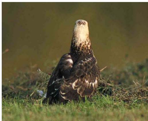
Mystery photograph I (September)