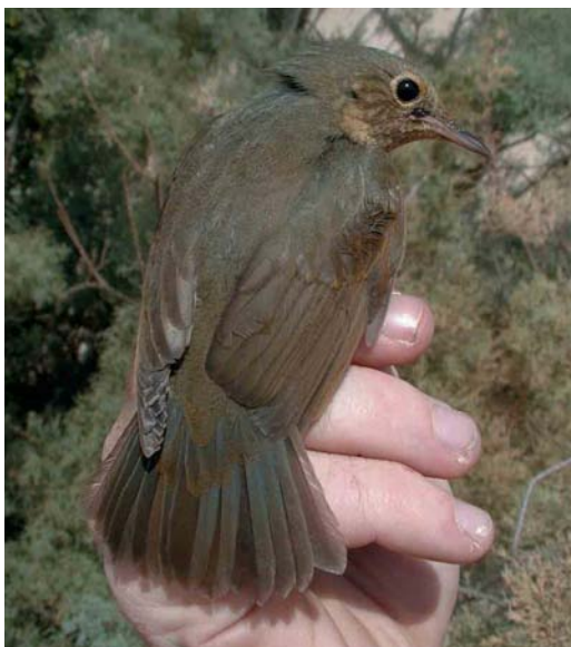
65 Siberian Blue Robin / Blauwe Nachtegaal Luscinia cyane , first-year female, Ebro delta, Catalunya, Spain, 18 October 2000 cf Dutch Birding 22: 299, 2000

Leaf Warbler P. humei for Norway this autumn (and the seventh ever) turned up at Nærland, Rogaland, on 5-6 November and the fifth at Mølen, Vestfold, on 11-12 November. The ninth (and the first of the autumn) for Denmark at Ribe, Vestjylland, on 15 October was also the earliest ever. On 7-11 November, an influx of seven occurred in eastern Britain; one was at Portland Bill on 4 December. Two were seen in Sweden in November. In Israel, one was territorial at the Eilat cemetery on 10 November. The only one in the Netherlands was found at Oosterscheldekering, Zeeland, on 10 November. During early January, a Dusky Warbler P. fuscatus was still present at Grouville, Jersey, Channel Islands.