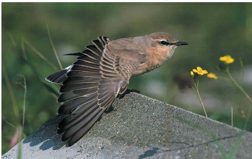
70 Izabeltapuit / Isabelline Wheatear Oenanthe isabellina , eerstejaars, IJmuiden, Noord-Holland, 23 september 2000 cf Dutch Birding 22: 311, 2000