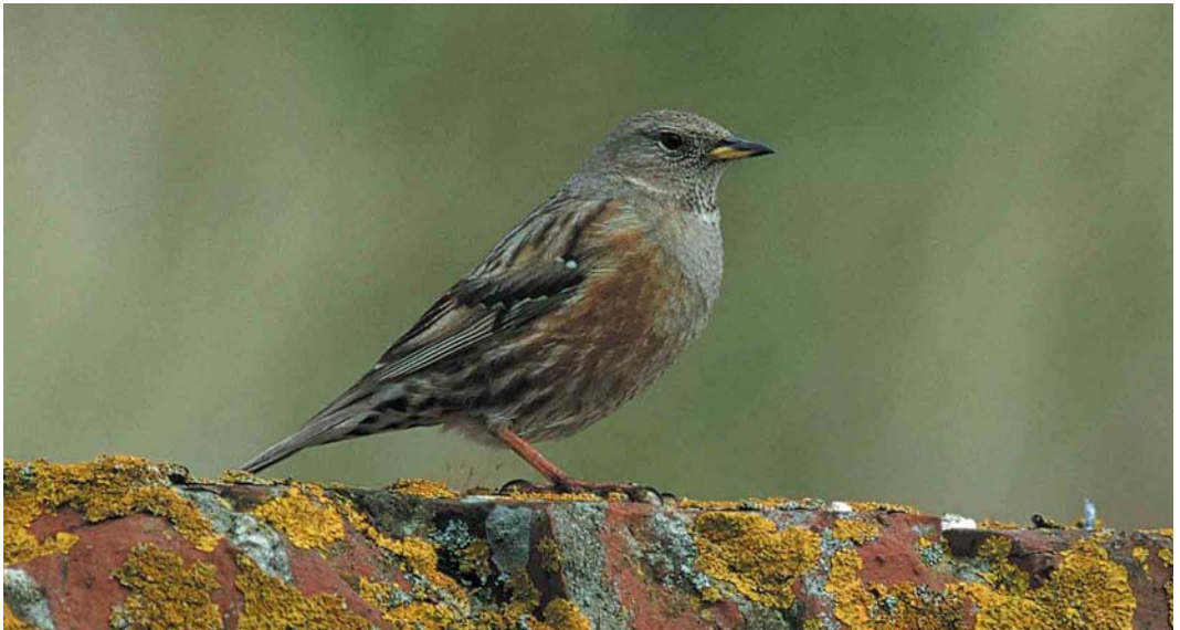
3 Alpenheggenmus / Alpine Accentor Prunella collaris , eerste-zomer, Formerum aan Zee, Terschelling, Friesland, 4 mei 2000

De determinatie van de vogel van Terschelling leverde – na aanvankelijke problemen door de slechte waarnemingsomstandigheden – eveneens geen problemen op. Ook hier sluiten formaat, roodbruine flanken, lichte gevlekte keel, gele snavelbasis en vluchtroep andere soorten uit. Uit het feit de vogel soms zong, zou kunnen worden