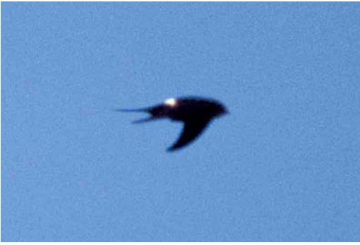
76 White-rumped Swift / Kaffergierzwaluw Apus caffer , eastern Algarve, Portugal, 7 July 2000 (Ray Tipper)