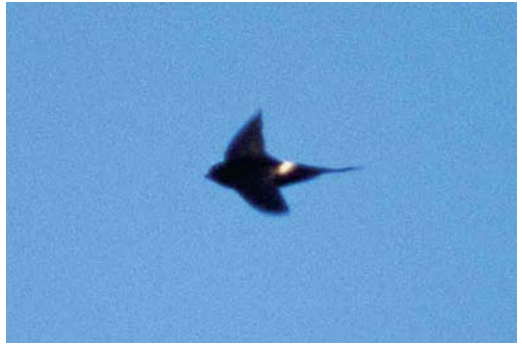
77 White-rumped Swift / Kaffergierzwaluw Apus caffer , eastern Algarve, Portugal, 14 July 1999

remaining inside and lining the entrance with feathers to hinder entry (del Hoyo et al 1999, Chantler & Driessens 2000). Mark Bolton and others visited the site on 21 August and caught sight of a well-grown chick and heard vocalizations from inside the nest whenever an adult approached and briefly visited the nest. KS and KP again visited the site on 7 September and found that the body of the nest had been punctured from below in two places but the entrance was not damaged. A nearby Red-rumped Swallow's nest had suffered similar damage. The presence of two fresh sardine cans, a wine bottle and a cut stem of Giant Reed Arundo donax that had not been there on 16 July strongly suggested vandalism.