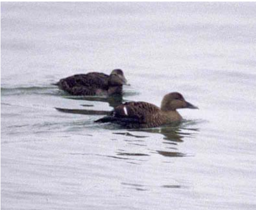
71-72 Raadseleider / mystery eider Somateria , adult vrouwkje, en Eider / Common Eider Somateria mollissima , eerste-winter, IJmuiden, Noord-Holland, 20 januari 1987 (Erik Weijgertse)

De snavelbevedering (het korte culmen en de ronde teugelbegrenzing) sluit Amerikaanse ('Atlantic') Eider S m dresseri en Hudsonbaai-eider ('Hudson Bay') S m sedentaria uit (namen tussen haakjes zijn de geografische aanduidingen in Sibley 2000). De ronde begrenzing van de teugelbevedering zou wel kunnen passen op Pacificse ('West Arctic') Eider S m v-nigra die geïsoleerd van andere ondersoorten broedt in een gebied van Noordoost-Siberië oost tot Victoria Island en Kent Peninsula in Mackenzie Territory in Noordwest-Canada en overwintert in de Beringzee (Ogilvie & Young 1998). De precieze vorm van het culmen is op de foto's moeilijk te zien maar lijkt kort genoeg om zowel op Pacificse als op Noordelijke ('East Arctic') Eider S m borealis te kunnen passen (Noordelijke broedt in het arctische deel van het Atlantische gebied). Van een Noordelijke zou men echter een iets minder ronde teugelbegrenzing dan de IJmuidense vogel verwachten. Faerøereider S m faeroeensis verschilt weinig van Europese nominaat en wordt vaak als synoniem beschouwd (cf British Ornithologists' Union 1992). Tenslotte