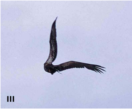
Mystery photograph III (June)