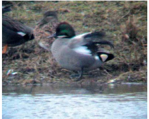
99 Zwarte Ibis / Glossy Ibis Plegadis falcinellus , adult, Petten, Noord-Holland, 27 januari 2002 100 Witstuitbarmsijs / Arctic Redpoll Carduelis hornemanni , Zuid-Eierland, Texel, Noord-Holland, 10 januari 2002 101 Witoogeed / Ferruginous Duck Aythya nyroca , Rotterdam, Zuid-Holland, 26 januari 2002 102 Bronskopeend / Falcated Duck Mareca falcata , mannetje, Asselt, Limburg, 10 februari 2002

gen (op 9 februari twee), en op 6 februari in Hellevoetsluis, Zuid-Holland. In totaal werden 15 Grote Burgemeesters L hyperboreus doorgegeven, met in Den Helder in januari twee adulte en in IJmuiden tussen 12 januari en 24 februari drie verschillende. In totaal werden 20 Kleine Alken Alle alle gemeld, waarvan 12 op 2 februari langs Breskens, Zeeland.