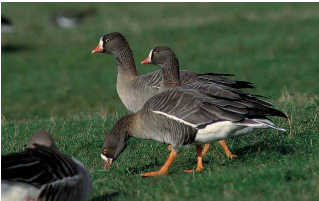
98 Dwergganzen / Lesser White-fronted Geese Anser erythropus , Camperduin, Noord-Holland, 20 februari 2002