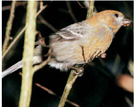
78 Pine Grosbeak / Haakbek Pinicola enucleator , adult male, Melissant, Zuid-Holland, Netherlands, 24 March 1996 79 Pine Grosbeak / Haakbek Pinicola enucleator , Tampere, Finland, February 1984 80-81 Pine Grosbeak / Haakbek Pinicola enucleator , first-year male, Nymölla, Skåne, Sweden, December 2000

bird) but, after reconsideration by the CDNA, the bird was still regarded as an escape (see editorial comment in Schaftenaar 1999).