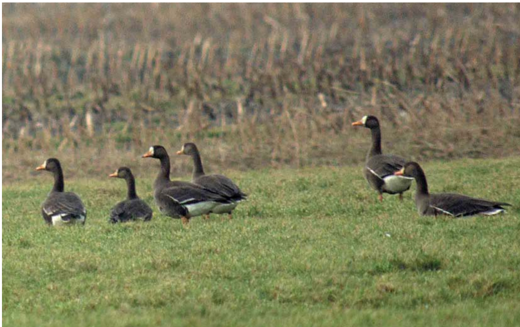
97 Groenlandse Kolganzen / Greenland White-fronted Geese Anser albifrons flavirostris , Burgervlotbrug, Noord-Holland, 16 januari 2002