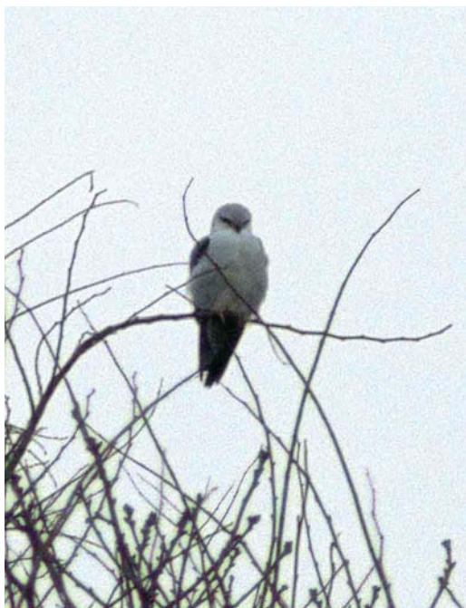
64 Grijze Wouw / Black-winged Kite Elanus caeruleus , Eierlandse Duinen, Texel, Noord-Holland, 29 maart 1998

middaguur werd hij uit het oog verloren; waarschijnlijk was hij langzaam in zuidelijke richting afgezakt. In totaal hebben ruim 200 vogelaars de Grijze Wouw kunnen bekijken. De ontdekking van de vogel gebeurde in een periode met zuidenwind en opvallend milde temperaturen en viel samen met de eerste waarneming van deze soort voor Denemarken bij Skagen, Nordjylland, op exact dezelfde datum (Witte 1998).