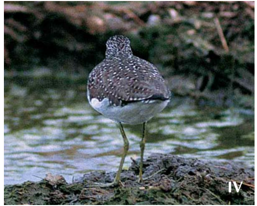
Mystery photograph IV (May)

the tibia feathering is pale yellowish. In both species of bonelli's, the tibia feathering is more whitish. In addition, wing-coverts and remiges, especially the secondaries, are edged bright greenish in both bonelli's warblers. In the mystery bird, the wing-coverts are uniform greyish-green and the edges of the remiges are pale yellowish and not so brightly coloured. So, we are left with Willow Warbler. The greenish-tinged upperparts, diffusely pale-edged tertials, yellowish-edged flight-feathers and the long primary projection, roughly equivalent to the visible tertial length, all fit only Willow.