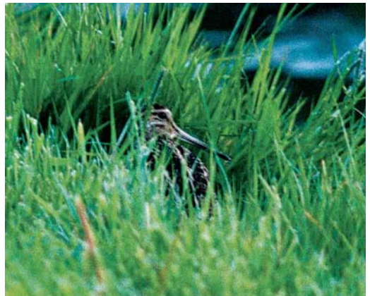
217 Witstaartkievit / White-tailed Lapwing Vanellus leucurus , Nieuwendijk, Hoekse Waard, Zuid-Holland, 4 juli 2002 218 Vorkstaartplevier / Collared Pratincole Glareola pratincola , Bandpolder, Friesland, mei 2002 219 Poelsnip / Great Snipe Gallinago media , Maassluis, Zuid-Holland, 16 mei 2002 220 Poelsnip / Great Snipe Gallinago media , Maassluis, Zuid-Holland, 16 mei 2002

is een Amerikaanse Goudplevier Pluvialis dominica in zomerkleed die op 4 en 5 juli verbleef in de Vlietpolder bij Wissenkerke, Zeeland. Op 19 juni werd een Witstaartkievit Vanellus leucurus waargenomen bij Gouderak, Zuid-Holland; waarschijnlijk dezelfde vogel pleisterde op 4 juli bij Nieuwendijk, Zuid-Holland, en op 5 juli kortstondig in het Stinkgat op Tholen, Zeeland. Sinds 1998 is deze soort elk jaar gezien in Nederland. Gestreepte Strandlopers Calidris melanotos verbleven op 16 mei in de Prunjepolder, op 18 mei in de Ezumakeeg, op 19 en 20 mei bij Beusichem, op 28 mei bij Heerhugowaard, Noord-Holland en op 29 en 30 juni alweer in de Ezumakeeg. Breedbekstrandlopers Limicola falcinellus waren zoals gewoonlijk erg schaars met exemplaren op 20 mei in de Lettelerpetten, op 26 en 27 mei bij Termunten, Groningen, en op 31 mei en 1 juni in de Ezumakeeg. Goede vondsten waren de