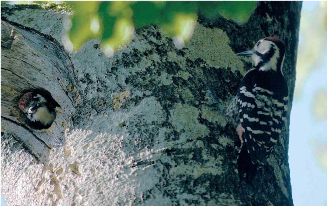
205 Lilford's Woodpecker / Lilfords Witrugspecht Dendrocopos leucotos lilfordi , male and juvenile, Col de Urquiaga, Navarra, Spain, 14 June 2002

was watched for only five minutes at Gibraltar Point, Lincolnshire, in late June. In the north of the Netherlands, three pairs of European Bee-eaters Merops apiaster raised young at Lauwersmeer, Groningen (last year, the species also attempted to breed in Groningen). A breeding attempt in Noordhollands Duinreservaat, Noord-Holland, failed. The third breeding for Britain and the first since 1955 attracted many birders at Bishop Middleham Quarry, Durham, from 2 June onwards. As in previous years, several bred in Vlaanderen, Belgium (at Wachtebeke, Oost-Vlaanderen). The sound recorded in February 2002 in Pearl River WMA, south-eastern Louisiana, USA, and identified as possibly originating from a tapping Ivory-billed Woodpecker Campyphilus principalis , has also been recorded by several automatic sound-recording units (ARUs) from the Cornell Laboratory of Ornithology. Based on the sound spectrum and distance between several ARUs that recorded the sound, the Cornell lab concludes the sound to be distant gunshots with reverberations sounding to human ears like drumming on a hollow snag. This conclusion is tempering hopes of the species' survival (cf Dutch Birding 24: 57, 112, 2002; www.zeiss.com). On 14-15 June, young Lilford's Woodpeckers Dendrocopos leucotos lilfordi were photographed when leaving their nest at Col de Urquiaga just across the French border in Navarra, Spain (for information on the population on the French side of the Pyrenees, see Ornithos 8: 8-17, 2001).