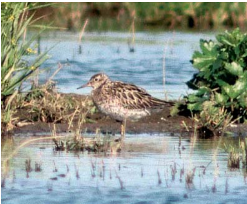
170-171 Siberische Strandloper / Sharp-tailed Sandpiper Calidris acuminata , adult, Ezumakeeg, Lauwersmeer, Friesland, 9 augustus 1998

GEDRAG Eerste dagen langzaam en schokkerig foeragerend met voorovergebogen houding, soms met doorgezakte poten, herinnerend aan Bokje Lymnocyrtus minimus . Op 9 augustus langdurig stilstaand tussen vegetatie. Tegen einde van waarnemingsperiode duidelijk actiever. Doorgaans solitair op droge delen foeragerend. Vegetatie inlopend en zich drukkend bij overvliegende roofvogels. Een keer net als tweede exemplaar