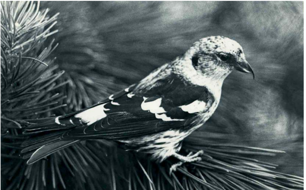
180 White-winged Crossbill / Witvleugelkruisbek Loxia leucoptera leucoptera , in captivity, De Zilk, Noordwijkerhout, Zuid-Holland, 7 October 1963