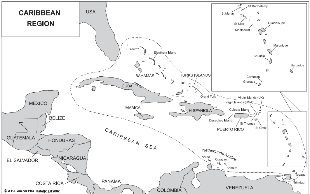
FIGURE 1 Map of Caribbean region with main islands and island groups and individual islands mentioned in the survey of records; bird records in this paper originate from area within dotted line

Curlew Sandpiper, breed in the easternmost regions of the Palearctic. These species could also reach the Caribbean region 'the other way round', across North America. For all other species listed below, it may be assumed that they have crossed the Atlantic Ocean to reach the Caribbean (including the possibility of ship-assisted passage). This conclusion is supported by the fact that a large number of records come from Barbados, the easternmost island of the Lesser Antilles; Bull (1978) reached the same conclusion but based on a much smaller number of (then known) records. Introduced species from Palearctic origin (for instance, Eurasian Collared Dove Streptopelia decaocto (possibly 'self-introduced' by ship-assisted arrivals), Common Starling Sturnus vulgaris and House Sparrow Passer domesticus ) are not included in the list. For information on the spread of Eurasian Collared Dove in the Caribbean region, see, for instance, Garrido & Kirkconnell (1990), Smith (1995), Francis (1996), Barré et al (1997) and Pitiré 9 (3): 2-4.