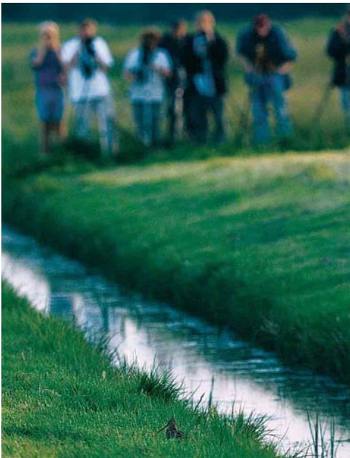
212 Poelsnip / Great Snipe Gallinago media , Maassluis, Zuid-Holland, 16 mei 2002 (Vincent van der Spek)