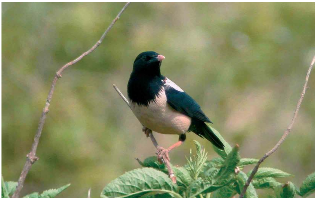
207 Rose-coloured Starling / Roze Spreeuw Sturnus roseus , Texel, Noord-Holland, Netherlands, 3 June 2002