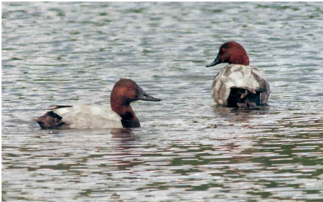
194 Canvasback / Grote Tafeleend Aythya valisineria , male (left), with Common Pochard / Tafeleend A ferina , male, Pennington Flash, Greater Manchester, Lancashire, England, 11 July 2002