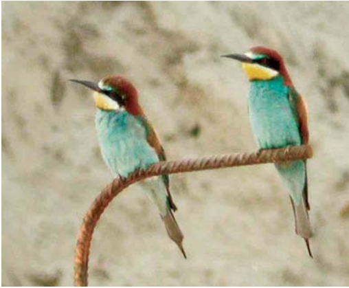
226 Bijeneters / European Bee-eaters Merops apiaster , Wachtebeke, Oost-Vlaanderen, 4 juni 2002