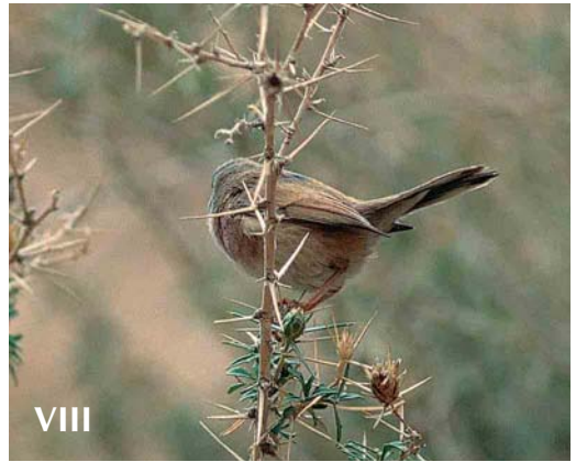
Mystery photograph VIII (April)

Entries for the second round have to arrive by 10 September 2002 . From those entrants having identified both mystery birds correctly, two persons will be drawn who will receive a copy of the video Dutch Birding video-jaaroverzicht 2001 ,