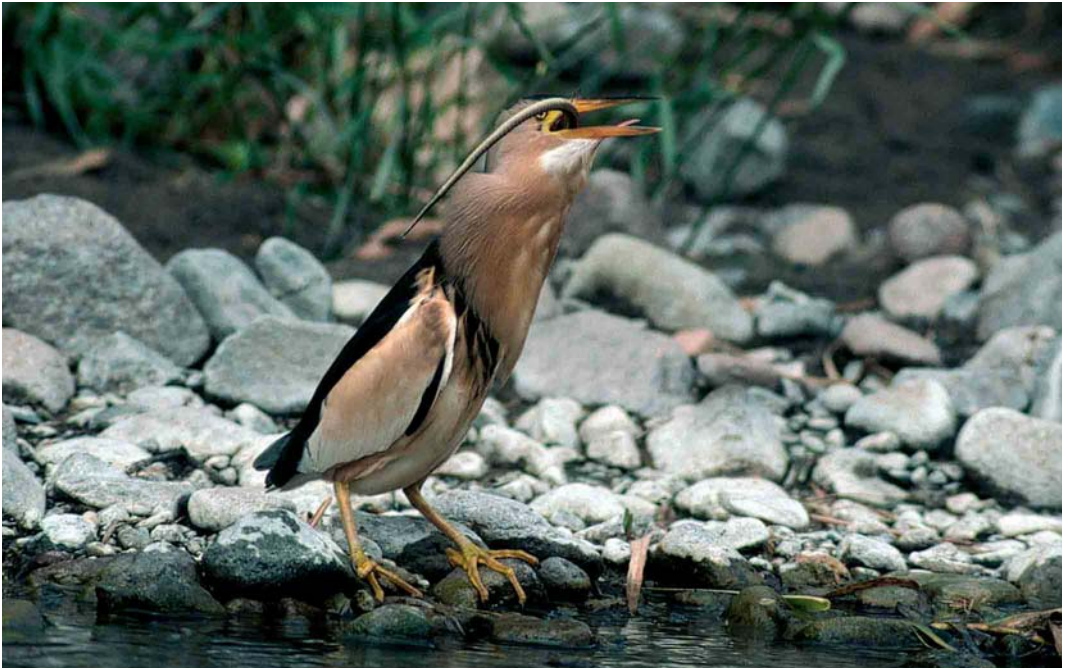
185 Little Bittern / Woudaap Ixobrychus minutus , with Balkan Green Lizard Lacerta trilineata , near Sigri, Lesvos, Greece, 3 May 2000

home, based on the slides, our initial identification turned out to be correct: an immature Balkan Green Lizard of the nominate subspecies L t trilineata . It was estimated to be about nine months old (A Troidl in litt). Assuming an average length of 50 mm for both the bill and tarsus of the Little Bittern (Voisin 1991), we could estimate the size of the lizard. The head plus body length was estimated to be 110 mm, and including the tail, the total length was estimated to be 285 mm. These measurements, and the ratio of head plus body compared with tail length, fit well within those given for its age (Böhme 1984). A head plus body length of 110 mm corresponds with an estimated weight of c 33 g (Böhme 1984).