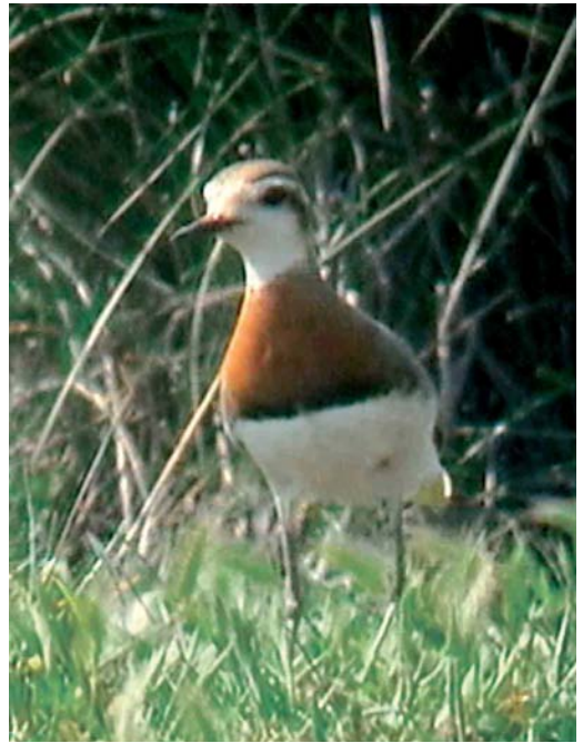
196 Cattle Egret / Koereiger Bubulcus ibis , Ahvenanmaa, Finland, 17 May 2002 197 Caspian Plover / Kaspische Plevier Charadrius asiaticus , male, Kalloni salt pans, Lesvos, Greece, May 2002 198 Lesser Sand Plover / Mongoolse Plevier Charadrius mongolus (left), with Common Ringed Plover / Bontbekplevier C. hiaticula , Rimac, Lincolnshire, England, May 2002 cf Dutch Birding 24: 176-177, 2002