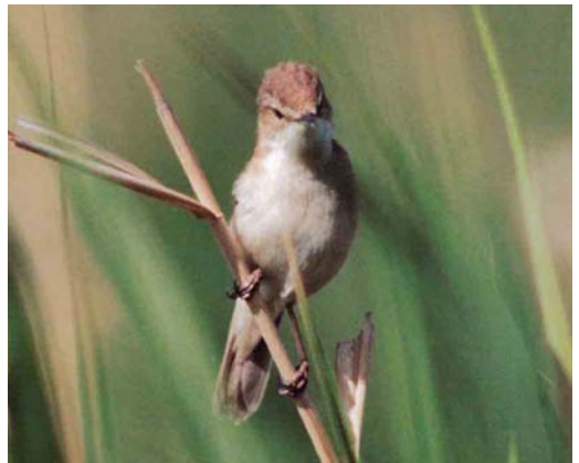
199 Caucasian Grouse / Kaukasisch Korhoen Tetrao mlokosiewiczii , male, Sivrikaya, Turkey, 24 May 2002 (Roy Slaterus) 200 White-tailed Lapwing / Witstaartkievit Vanellus leucurus , Nieuwendijk, Zuid-Holland, Netherlands, 4 July 2002 (Willem van Rijswijk) 201 Least Sandpiper / Kleinste Strandloper Calidris minutilla , Drayton Bassett, Staffordshire, England, May 2002 (Steve Young/Birdwatch) cf Dutch Birding 24: 176, 2002 202 Spotted Sandpiper / Amerikaanse Oeverloper Actitis macularia , adult summer, Derwent reservoir, Durham, England, June 2002 (Steve Young/Birdwatch) 203 Asian Desert Warbler / Aziatische Woestijngrasmus Sylvia nana , Düne, Helgoland, Schleswig-Holstein, Germany, May 2002 (Frank Sudendey) 204 Paddyfield Warbler / Veldrietzanger Acrocephalus agricola , Van Gölü, Turkey, 3 June 2002 (Roy Slaterus)