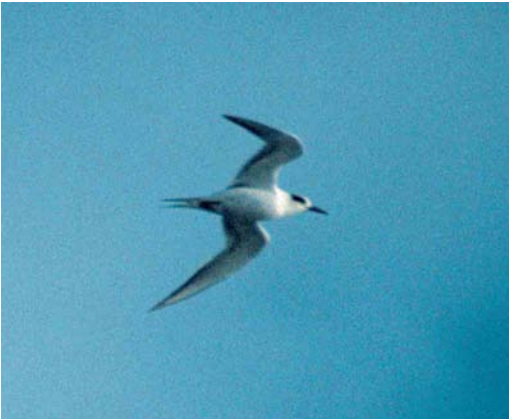
181 Forsters Stern / Forster's Tern Sterna forsteri , adult-winter, Boschplaat, Terschelling, Friesland, 14 november 1999 (Han Zevenhuizen)