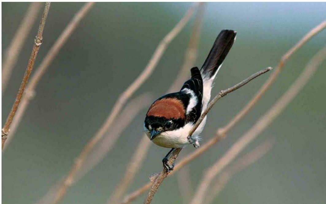
206 Woodchat Shrike / Roodkopklauwier Lanius senator , Helgoland, Schleswig-Holstein, Germany, 20 May 2002 (Jan Bisschop)