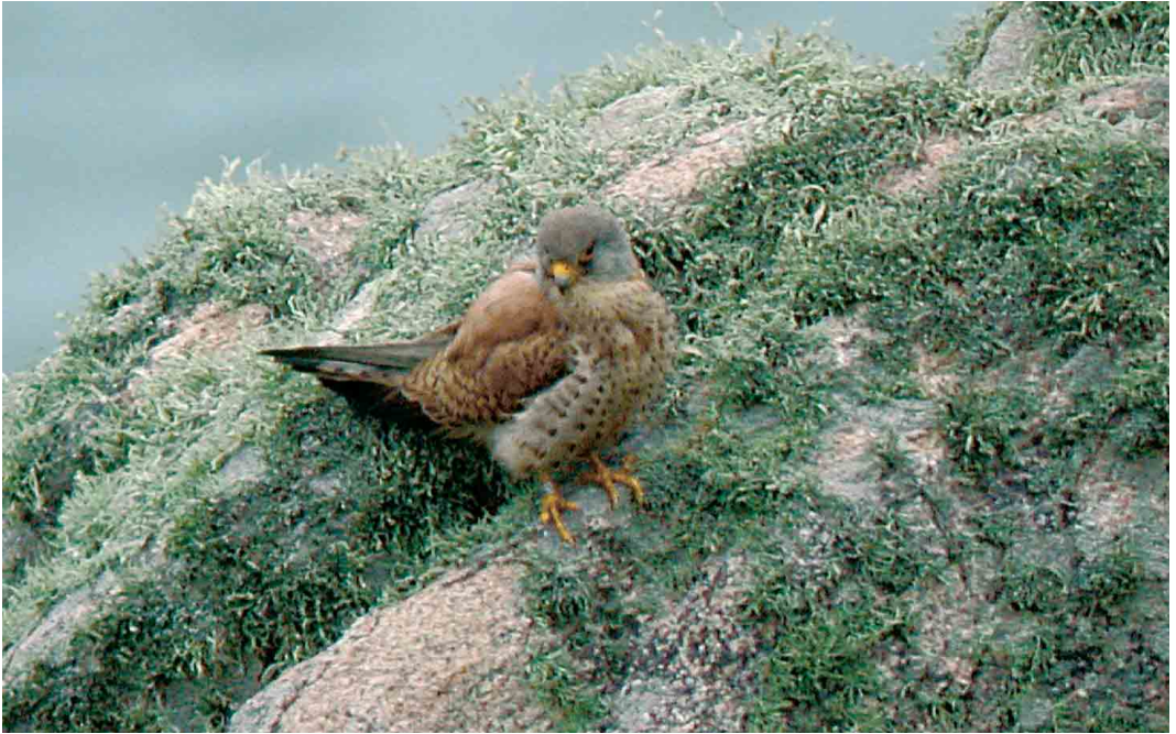
193 Lesser Kestrel / Kleine Torenvalk Falco naumanni , first-summer male, St Mary's, Scilly, England, May 2002 (Marcus Lawson)

Bald Ibis Geronticus eremita has been discovered in an Al Badia (desertic steppe) area in central Syria. The colony contained three pairs incubating eggs and a seventh adult. This is the first evidence of the continued breeding of the species in the Middle East since a colony at Birecik, Turkey, became extinct in 1989 (a semi-captive group of 42 adults kept at Birecik raised 19 young in 2001) (cf Dutch Birding 11: 128-131, 1989). Since 1989, there have been sightings in Saudi Arabia and Eritrea, suggesting the existence of an undiscovered breeding population somewhere in the region. The discovery was made within the framework of a FAO project funded by the Italian government. Previously, the species' world population was put at 220 individuals confined to two colonies in the Agadir area in south-western Morocco.