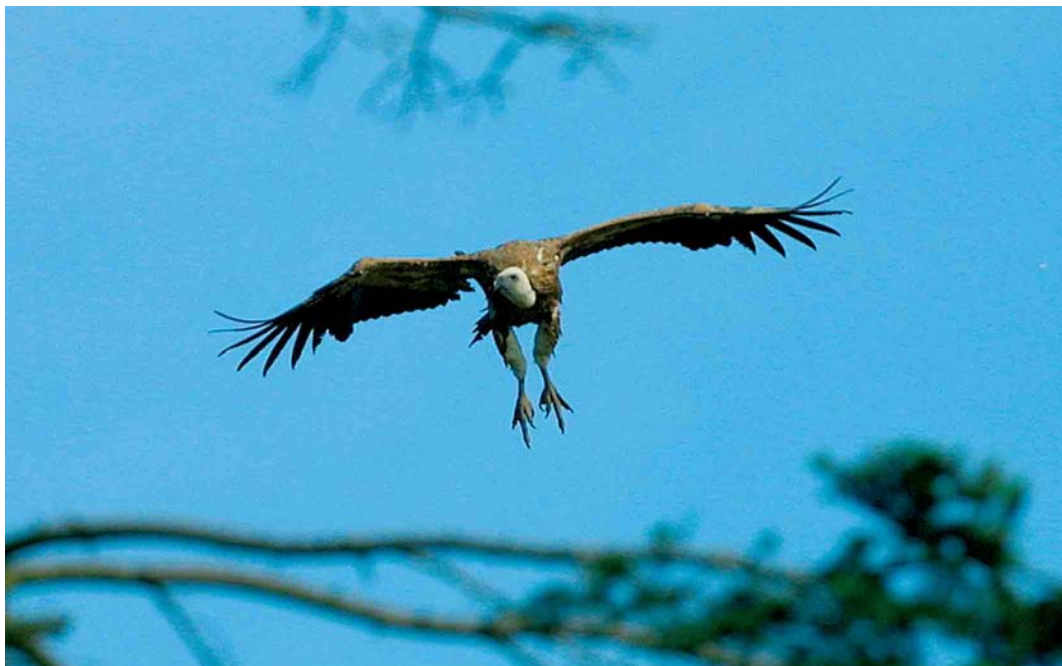
192 Eurasian Griffon Vulture / Vale Gier Gyps fulvus , Nokere, Oost-Vlaanderen, Belgium, 8 June 2002 (Ivan Steenkiste)