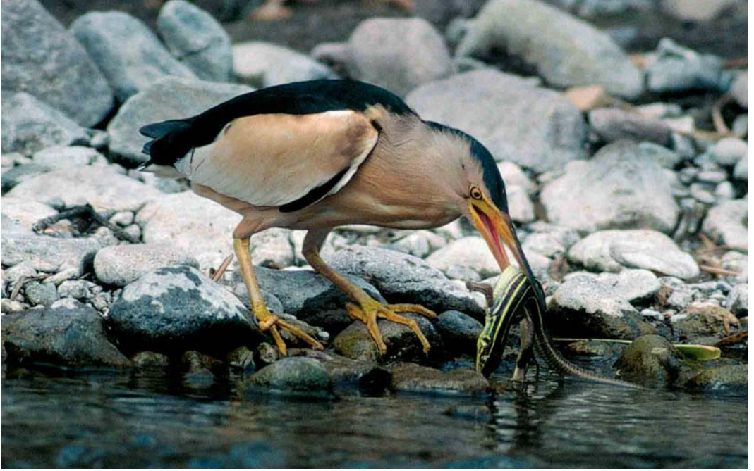
183-184 Little Bittern / Woudaap Ixobrychus minutus , with Balkan Green Lizard Lacerta trilineata , near Sigrí, Lesvos, Greece, 3 May 2000 (Peter de Knijff)