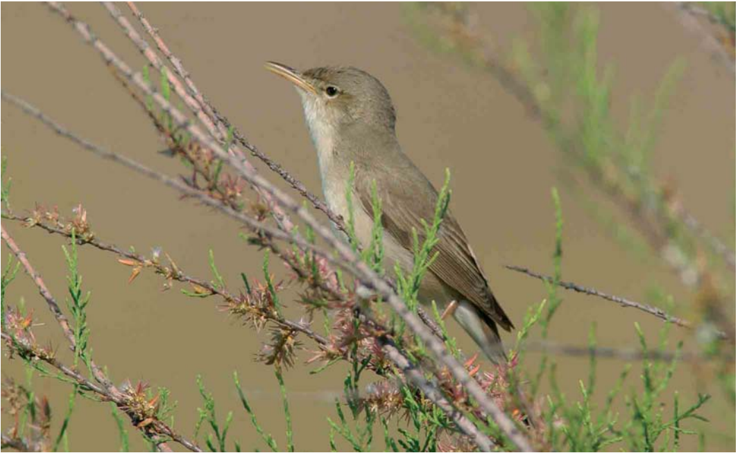
187 Eastern Olivaceous Warbler / Oostelijke Vale Spotvogel Acrocephalus pallidus , Lesvos, Greece, 7 May 2002. Note long straight bill with down-curved tip and all-pale lower mandible, pale secondary tips forming pale secondary bar and hint of pale secondary panel 188 Caspian Reed Warbler / Kaspische Karekiet Acrocephalus fuscus , Jubail, Saudi Arabia, 16 April 1991. Caspian Reed can look strikingly similar to Eastern Olivaceous Warbler A pallidus . Note lack of pale secondary panel, long primary projection and absence of prominent pale tips on secondaries