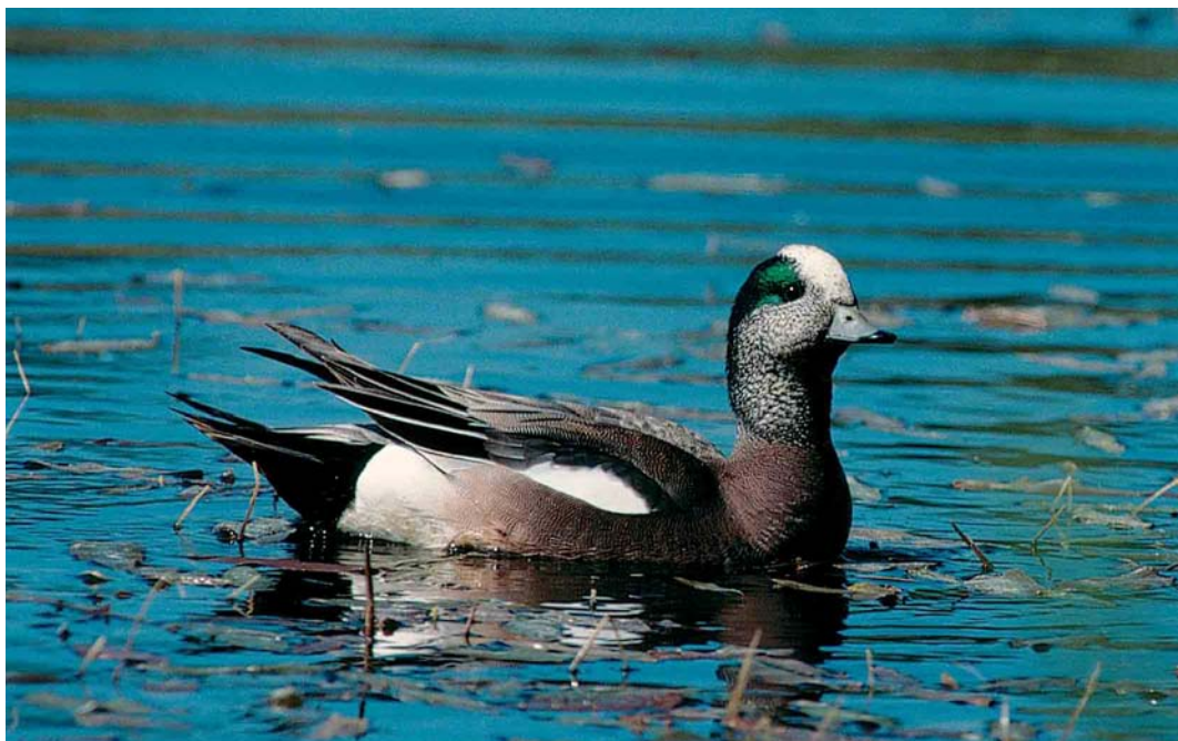
195 American Wigeon / Amerikaanse Smient Mareca americana , male, Turenki, Finland, 22 May 2002