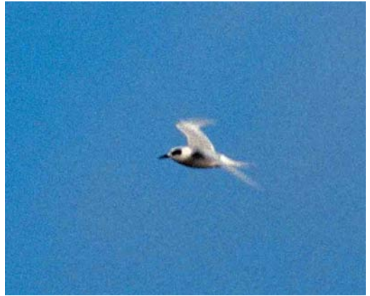
182 Forsters Stern / Forster's Tern Sterna forsteri , adult-winter, Boschplaat, Terschelling, Friesland, 14 november 1999

succesvolle actie toenam. Rond 10:00 kwamen c 25 vogelaars aan in West-Terschelling. Per taxi ging de groep naar Oosterend. Daarvandaan startte de door de venijnige oostenwind en het deels onverharde fietspad barre fietstocht van c 15 km naar de oostpunt van het eiland. De eersten arriveerden hier om c 12:00. Ondertussen was de vogel al enige tijd uit beeld... De inspanning werd echter beloond toen de stern om 13:10 tevoorschijn kwam. Gedurende c 45 min liet de vogel zich op wisselende afstand zien, langzaam afdwalend richting Ameland, Friesland. Drie vogelaars die met de snelboot van 11:30 waren overgestoken waren om c 14:00 nog net op tijd om de vogel voor de kust van Ameland te zien. Daarna is de vogel niet meer aangetroffen.