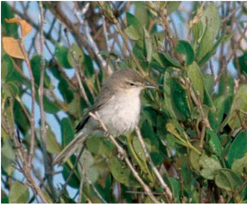
189 Sykes's Warbler / Sykes' Spotvogel Acrocephalus rama , Khor Livva, Oman, 9 March 2001. Sykes's Warbler is very similar to Eastern Olivaceous Warbler A pallidus . Note rather long bill and head pattern with rather long supercilium without obvious dark upper edge