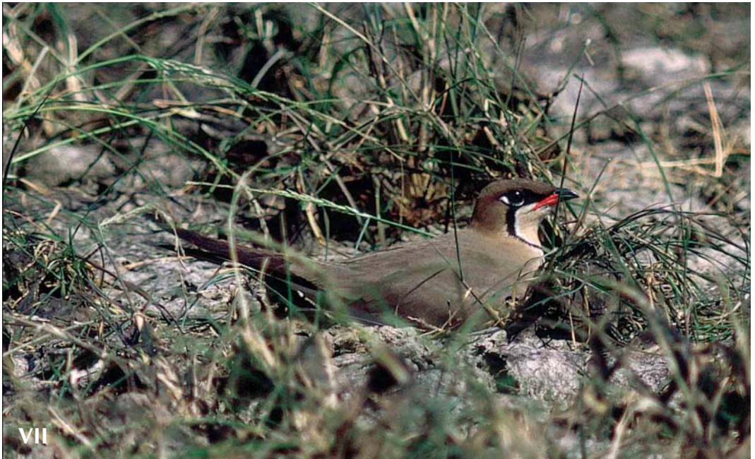
Mystery photograph VII (April)