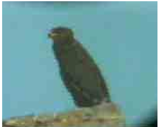
178 Lesser Spotted Eagle / Schreeuwarend Aquila pomarina , Vendicari NR, Sicily, Italy, 31 December 2000 (Andrea Corso & Carlo Nardini)

The very similar Greater Spotted Eagle A clanga could be excluded by the following characters (cf Forsman 1999, Clark 1999; Andrea Corso pers obs). The iris was yellowish with an easily discernible pupil; in Greater Spotted, it is always darker, ie, dark brown-amber or blackish-grey (Andrea Corso pers obs). The bill was small and not very high (very kite Milvus -like); in Greater Spotted, it is usually higher, bigger and heavier looking. The upper- and underwing showed an obvious contrast between the paler brownish coverts and the much darker blackish remiges; in Greater Spotted, the upperwing appears uniform (or even shows the reverse pattern, more or less the same contrast can be found in the palest Lesser Spotted Eagle). The pale spots on the upperwing were small and inconspicuous; in juvenile Greater Spotted, these spots are normally much more dense, obvious and extended. The bird showed a well-visible and conspicuous golden nape patch; this is absent in most Greater Spotted or, if visible, not so conspicuous and wide (normally it is also situated more at the rear-crown than on the nape). The base to the