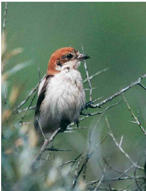
214 Roze Spreeuwen / Rose-coloured Starlings Sturnus roseus , adult (boven) en eerste-zomer, De Cocksdorp, Texel, Noord-Holland, 3 juni 2002 (Marten van Dijl) 215 Roodkopklauwier / Woodchat Shrike Lanius senator , vrouwtje, Katwijk, Zuid-Holland, 29 juni 2002 (Jan den Hertog) 216 Roze Spreeuw / Rose-coloured Starling Sturnus roseus , adult, met Spreeuwen / Common Starlings S vulgaris , Katwijk, Zuid-Holland, 5 juni 2002 (René van Rossum)