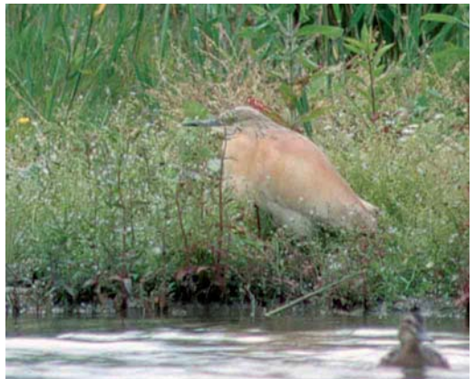
221 Orpheusspottvogel / Melodious Warbler Hippolais polyglotta , Tongerlo, Limburg, 8 juni 2002 (Marten van Dijf) 222 Kortteenleeuwerik / Greater Short-toed Lark Calandrella brachydactyla , Ackerdijk, Delft, Zuid-Holland, 23 mei 2002 (Ellen Sandberg) 223 Kleine Topper / Lesser Scaup Aythya affinis , mannetje, Hoogkerk, Groningen, Groningen, 25 mei 2002 (Eric Koops) 224 Ralreiger / Squacco Heron Ardeola ralloides , adult, Kardingse, Groningen, Groningen, 26 juni 2002 (Eric Koops)

Friesland. Grauwe Franjepoten Phalaropus lobatus werden opgemerkt op 12 en 18 mei in de Bandpolder, op 19 mei in de Ezumakeeg, op 31 mei in de Rammelwaard bij Voorst, Gelderland, en op 5 juni (drie) in De Tjamme bij Beerta, Groningen. De Rosse Franjepoot P fulicaria van Waal en Burg op Texel bleef tot 1 mei, en op 6 juni was er één aanwezig in de Workumerwaard, Friesland. Opmerkelijk was de waarneming van een Middelste Jager Stercorarius pomarinus die op 2 juni meer dan een uur op een prooi zat in de Bovenpolder bij Amerongen, Utrecht. Later vloog de vogel in noordoostelijke richting door. Een adulte Kleinste Jager S longicaudus vloog op 26 mei langs Heemskerk, Noord-Holland. De adulte Lachmeeuw Larus atricilla net over de Duitse grens in het Zwillbrocker Venn, Nordrhein-Westfalen, werd daar in ieder geval tot begin mei gezien. Alvast vermeldens-