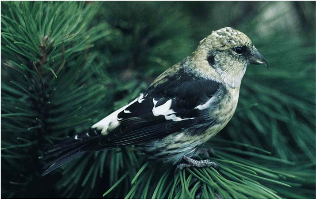
179 White-winged Crossbill / Witvleugelkruisbek Loxia leucoptera leucoptera , in captivity, De Zilk, Noordwijkerhout, Zuid-Holland, 7 October 1963 (Fred J Koning)