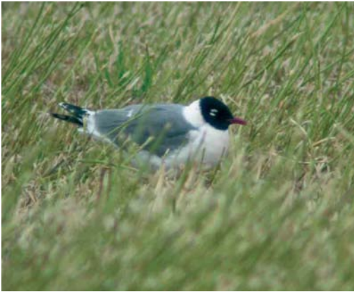
231 Franklins Meeuw / Franklin's Gull Larus pipixcan , Wissenkerke, Zeeland, 5 juli 2002