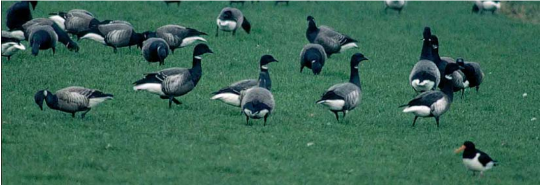
174 Zwarte Rotgans / Black Brant Branta nigricans , adult (rechts), met twee hybriden Rotgans B bernicla x Zwarte Rotgans / hybrids Dark-bellied Brent Goose x Black Brant, eerste-winter (midden en net links van midden), en Rotganzen / Dark-bellied Brent Geese, Terschelling, Friesland, april 2000 (Theo Bakker/Cursorius) 175 Zwarte Rotgans / Black Brant Branta nigricans , adult (links van midden), met twee hybriden Rotgans B bernicla x Zwarte Rotgans / hybrids Dark-bellied Brent Goose x Black Brant, eerste-winter (rechts van midden), en Rotganzen / Dark-bellied Brent Geese, Terschelling, Friesland, april 2000 (Theo Bakker/Cursorius)

In het voorjaar van 2000 bevond zich een recordaantal van minimaal vijf Zwarte Rotganzen op Terschelling (Dutch Birding 22: 122, 2000). Op 8 april 2000 stelde Theo Bakker vast dat één van deze vogels gepaard was met een Rotgans B bernicla en vergezeld werd door twee hybride jongen in eerste-winterkleed; deze vogels werden gezien tot 2 mei. Op plaat 174-175 is de adulte Zwarte Rotgans gemakkelijk te herkennen aan de donkere bovendelen, donker bruinzwarte borst bijna zonder contrast met de zwarte hals, opvallende witte, driehoekige flankvlek met zwarte schubtekening, en uitgebreide witte halsvlek. De twee hybride jongen vertonen kenmerken die intermediair zijn tussen beide ouders. De borst is iets minder donker dan bij de Zwarte Rotgans en vertoont daardoor iets meer contrast met de zwarte hals. Dit contrast is bij de meeste op de