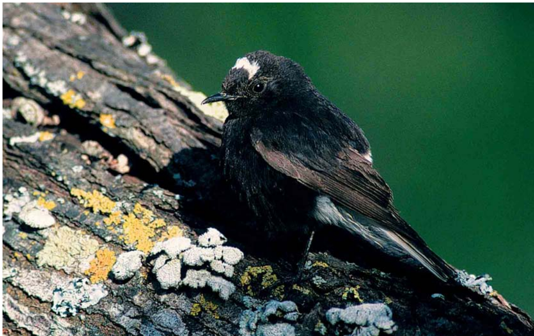
172-173 White-crowned Wheatear / Witkruintapuit Oenanthe leucopyga , probably first-summer, Mexilhoeira Grande, Algarve, Portugal, 25 March 2001 (Ray Tipper)