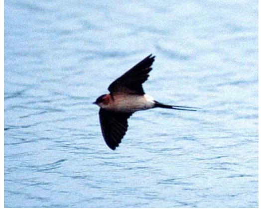
227 Roodstuitzwaluw / Red-rumped Swallow Hirundo daurica , Grand-Leez, Namur, 4 mei 2002

over Genk, Limburg, op 1 mei; over Gent (één) en Wuustwezel, Antwerpen (twee), op 7 mei; over Brecht, Antwerpen, op 8 mei; over Frasnes-lez-Buissenal, Hainaut, op 14 mei; over Escannafles, Hainaut, op 15 mei; over Krulbeke, Oost-Vlaanderen, op 19 mei; twee over Harchies op 20 mei; en over Waasmunster, Oost-Vlaanderen, op 30 mei. In totaal werden 41 Ooievaars Ciconia gezien. Op 25 mei dook de Europese Flamingo Phoenicopterus roseus weer op te Kallo-Melsele.