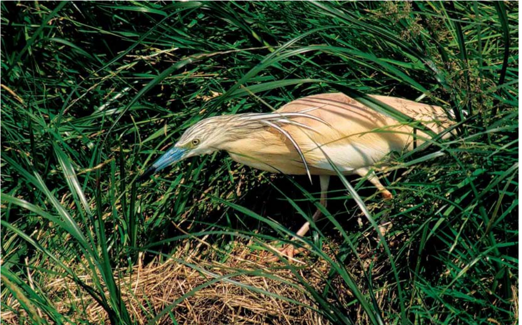
211 Ralreiger / Squacco Heron Ardeola ralloides , adult, Zuid-Schermer, Noord-Holland, 26 juni 2002