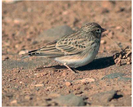
190 Lesser Short-toed Lark / Kleine Kortteenleeuwerik Calandrella rufescens rufescens , Fuerteventura, Canary Islands, 10 August 2000 ( Peter van Rij ). Note dark breast-streaks extending to centre of breast, long primary projection and short thick bill

ceous. The repeated downward tail flicking of Eastern Olivaceous is also a good clue to distinguish this species from Marsh, Blyth's Reed, European Reed and probably also from the sometimes strikingly similar Caspian Reed Warbler (plate 188). An excellent paper on the identification of Western Olivaceous, Eastern Olivaceous, Booted and Sykes's Warbler by Lars Svensson can be found in Birding World 14: 192-219, 2001.