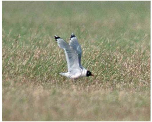
232 Franklins Meeuw / Franklin's Gull Larus pipixcan , Wissenkerke, Zeeland, 5 juli 2002 (Marten van Dijk)

dat ook de bovenzijde veel donkerder was dan bij de aanwezige Goudplevieren. Een haastige autokilometer verder kon de vogel als Amerikaanse Goudplevier P dominica gedetermineerd worden. Ondanks een waarneemafstand van c 150 m was te zien dat de handpennen c 2 cm voorbij de staart reikten terwijl de tertials ten minste 3 cm van de handpennen onbedekt lieten. De vogel was in iets gesleten zomerkleed maar van rui was op enkele onderstaartdekveren na niets te zien. Hij foerageerde tijdens zijn verblijf zeer succesvol en trok in ongeveer een half uur ruim 1.5 m regenworm uit de bodem. Na het middaguur verdween de vogel maar keerde later in de avond terug naar de akker en werd tot in de schemering door enkele 10-tal vogelaars gezien.