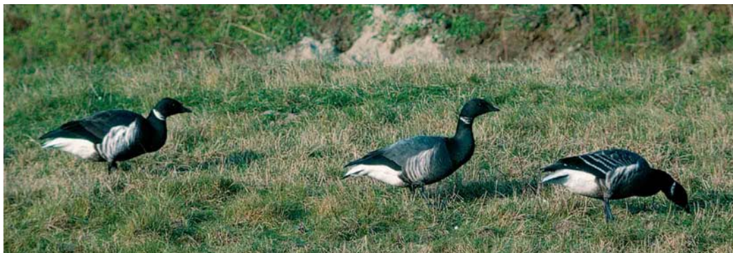
176 Zwarte Rotgans / Black Brant Branta nigricans , adult (links), Rotgans / Dark-bellied Brent Goose B bernicla , adult (midden) en hybride Rotgans x Zwarte Rotgans / hybrid Dark-bellied Brent Goose x Black Brant, eerste-winter (rechts), Grevelingendam, Zeeland, 22 januari 1992 (Arnoud B van den Berg) 177 Zwarte Rotgans / Black Brant Branta nigricans , adult (midden), Rotgans / Dark-bellied Brent Goose B bernicla , adult (links) en twee hybriden Rotgans x Zwarte Rotgans / hybriden Dark-bellied Brent Goose x Black Brant, eerste-winter, Grevelingendam, Zeeland, 22 januari 1992 (Arnoud B van den Berg)

In Engeland zijn sinds 1989 ook enkele gemengde paren met jongen vastgesteld. Van 8 januari tot 18 maart 1989 verbleef een paar met zes hybride jongen bij Thorney Deeps, West