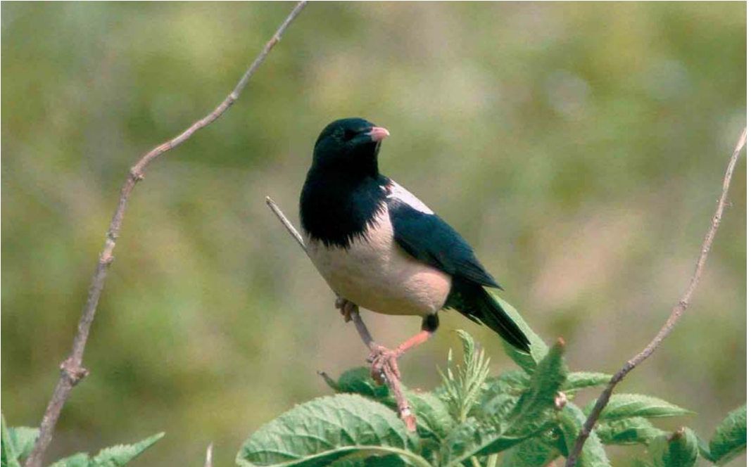
207 Rose-coloured Starling / Roze Spreeuw Sturnus roseus , Texel, Noord-Holland, Netherlands, 3 June 2002