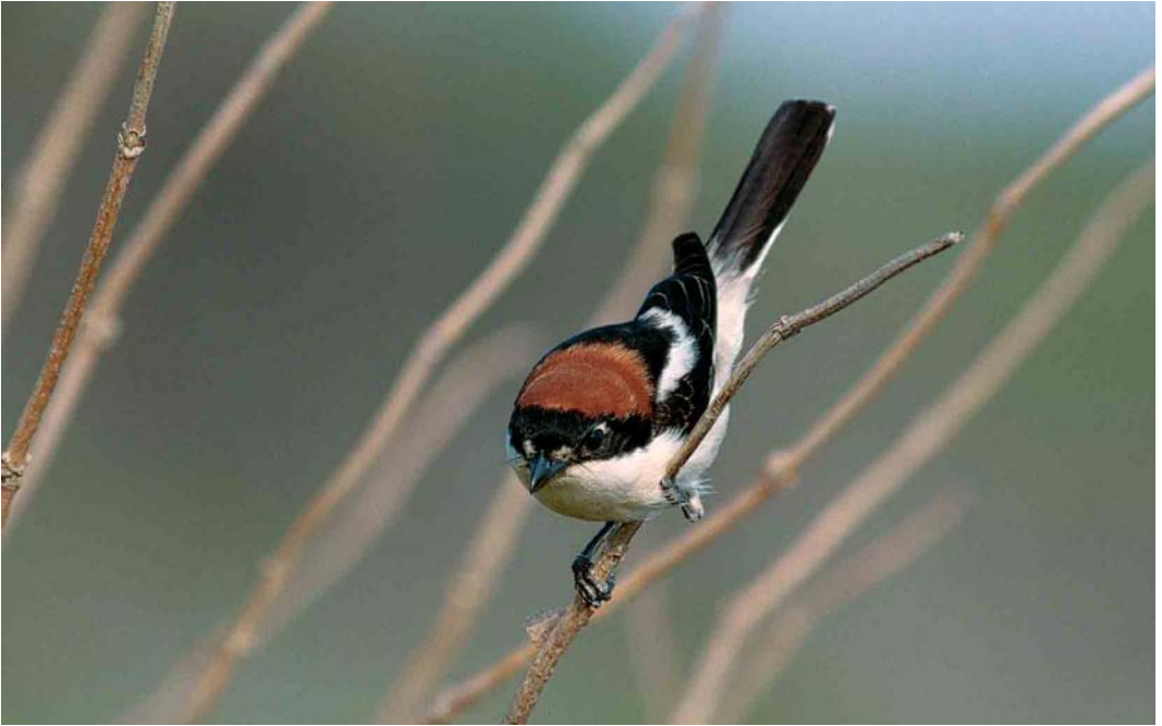
206 Woodchat Shrike / Roodkopklauwier Lanius senator , Helgoland, Schleswig-Holstein, Germany, 20 May 2002 (Jan Bisschop)