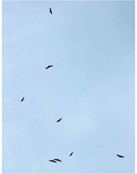
208 Lammergeier / Lammergeier Gypaetus barbatus , onvolwassen, De Cocksdorp, Texel, Noord-Holland, 3 juni 2002 209 Vale Gieren / Eurasian Griffon Vultures Gyps fulvus , Groningen, Groningen, 1 juni 2002 210 Lammergeier / Lammergeier Gypaetus barbatus , onvolwassen, De Cocksdorp, Texel, Noord-Holland, 3 juni 2002