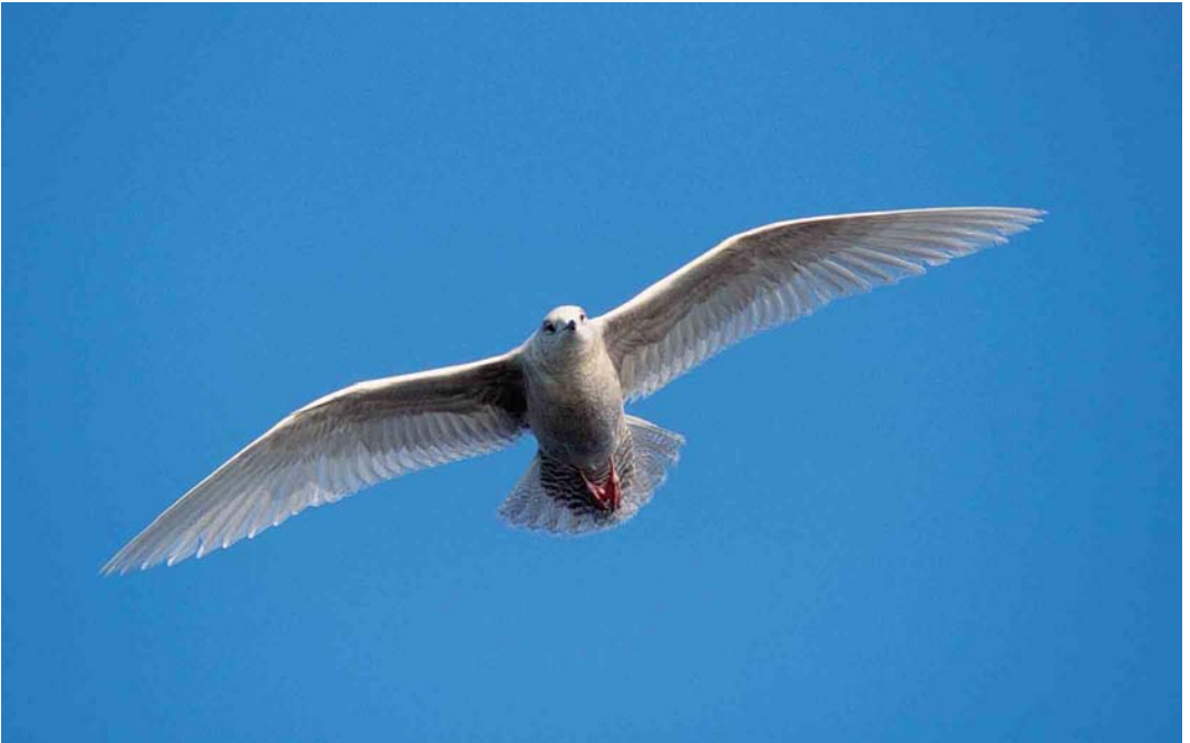
103 Kleine Burgemeester / Iceland Gull Larus glaucooides , eerste-winter, Scheveningen, Zuid-Holland, 17 februari 2002