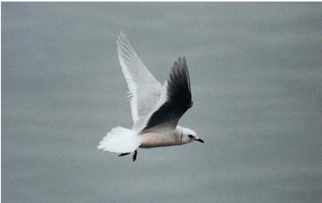
86 Ross's Gull / Ross' Meeuw Rhodostethia rosea , Plym Estuary, Devon, England, March 2002