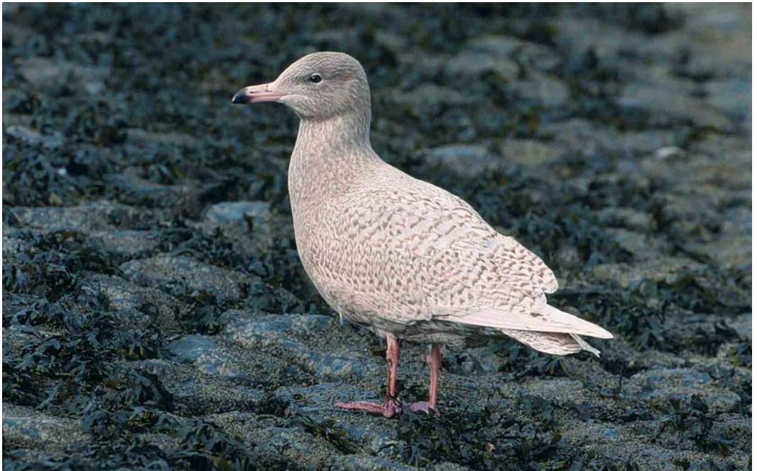
104 Grote Burgemeester / Glaucous Gull Larus hyperboreus , eerste-winter, Scheveningen, Zuid-Holland, 18 februari 2002 (Henk Harmsen)