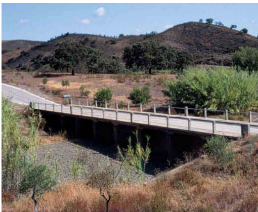
74 Breeding site of White-rumped Swift / Kaffergerzwaluw Apus caffer , eastern Algarve, Portugal, 25 July 1999