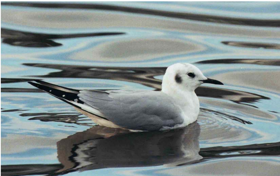
87 Bonaparte's Gull / Kleine Kokmeeuw Larus philadelphia , Millbrook, Cornwall, England, March 2002