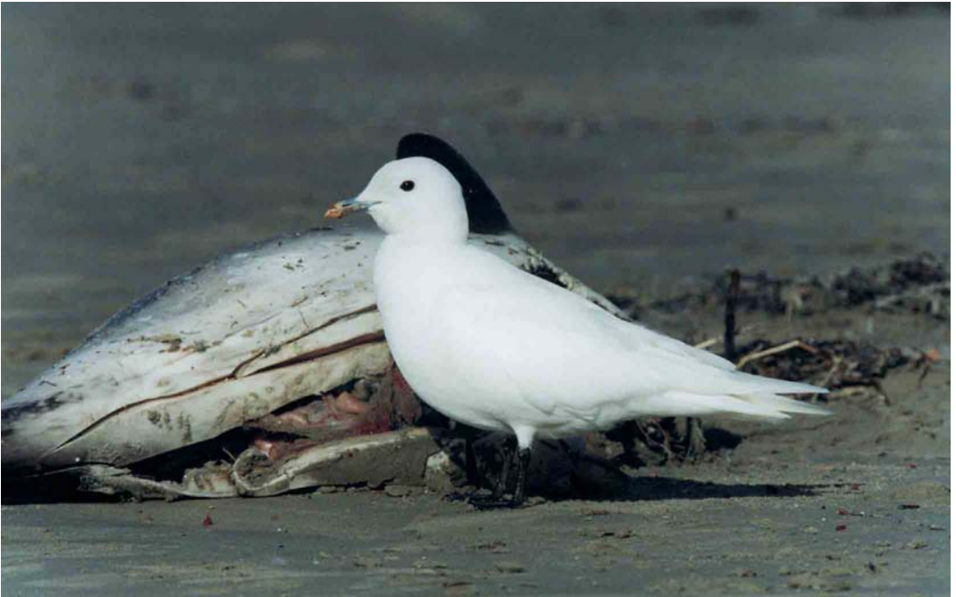
85 Ivory Gull / Ivoormeeuw Pagophila eburnea , adult, Black Rock Sands, Porthmadog, Gwynedd, Wales, 2 February 2002

four first-winters) were discovered at Kloosterpolder, Slochteren, Groningen, on 3 February. Later in February, a few were reported from some other sites in the Netherlands. In Sweden, a subadult was present in Småland on 14-28 February. In late February, three Lesser White-fronted Geese A. erythropus , one Barnacle Goose Branta leucopsis , 20 Red-breasted Geese B. ruficollis and one Dark-bellied Brent Goose B. bernicla were found in flocks of 120 000 Siberian White-fronted Geese A. a. albifrons in the Hortobágy, Hungary. At other sites in Hungary, two Barnacle Geese were at Tata both on 6 January and 2 February and two were at Ferto on 23 February; a total of 16 Red-breasted Geese were seen at five sites during 2-23 February. In the Czech Republic, three Barnacle Geese were seen at Nesyt, Lednice, Moravia, on 17 February. A first-winter Red-breasted Goose was at Embalse de Sierra Brava, Extremadura, Spain, on 12 January. The first for Israel since 1984 was at Bnei-Yisrael reservoir, Golan, from 16 January until at least 15 February. In Cyprus, a record 11 were present at Köprülü Reservoir on 12-20 January. Three Greylag Geese at Roquito del Fraile, Tenerife, on 31 December and 3 January constituted the fifth record for the Canary Islands.