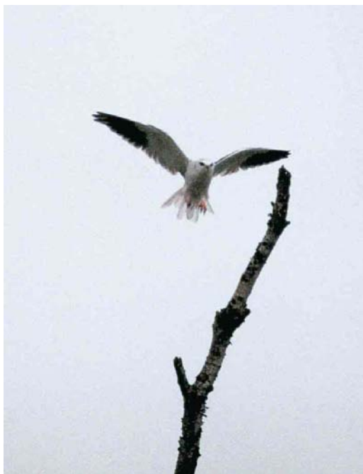
65-66 Grijze Wouw / Black-winged Kite Elanus caeruleus , Meerstalblok, Bargerveen, Drenthe, 28 juli 2000 (Arian van Dam)

ochtend en in de late namiddag en avond zien, terwijl de vogel overdag vaak 'onvindbaar' was. De vogel bleef tot 23 augustus in het gebied. Enkele malen stak hij de nabijgelegen Duitse grens over maar de waarneming is (nog) niet formeel aanvaard voor Duitsland (van der Vliet et al 2001). In het nabijgelegen Zwartemeer, Drenthe, speelde een plaatselijke snackbar enthousiast in op de toeloop van vogelaars door een 'Patatje Grijze Wouw' aan te bieden.