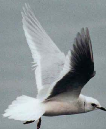
86 Ross's Gull / Ross' Meeuw Rhodostethia rosea , Plym Estuary, Devon, England, March 2002