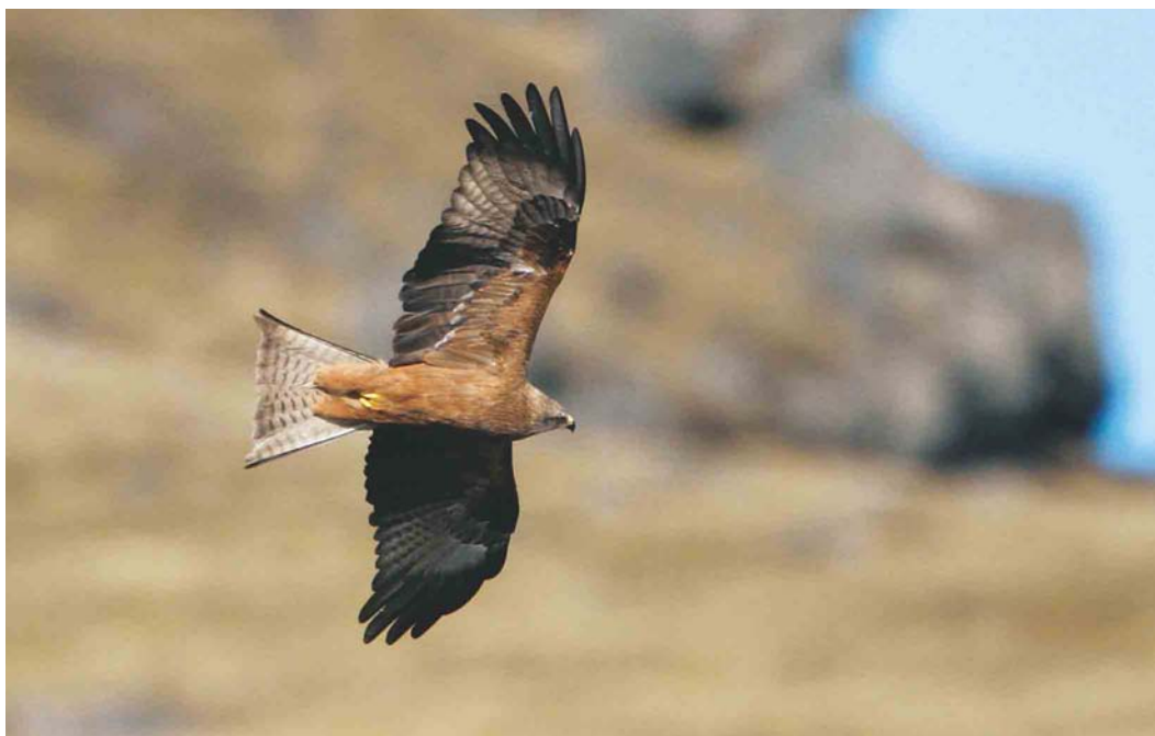
188 Black Kite / Zwarte Wouw Milvus migrans , Höfðabrekka, Mýrdal, Iceland, 11 April 2003 (Daniel Bergmann)

and the second stayed at Øster Hedekrog, Samsø, Jylland, from 27 April into May. In France, one was present at Bouin, Vendée, France, on 15-21 April. The male at Llanfairfechan, Gwynedd, Wales, first seen on 19 January 2001 remained this winter from 3 November 2002 to at least 18 April. The fifth or sixth White-winged Scoter M deglandi for Iceland was a male at Núpasveit from 6 April into May. The long-staying male Steller's Eider Polysticta stelleri first seen in January 1998 as the ninth for Iceland remained at Borgarfjörður Eystri. The fifth Hooded Merganser Lophodytes cucullatus for Iceland was an adult male at Reykjadalur from 18 April onwards. Several long-staying American Black Ducks Anas rubripes were reported during the period, eg, in Scilly on 7 April on St Martin's and on 14 April on Tesco and at Garður, Iceland, into May.