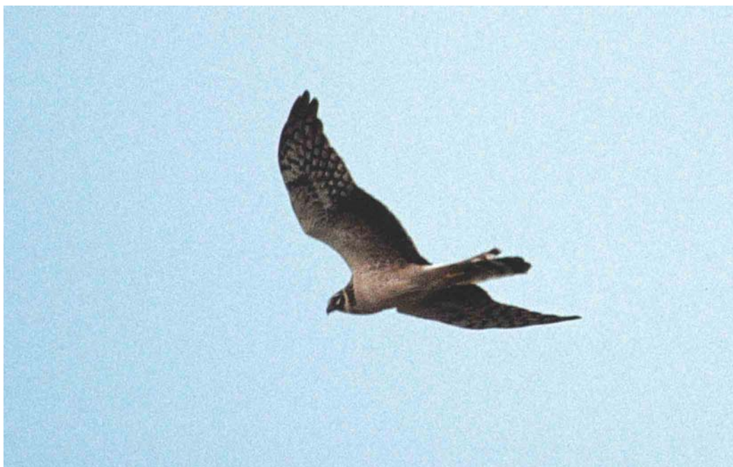
204 Steppekiekendief / Pallid Harrier Circus macrourus , Eemshaven-Oost, Groningen, 26 april 2003

Delta kwamen geen meldingen meer. Ongeveer 18 Zwarte Rotganzen B nigricans werden gezien, vrijwel alle in het Waddengebied. De Grote Tafeleend Aythya valisineria van het Noordhollands Duinreservaat bij Castricum werd voor het laatst gezien op 5 maart. Witoogeenden A nyroca zwommen op 4 en 5 maart bij Windesheim, Overijssel, van 23 maart tot 2 april op het Hijkerveld, Drenthe, van 30 maart tot 29 april op De Baend bij Well, Limburg, op 30 maart (een paar) bij Valkenswaard, Noord-Brabant, vanaf 21 april één, met op 26 april zelfs twee, in het Kromslootpark bij Almere, Flevoland, en op 28 april op de Landschotse Heide, Noord-Brabant. Op 7 maart dook een mannetje Ringsnaveleend A collaris op bij Windesheim. Op 2 april vloog een onvolwassen mannetje Koningseider Somateria spectabilis langs Bloemendaal aan Zee, Noord-Holland. Een mannetje Brilzee-eend Melanitta perspicillata vloog op 22 april langs de Zuidpier van IJmuiden, Noord-Holland. De Ouderkerkerplas, Noord-Holland, leverde al eerder Amerikaanse Smienten Mareca americana op; dit jaar verbleef er één van 6 tot 14 april. Een andere zwom van 30 maart tot 6 april weer in de Reeuwijkse Plassen, Zuid-Holland. Een mannetje Blauwvleugeltaling Anas discors vloog langs Camperduin, Noord-Holland, op 15 april. Van 7 tot 17 maart was een Amerikaanse Wintertaling A carolinensis te zien in de Prunjepolder. Op 20 maart werden ten noorden van de Brouwersdam, Zuid-Holland, c 600 Roodkeelduikers Gavia stellata geteld met daarbij twee