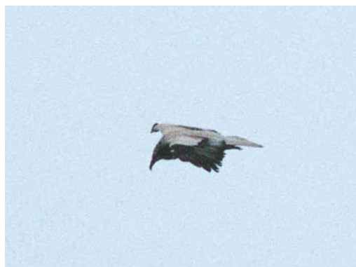
170-171 Aasgier / Egyptian Vulture Neophron percnopterus , adult, Epen, Limburg, 25 mei 2001 (Han Zevenhuizen)

leerd zijn door de mond- en klauwzeer crisis (MKZ) die grote delen van Europa trof. Hierdoor werd het in onder andere Spanje nadrukkelijk verboden om slachtafval en kadavers in de open lucht te laten liggen en kunnen gieren getroffen zijn door voedselschaarste. Omdat de toename van het aantal waarnemingen van gieren in Nederland al van enkele jaren eerder stamt, is dit hooguit een additionele verklaring voor een fenomeen dat bredere oorzaken moet kennen.