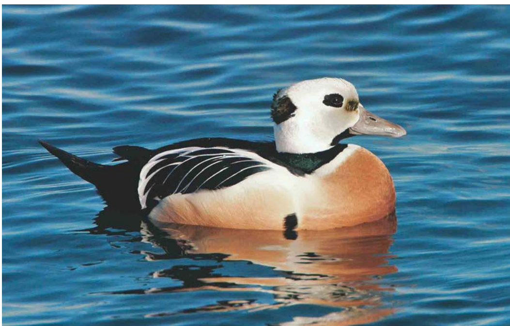
182 Steller's Eider / Stellers Eider Polysticta stelleri , adult male, Borgarfjörður Eystri, Iceland, 23 March 2003