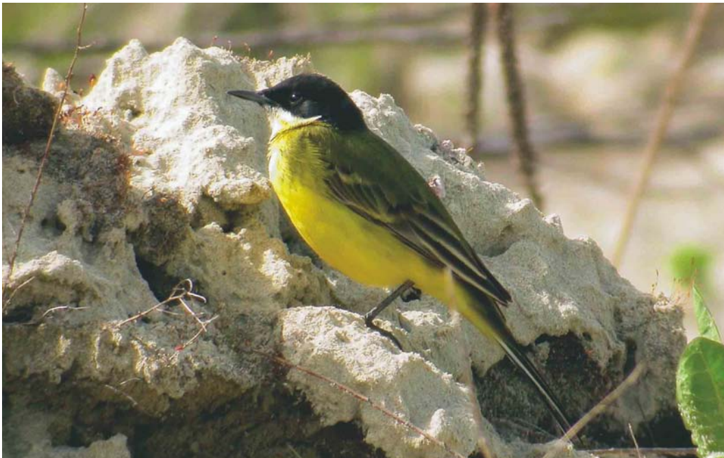
223 Gele kwikstaart / yellow wagtail Motacilla , mannetje, Koningshooikt, Antwerpen, 28 april 2003 (Kris De Rouck)