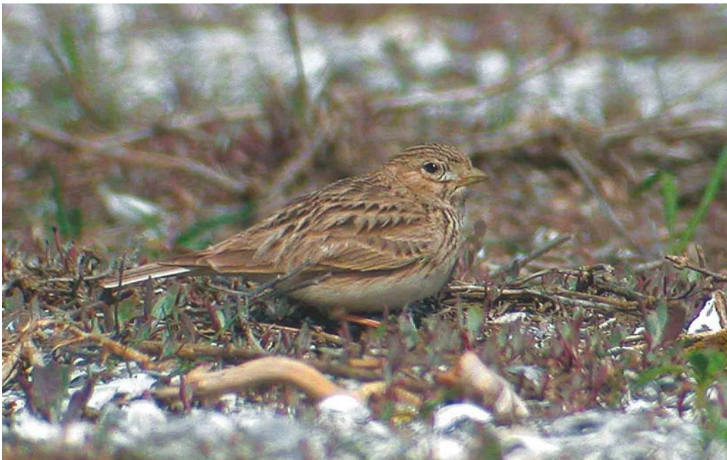
224 Kleine Kortteenleeuwerik / Lesser Short-toed Lark Calandrella rufescens , Zeebrugge, West-Vlaanderen, 27 april 2003 (Koen Verbanck)