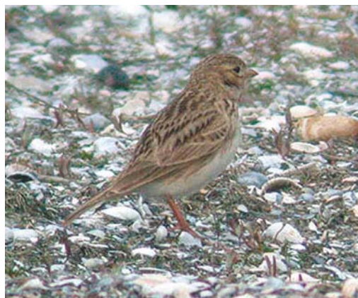
229 Kleine Kortteenleeuwerik / Lesser Short-toed Lark Calandrella rufescens, Zeebrugge, West-Vlaanderen, 27 april 2003