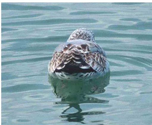
Mystery photograph V (January)