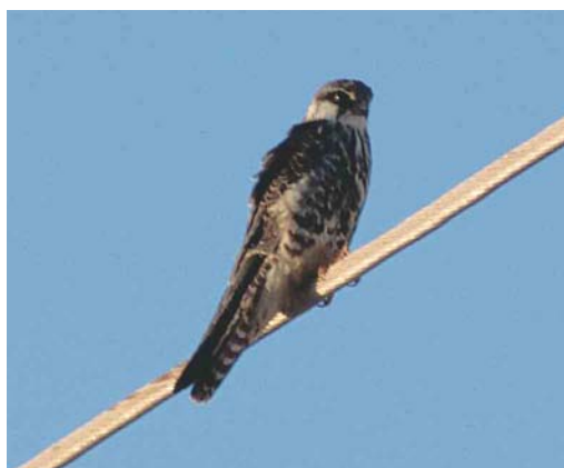
158 Red-footed Falcon / Roodpootvalk Falco vespertinus , first-summer male, Gibraltar Point, Lincolnshire, England, 4 June 1989 (Graham P Catley) 159 Red-footed Falcon / Roodpootvalk Falco vespertinus , adult female, Kirkby Moor, Lincolnshire, England, 15 May 1984 (Graham P Catley) 160 Amur Falcon / Amoerroodpootvalk Falco amurensis , adult male, Sur area, Oman, November 2001 (Marc Duquet) 161 Amur Falcon / Amoerroodpootvalk Falco amurensis , juvenile, Sur area, Oman, November 2001 (Marc Duquet)

mantle. Similarly, some females moult the underbody-feathers during the partial moult, acquiring some new oddly dark-streaked feathers (these are odd-patterned new feathers similar to the few orange feathers on some second calendar-year males; they will be replaced by typical adult feathers during the first complete moult). The same identification characters as above are valid.