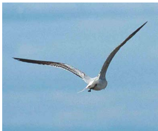
Mystery photograph VI (May)

breast and belly, while Cretzschmar's shows less contrast. In the mystery bird, a difference in colour can be seen between the submoustachial stripe and throat and the darker breast and belly. In Ortolan, the markings on the breast appear, unlike in Cretzschmar's, more as dots than as streaks. The crown-streaks tend to be more prominent in Ortolan than in Cretzschmar's. These crown-streaks border a patch of plain feathers creating a lateral crown stripe, which tends to be narrow in Ortolan. In Cretzschmar's, this lateral crown stripe is broader in front of the eye than in Ortolan and almost meeting above the bill. The mystery bird seems to have dot-shaped markings on its breast, obvious crown-streaks, reaching rather far downwards, creating a narrow supercilium. Furthermore, there is a range of even more variable subtleties in plumage differences. For instance, the dark malar stripe and markings on upper- and underparts tend to be more black-ish and stronger in Ortolan than in Cretzschmar's.