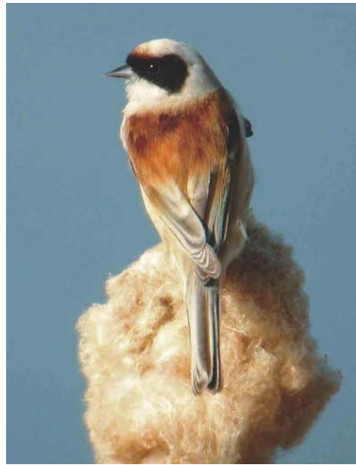
225 Buidelmees / Eurasian Penduline Tit Remiz pendulinus , Lier-Anderstad, Antwerpen, 23 maart 2003 (Kris de Rouck)

bedroeg 136 bij Rijkevorsel, Antwerpen, op 5 april. Op 9 maart pleisterde een adulte Ringsnavelmeeuw L. delawarensis te Roksem, West-Vlaanderen, en op 24 maart was er kortstondig een adulte aanwezig te Bredene. De adulte Grote Burgemeester L. hyperboreus van Oostende werd op 1 maart voor het laatst opgemerkt. Op 15 maart werd een eerste-winter gezien bij Diepenbeek. Langs Knokke trokken op 13 april twee Reuzensterms Sterna caspia en op 20 april vloog een Lachstern Gelochelidon nilotica langs Koksijde, West-Vlaanderen.