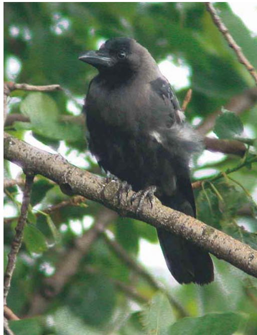
172 House Crows / Huiskraaien Corvus splendens , juvenile (left) and adult, Hoek van Holland, Zuid-Holland, Netherlands, 23 July 1998 (Leo J R Boon/Cursorius) 173 House Crow / Huiskraai Corvus splendens , adult, Hoek van Holland, Zuid-Holland, Netherlands, 28 June 2002 (Leo J R Boon/Cursorius) 174 House Crow / Huiskraai Corvus splendens , adult, Hoek van Holland, Zuid-Holland, Netherlands, 23 February 2002 (Edwin Winkel)