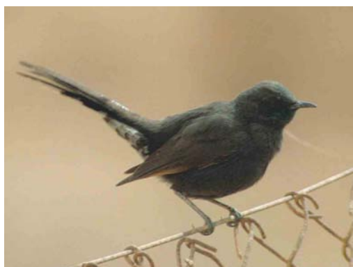
193 Collared Flycatcher / Withalsvliegenvanger Ficedula albicollis , first-summer male, Remolar-Filipines Reserve, Viladecans, Llobregat delta, Barcelona, Spain, 16 April 2003 194 Alpine Swift / Alpengierzwaluw Apus melba , Sizewell, Suffolk, England, 4 May 2003 195 Isabelline Wheatear / Izabeltapuit Oenanthe isabellina , Capo Murro di Porco, Sicily, Italy, 1 April 2003 196 Black Scrub Robin / Zwarte Waaiersstaart Cercotrichas podobe , Yotvata, Israel, April 2003

Greater Spotted Eagle A clanga at Niederriedstausee, Bern, was seen until 15 March (the species has been a winterer here since February 1996). On 6 April, one was noted at Hucel, Haute-Savoie. The fifth Tawny Eagle A rapax for Israel was a second-year over Yotvata on 18 March. An extralimital first-winter Spanish Imperial Eagle A adalberti was seen with a Lammergeier Gypaetus barbatus between Alta Ribagorça and Pallars Jussà, Lleida, Catalonia, on 5 April. A female Amur Falcon Falco amurensis occurred at Shahama, UAE, on 7 April. A male Eleonora's Falcon F eleonorae was watched for a few minutes on Tiree, Argyll, Scotland, on 1 May. A Saker Falcon F cherrug ringed as a nestling in Slovakia on 28 May 2000 appeared to be recovered at Mursuk, Lybia, on 10 October 2000.