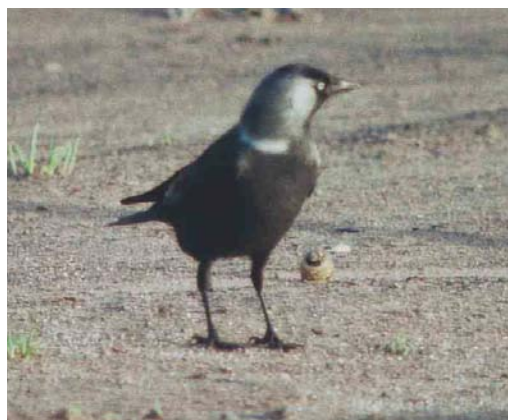
249 Russian Jackdaw / Russische Kauw Corvus monedula soemmerringii , Veendam, Groningen, Netherlands, 3 February 1988. Very contrasting bird with long, broad and white collar, very pale nape and ear coverts and almost black underparts. These features make it very likely that this is an eastern soemmerringii , probably a rare vagrant to the Netherlands.

all other field marks show overlap with monedula . Given these findings, it might be considered to combine at least the western populations of soemmerringii with monedula and restrict soemmerringii to the dark-bodied populations previously named as 'collaris', 'pontocaspicus' and 'ultracollaris'. A result of such a decision would be that many 'eastern jackdaws' could be quite easily distinguished from spermologus by their pale or white neck-patch and collar and the tone of their underparts combined with the vague mottling, and that 'true' soemmerringii would become a real vagrant in western Europe for which acceptable records need thorough documentation. This said, it is obvious that more study is needed to establish the actual range and geographical variation of the various populations of soemmerringii , of which even the easternmost could reach western Europe since they are the most migratory.