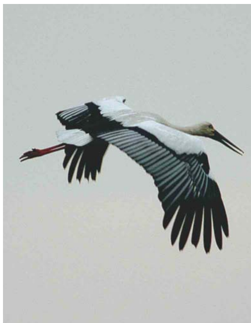
325 Zwartsnavelooievaar / Oriental Stork Ciconia boyciana , adult, Wieringermeer, Noord-Holland, 24 mei 2003

Ooievaar beschouwd. De soort is zwaar beschermd en wordt maar in zeer kleine aantallen in gevangenschap gehouden. In 1987 ging het wereldwijd om 105 vogels die legaal in gevangenschap werden gehouden, waarvan 85 in Azië, 17 in Europa en drie in Noord-Amerika (Hong Kong Bird Rep 1990: 126-148; Dutch Birding 15: 224-225, 1993). In een poging om te achterhalen wat de herkomst van het exemplaar in de Wieringermeer kon zijn, werd contact gezocht met verschillende vogelparken. Vanuit Vogelpark Walsrode, Niedersachsen, Duitsland, werd gemeld dat een geringd vrouwtje (de moeder van c 30 uitgebroede jongen) met een open ring was ontsnapt in het najaar van 2002. In Walsrode bevond zich het enige broedpaar in gevangenschap van Europa en zijn vanaf 1987 jarenlang jongen uitgebroed; in mei 2003 waren echter nog slechts twee (gepaarde) vogels in het park aanwezig (Dieter Rinke in litt). In Parc Paradisio in Cambron, Hainaut, België, worden sinds ten minste 1998 twee exemplaren gehouden; deze vogels waren ongeringd maar wel voorzien van een (niet-zichtbare) chip. Op 17 januari 2003 ontsnapte hier een vrouwtje dat in 1994 in Tokio, Japan, in gevangenschap was uitgebroed. Deze vogel werd nog twee weken in de omgeving van het park gezien en dook vier weken later op in Oost-Vlaanderen en weer twee weken later over de grens bij Rozendaal, Noord-Brabant (Steffen Patzwahl in litt).