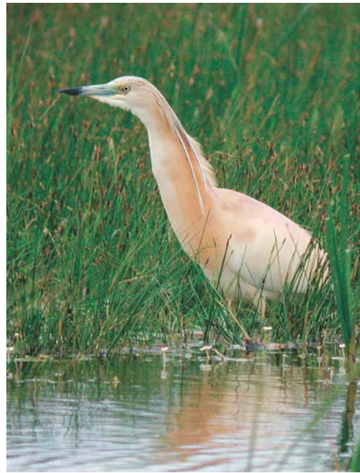
276 Western Reef Egret / Westelijke Rifreiger Egretta gularis , Praia, Santiago, Cape Verde Islands, 12 April 2003 277 Squacco Heron / Ralreiger Ardeola ralloides , Værnengene, Vestjylland, Denmark, 5 June 2003 278 Dalmatian Pelican / Kroeskoppelikaan Pelecanus crispus , Lesvos, Greece, May 2003