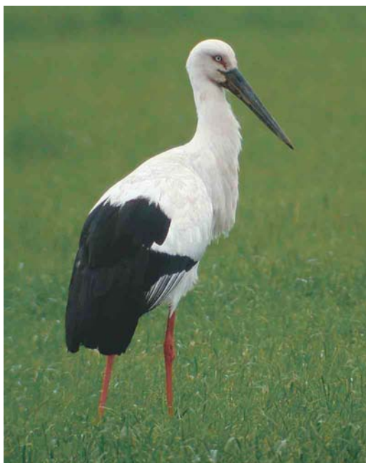
324 Zwartsnavelooievaar / Oriental Stork Ciconia boyciana , adult, Wieringermeer, Noord-Holland, mei 2003