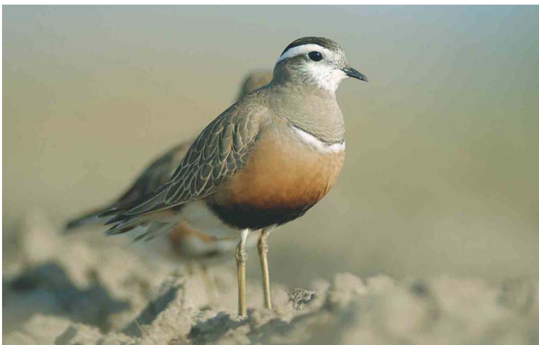
300 Morinelplevier / Eurasian Dotterel Charadrius morinellus , Texel, Noord-Holland, 10 mei 2003