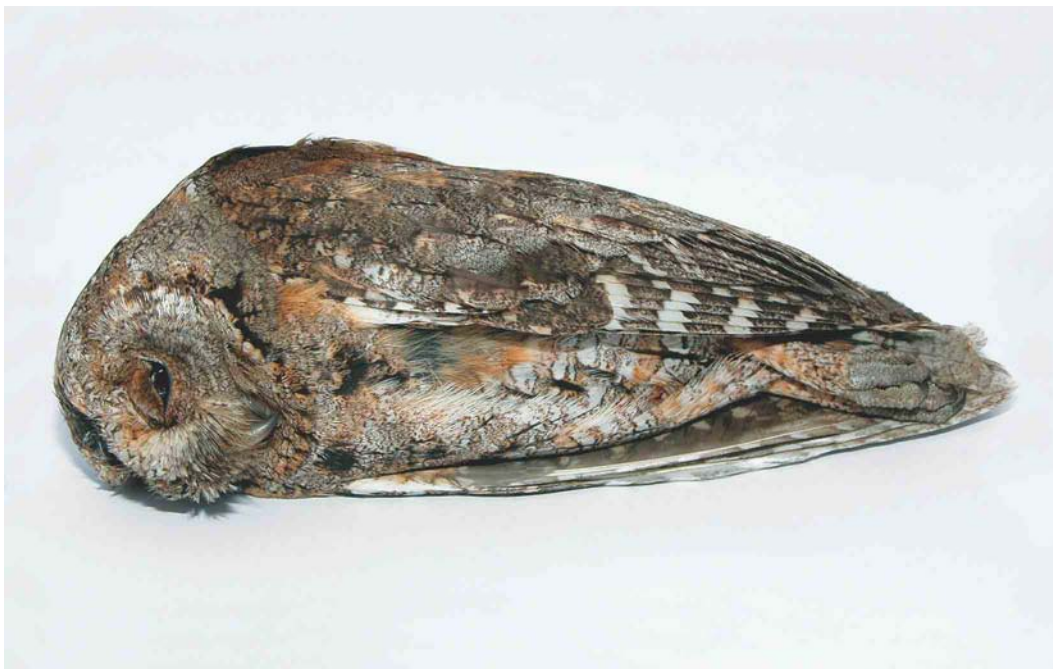
299 Dwergooruil / European Scops Owl Otus scops , Warns, Friesland, 8 mei 2003